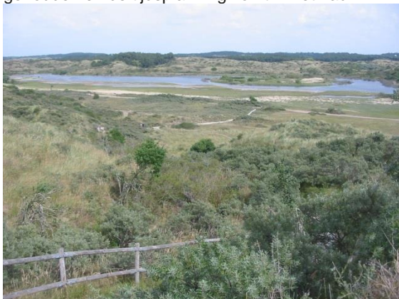
De duine van Zuid Kennemerland.

Uiteindelijk is de hamvraag altijd de financiering. Subsidies zijn alleen bedoeld voor gebieden die in de gebiedsanalyse staan. Hier staat echter de archeologie niet in beschreven. Cultuurhistorie wordt wel besproken, zoals dat een gebied historisch gezien een tuinbouwgebied is. Maar verwachte archeologische resten, bijvoorbeeld gebaseerd op ARCHIS-meldingen, ontbreken. Tegen de tijd dat een terreinbeheerder met een vergunningaanvraag bij de gemeente komt, blijkt archeologisch onderzoek noodzakelijk. Je bent dan al aan het einde van het proces: planaanpassing is dan vaak niet meer mogelijk, in de begroting is er geen rekening mee gehouden en de tijdsplanning komt in het nauw.