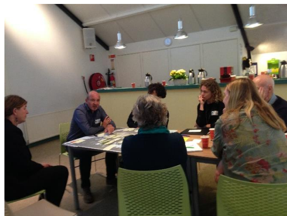
Aan de tafels werd druk overlegd.