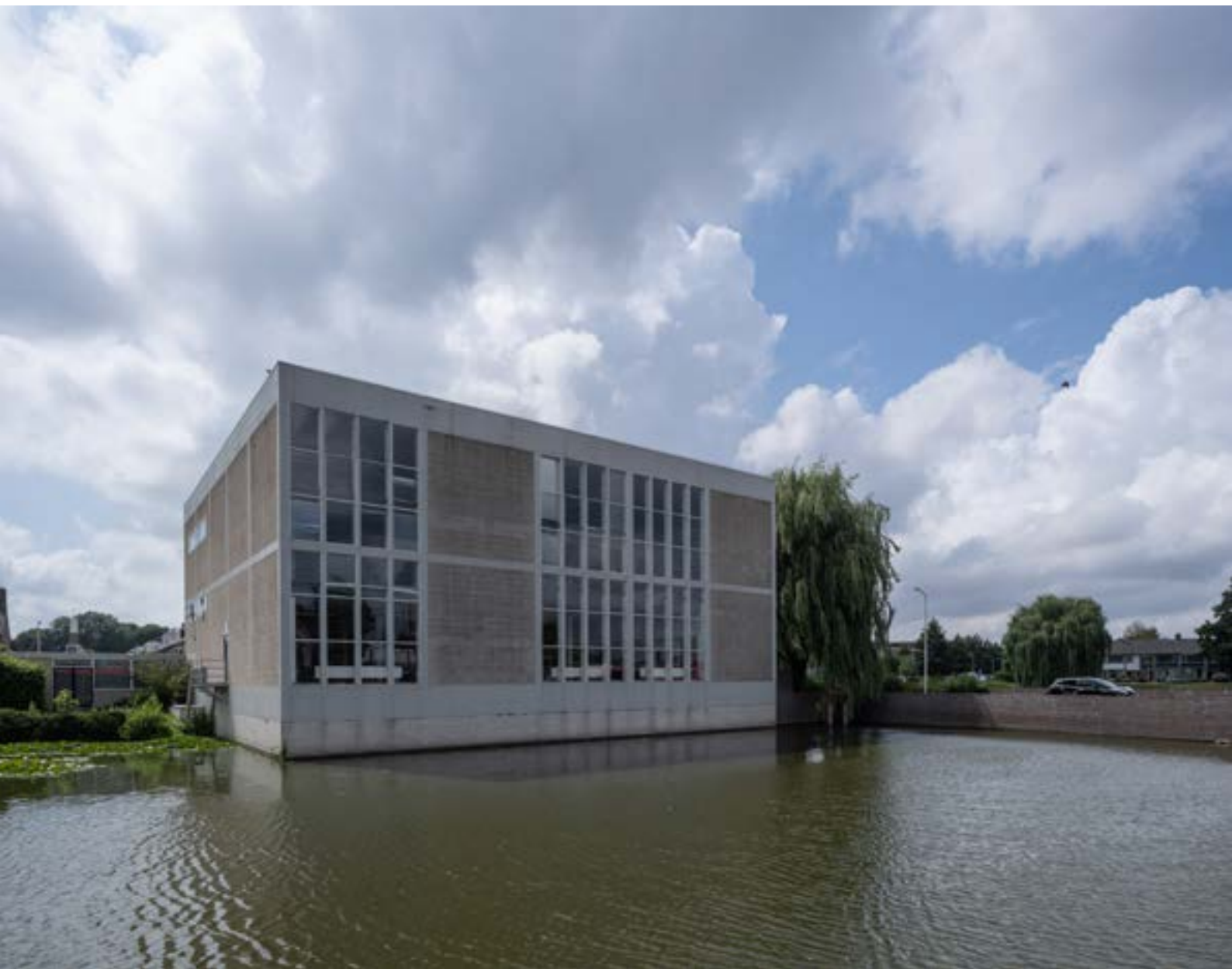
Bij de herbestemming van kerk de Hoeksteen in Uithoorn heeft de gemeente een regisserende rol gehad.