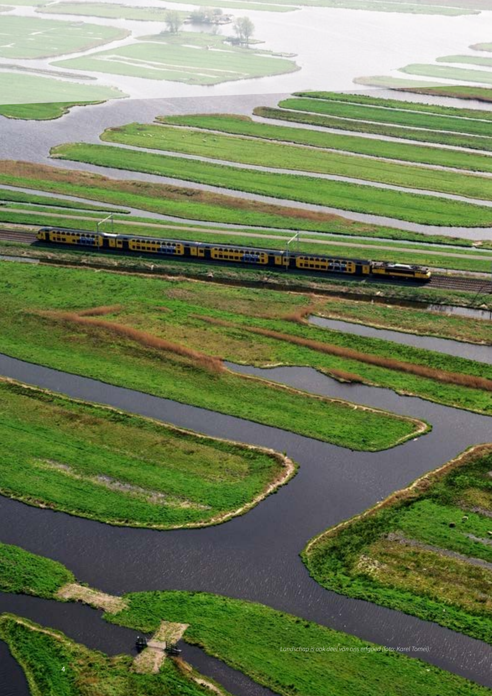
Landschap is ook deel van ons erfgoed.