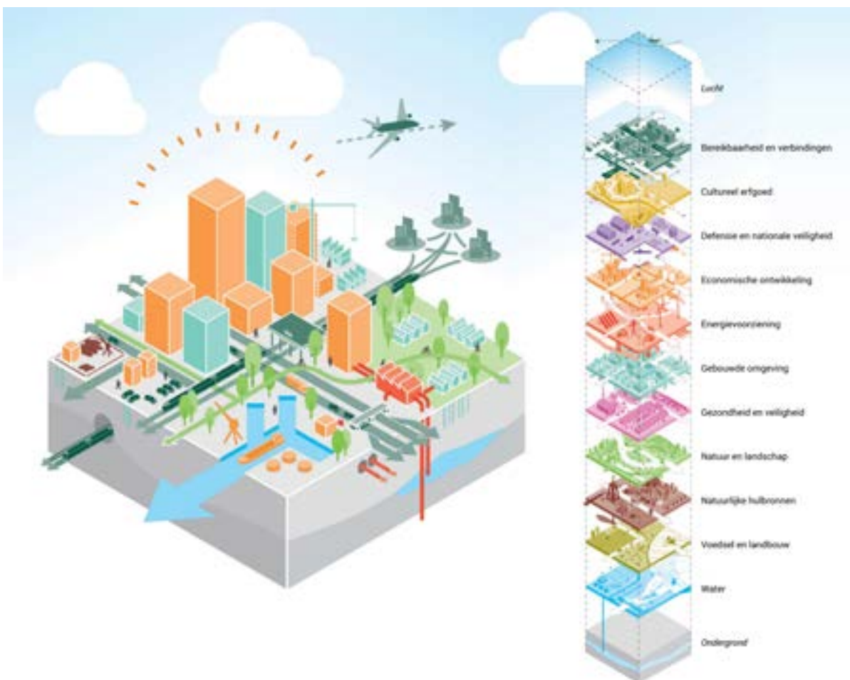
Reikwijdte van de Nationale Omgevingsvisie.