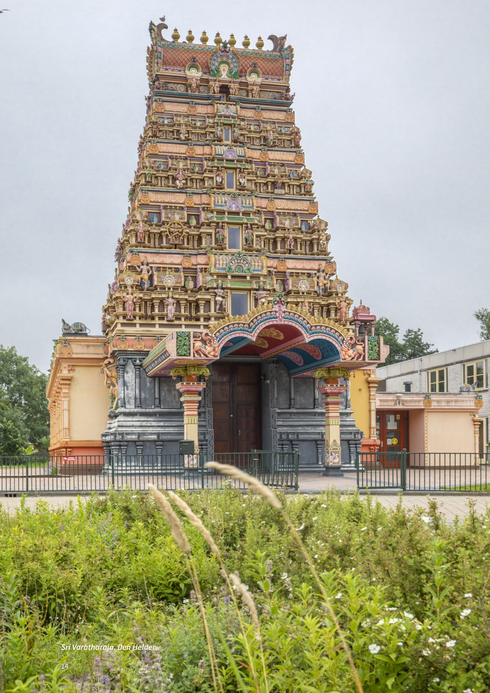
Sri Varātharāja, Den Helder