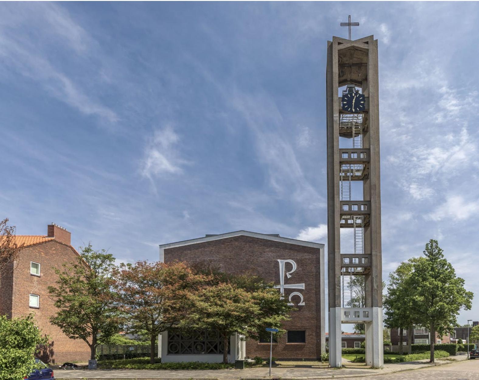
Opstandingskerk, Den Helder

gebruiksmogelijkheid. Maar hij kan ook een open kwalitatieve norm bevatten zoals ‘passen in het straatbeeld’. Bij een open norm kan het handig zijn om de regel te koppelen aan een beleidsregel. Een beleidsregel wordt door het college vastgesteld en bevat een nadere uitwerking van de open norm. Voor het uiterlijk van bouwwerken (nu welstand) is dat zelfs verplicht en is – als uitzondering – het juist de gemeenteraad die de beleidsregel moet vaststellen. Het college dient rekening te houden met de beleidsregel bij de afweging om wel of geen vergunning te verlenen. Daarbij kan advies worden gevraagd, bijvoorbeeld aan de gemeentelijke adviescommissie.