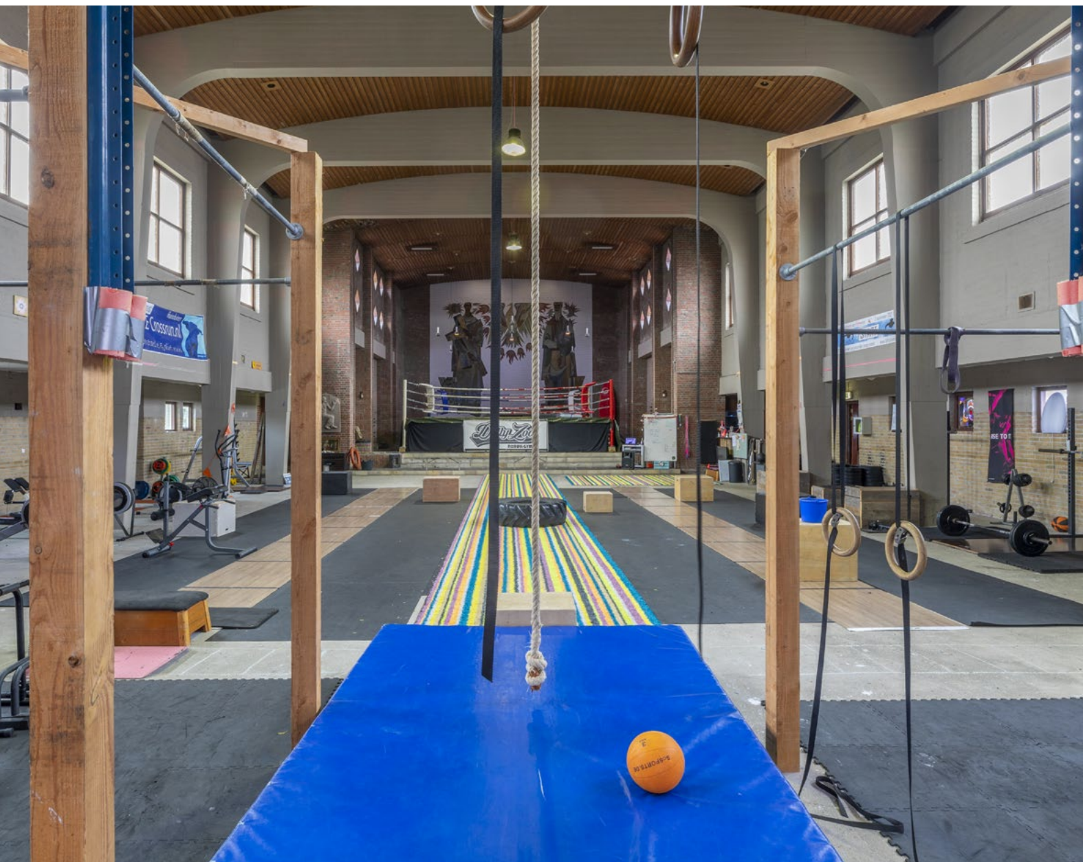
Heilige Nicolaaskerk Den Helder tijdelijk ingericht als sportschool.