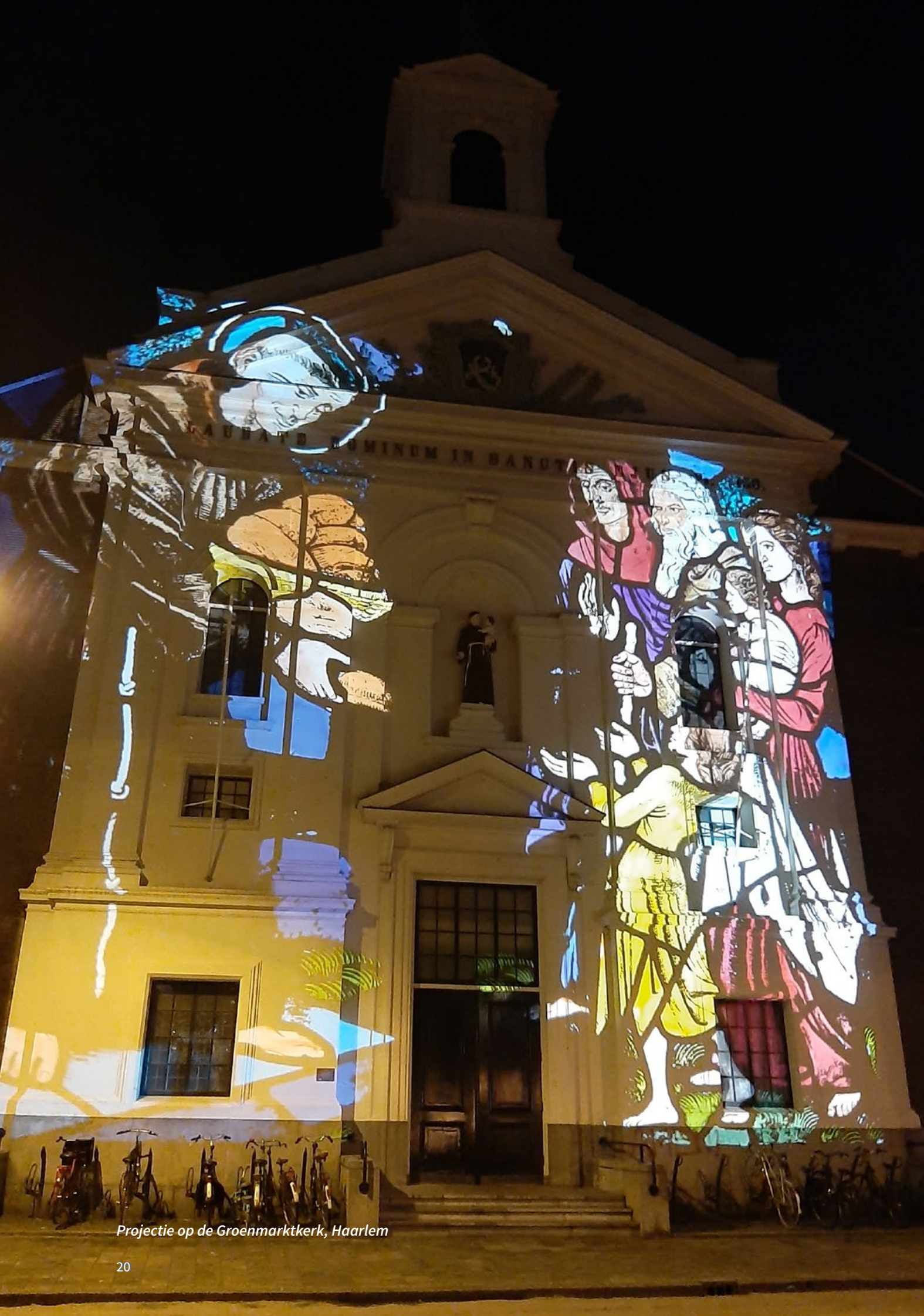
Projectie op de Groenmarktkerk, Haarlem