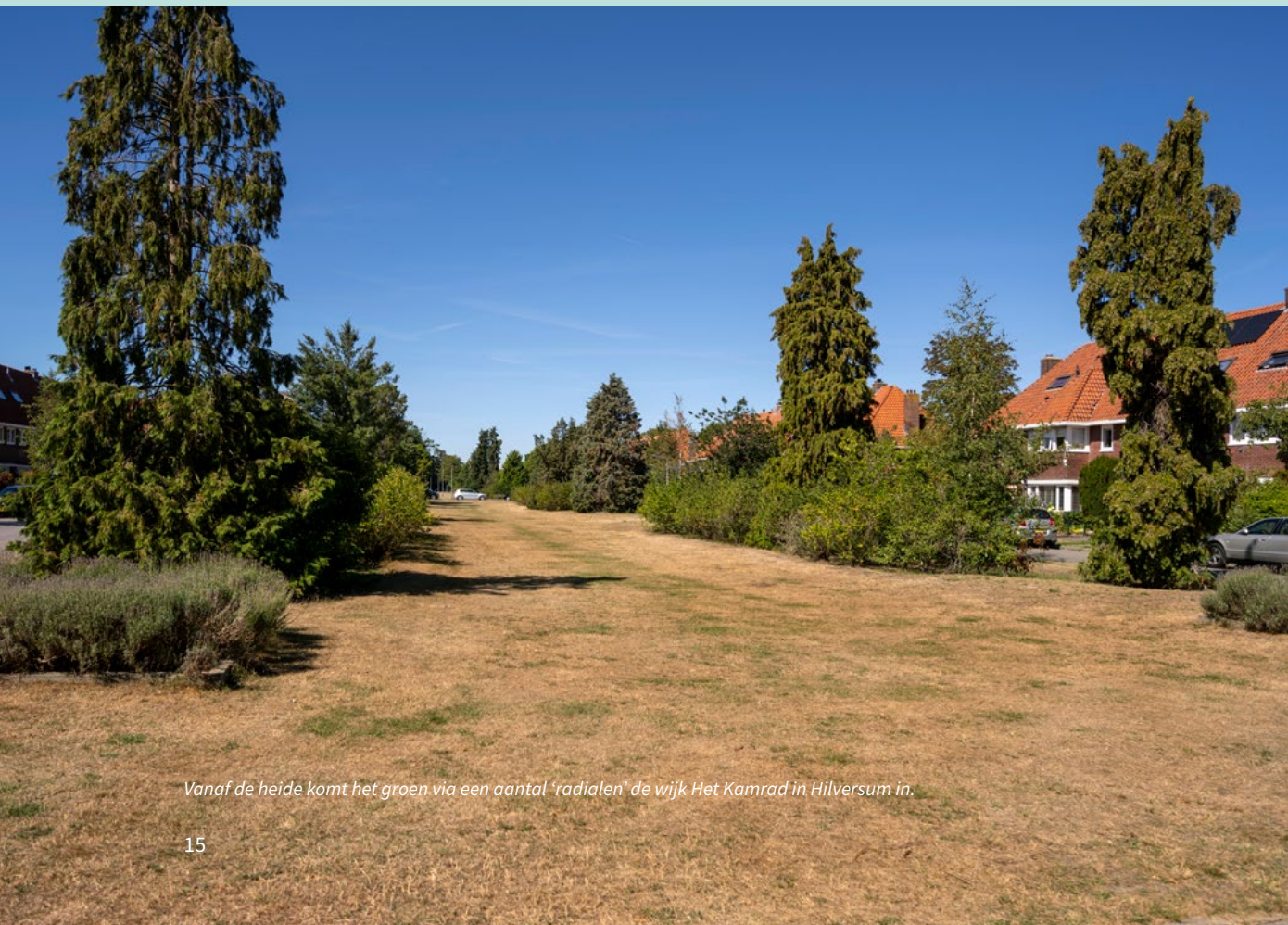
Vanaf de heide komt het groen via een aantal 'radialen' de wijk Het Kamrad in Hilversum in.