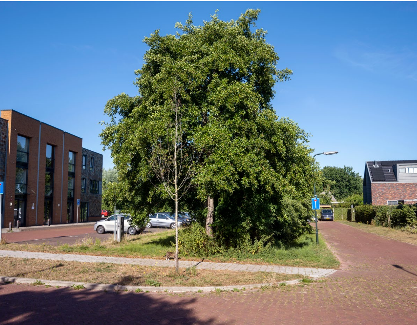
Door het behoud van oude houtwallen staat de relatief nieuwe woonwijk Zuiderloo in Heiloo stevig in het groen.