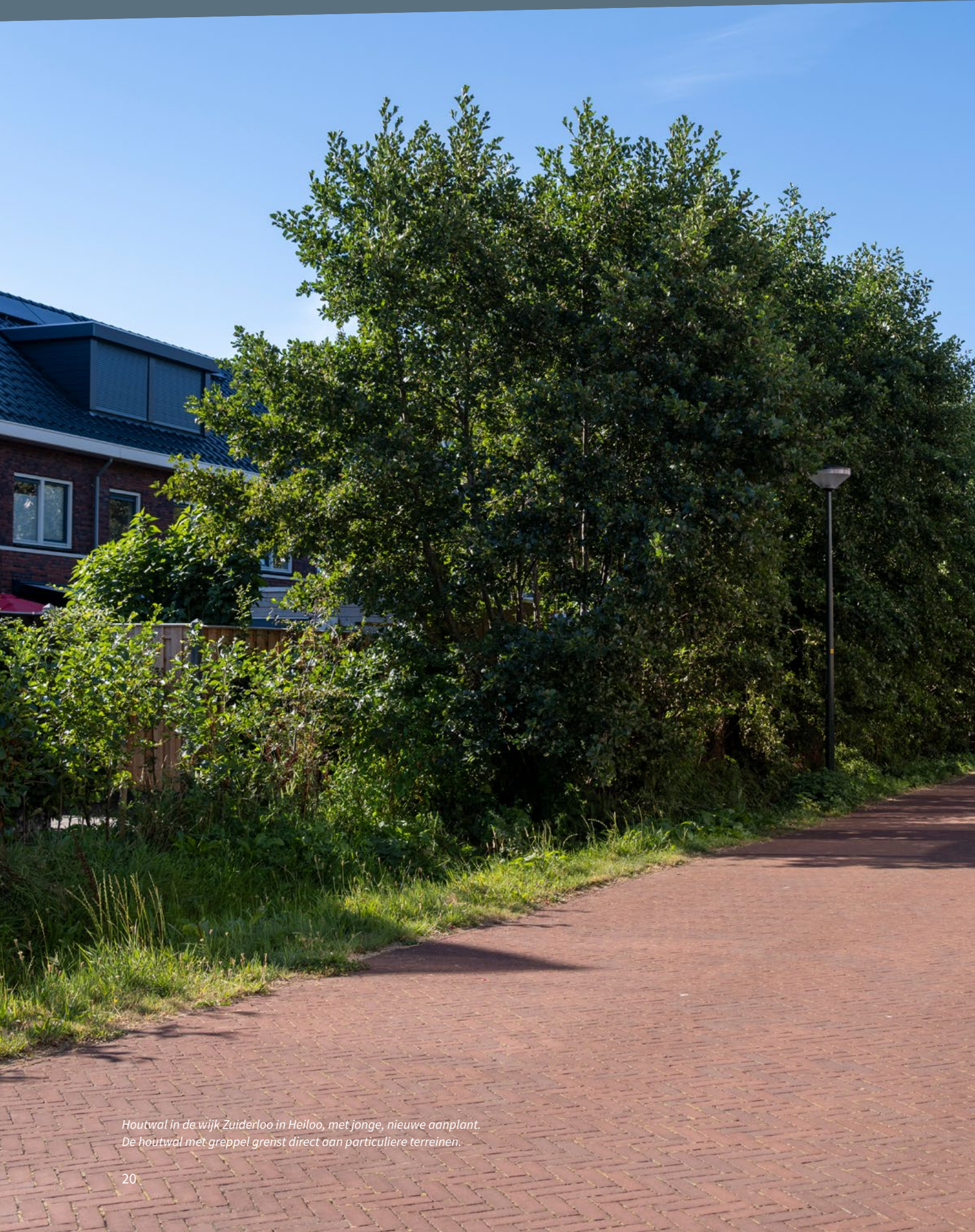
Houtwal in de wijk Zuiderloo in Heiloo, met jonge, nieuwe aanplant. De houtwal met greppel grenst direct aan particuliere terreinen.