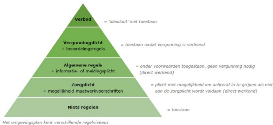
Regelstelsel driehoek, gebaseerd op illustratie Rho adviseurs.

Een ‘werkingsgebied’ geeft aan waar functies en regels voor bepaalde activiteiten van toepassing zijn. Door de koppeling van een regel aan een werkingsgebied is de regel in het Omgevingsloket als onderdeel van het DSO alleen zichtbaar op de locaties waar deze regel van toepassing is. Als geen werkingsgebied wordt aangegeven is de regel van toepassing op het gehele plangebied.