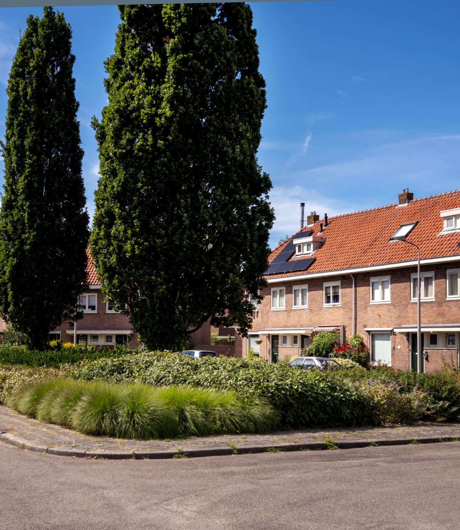
Een sterke relatie tussen het groen (plantsoen) en de opzet van de woningen aan de Jan Huddestraat in Elsrijk-West, Amstelveen.