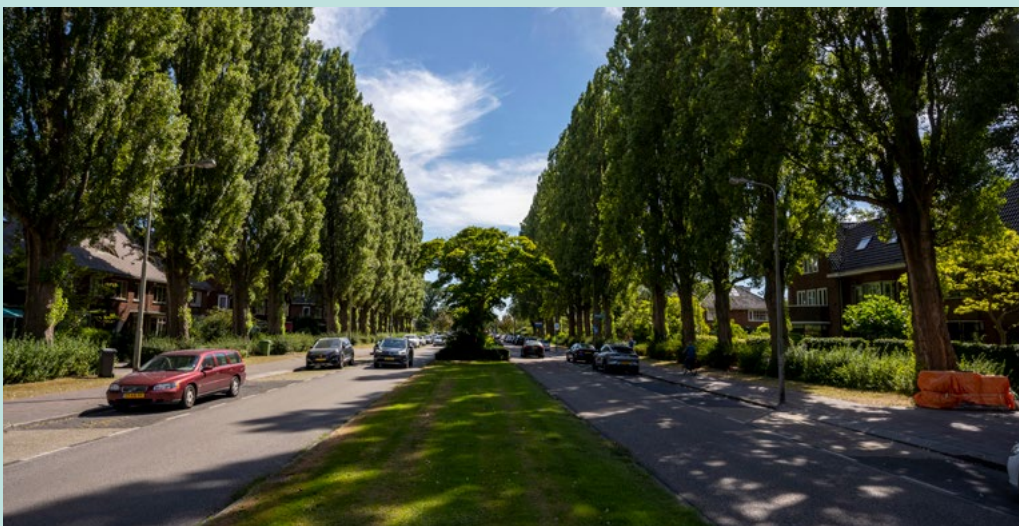
De laan van Italiaanse populieren langs de Keizer Karellaan vormt de entree van de wijk Elsrijk-West in Amstelveen.