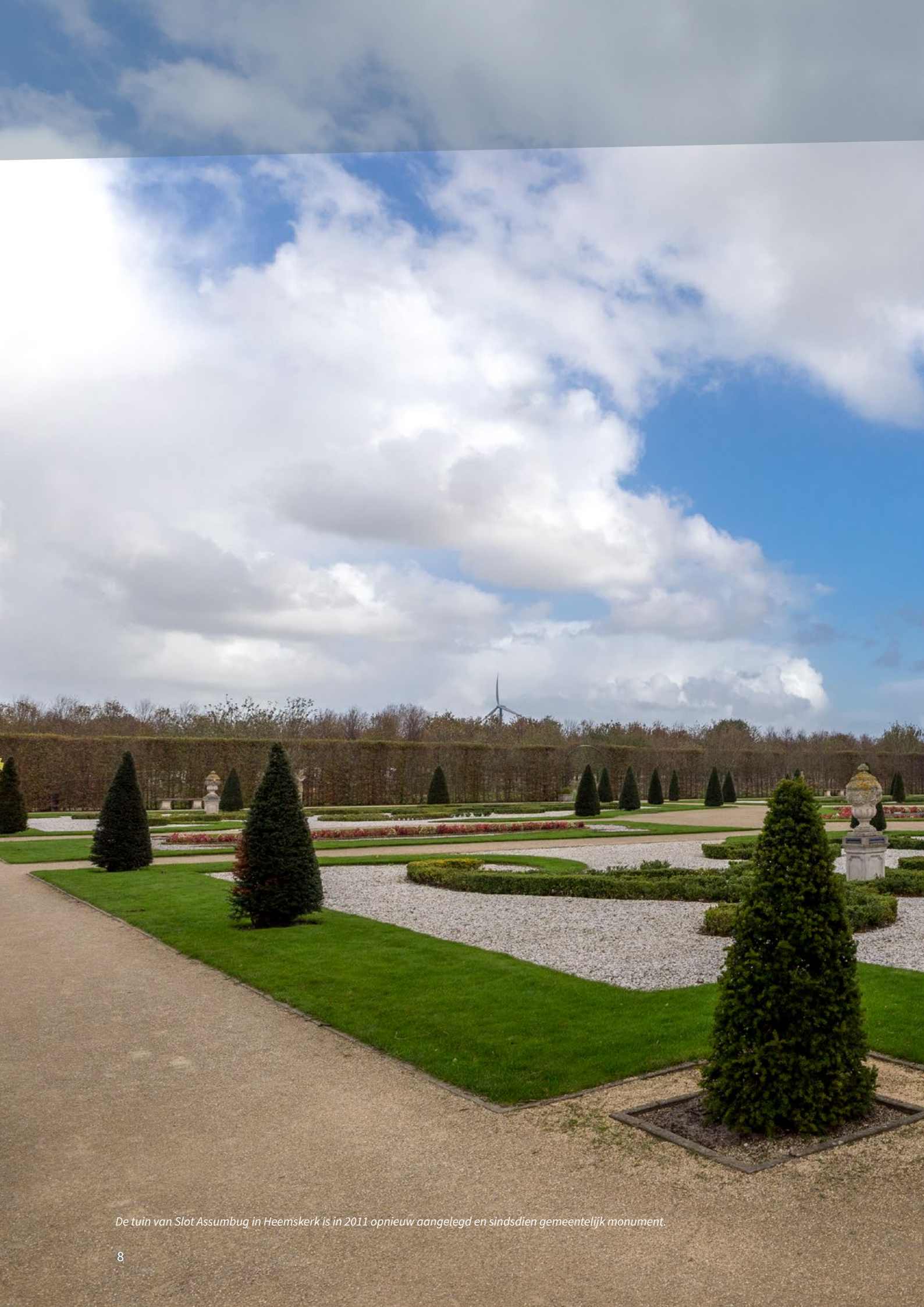
De tuin van Slot Assumburg in Heemskerk is in 2011 opnieuw aangelegd en sindsdien gemeentelijk monument.