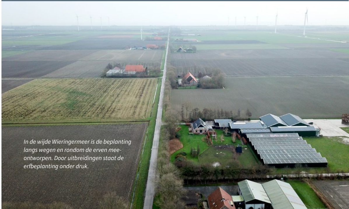
In de wijde Wieringermeer is de beplanting langs wegen en rondom de erven meentworpen. Door uitbreidingen staat de erfbeplanting onder druk.

Het spectrum aan groen erfgoed is breed en de mogelijkheden om het te beschermen zijn divers. Daarom staan verspreid in deze handreiking als intermezzo's vijf voorbeelden van groen erfgoed en wordt toegelicht hoe verschillende gemeenten de waarden in hun huidige beleid borgen.