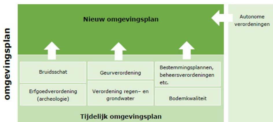
Van tijdelijk naar nieuw omgevingsplan.

De bruidsschat is onderdeel van het tijdelijke omgevingsplan. Dit zijn de regels die nu nog door het Rijk worden gesteld, maar die niet meer terugkomen in de Omgevingswet en worden overgeheveld naar de gemeente. De bruidsschat blijft intact tot en met 31 december 2029, of totdat de gemeente de regels wijzigt, schrapt of overneemt in het nieuwe omgevingsplan.