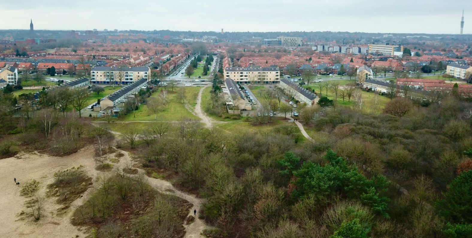
De wijk Het Kamrad in Hilversum is zo opgezet dat het groen van het buitengebied tot diep in het stedelijk gebied doordringt.

voortdurende aanpassingen. Aan die historische ‘gelaagdheid’ is de ontwikkelingsgeschiedenis afleesbaar. Oudere lagen van de tuin kunnen ook archeologische waarde hebben, zelfs als ze niet zichtbaar zijn. Groen erfgoed is daarom voor verschillende wetenschappelijke disciplines van belang: voor tuin- en cultuurhistorie, botanie, horticultuur en archeologie. Nader onderzoek levert vaak nuttige informatie op die direct toepasbaar is. Zo bestaan er in Engeland en Zweden nog veel oude lindelanen met bomen afkomstig van Nederlandse kwekerijen. Dat soort kennis is nuttig bij de restauratie van historische beplantingen.