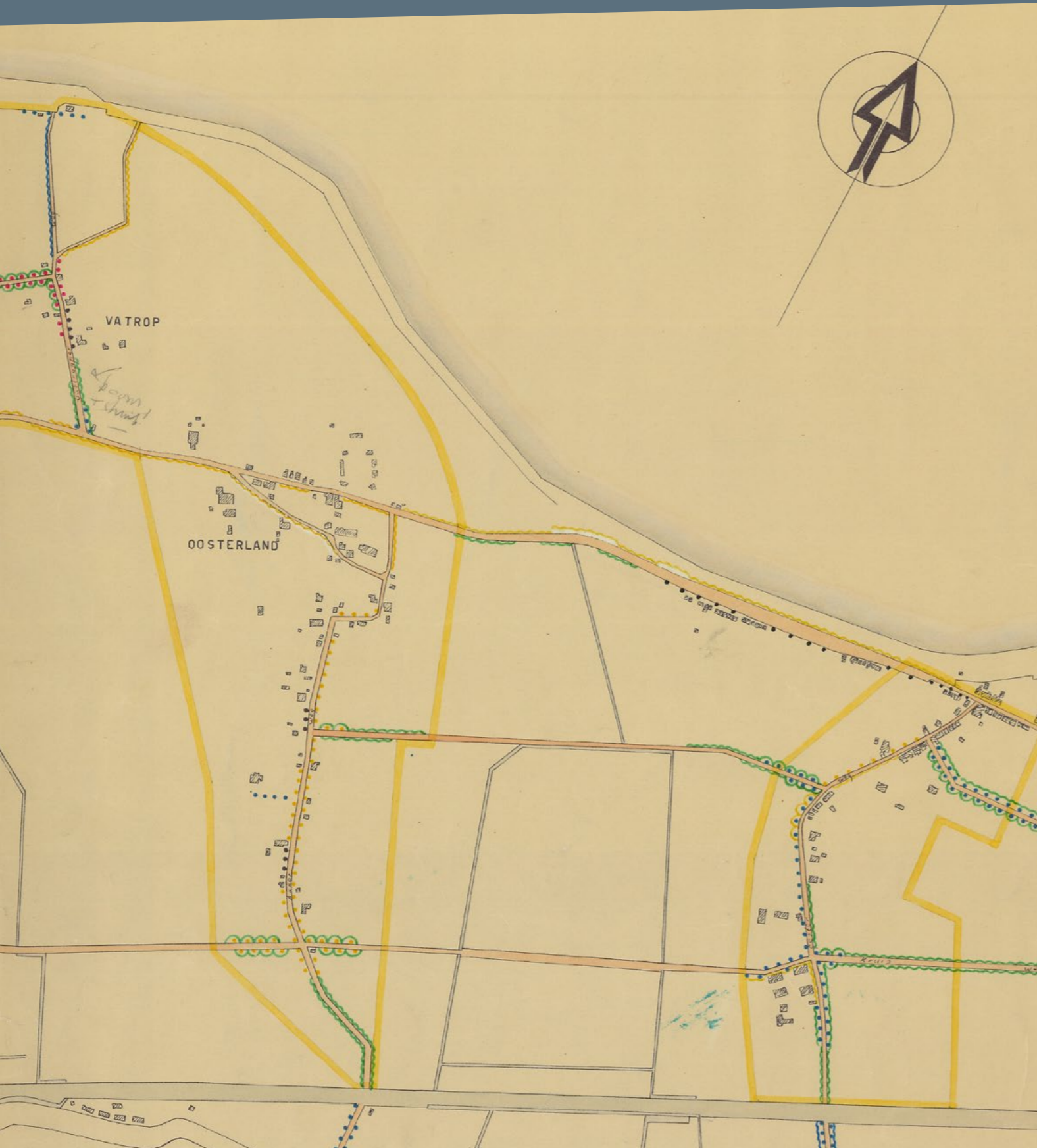
Uitsnede van Landschapsplan Wieringen, uit 1938. In de tijd van de ruilverkaveling is voor het voormalige eiland een beplantingsplan ontworpen. De hoger gelegen delen (geel omrand) zijn met beplanting aangezet. De dorpen hebben 'groene entrees' van bomen (stippen, elke kleur is een soort) en struikbeplanting (kartellijnen). Bron Speciale collecties Wageningen Universiteit.

Het landschapsplan van Wieringen is tot in detail uitgevoerd. Op de hogere delen van het voormalige eiland werden in de ruilverkaveling net na de Tweede Wereldoorlog de tuinwallen (erfafscheidingen van opgestapelde plaggen) opgeruimd en plaatsen de ontwerpers er iepenstruweellanen voor terug. Door deze lanen zijn de hogere delen besloten met af en toe een doorzicht naar de weidse open polder. Vanuit de lage polders waar elke beplanting achterwege werd gelaten betreed je hoger gelegen buurtschappen door groene entrees van es, esdoorn, iep en soms met meidoorn, sleedoorn, vlier en wilg. Nu, meer dan zeventig jaar later is het landschap door de beplantingen nog steeds goed te lezen en te ervaren. De groenstructuren hebben geen specifieke aanduiding in de beheerverordening van het buitengebied.