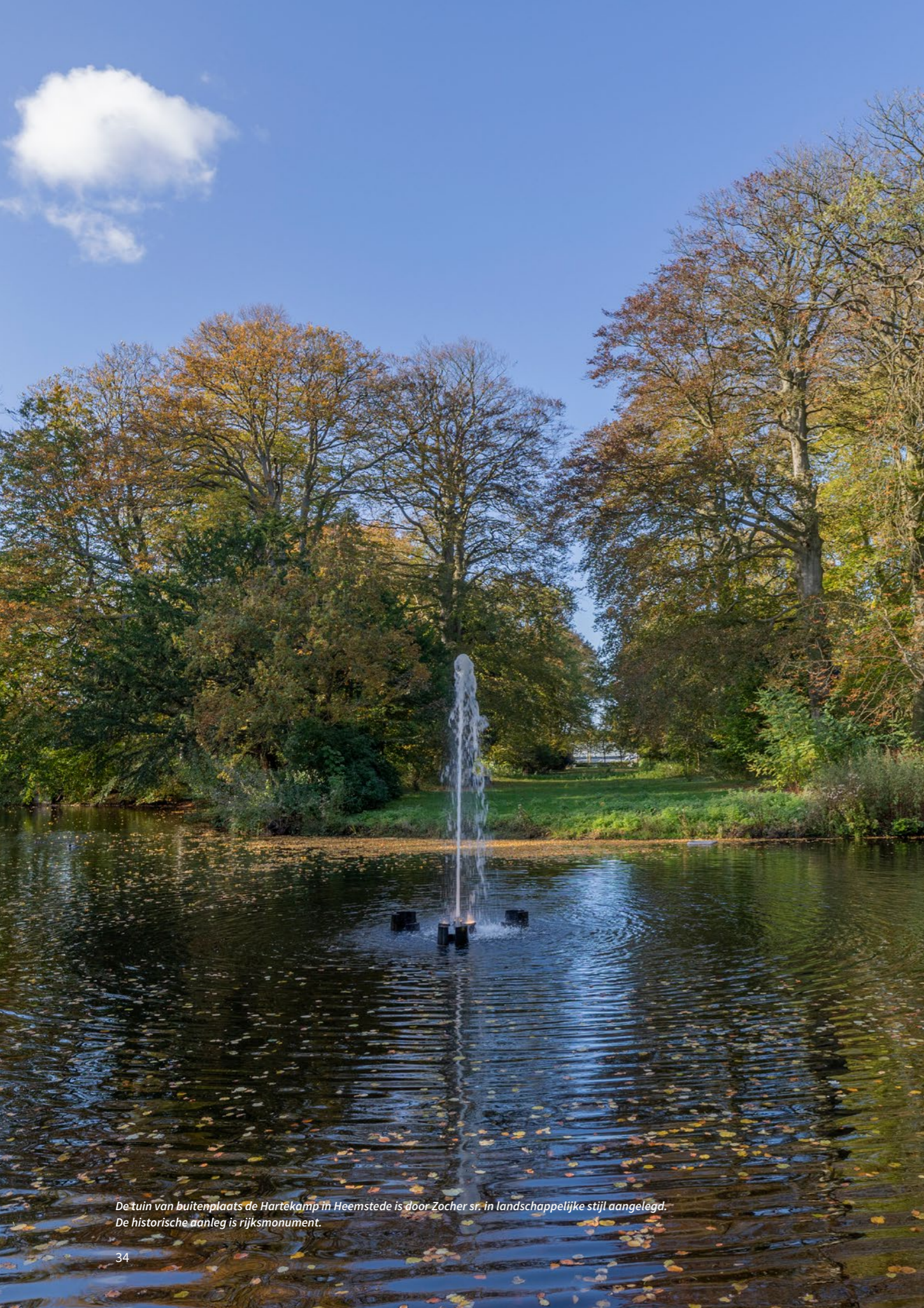
De tuin van buitenplaats de Hartekamp in Heemstede is door Zocher sr. in landschappelijke stijl aangelegd. De historische aanleg is rijksmonument.