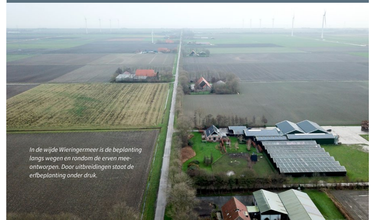
In de wijde Wieringermeer is de beplanting langs wegen en rondom de erven mee-ontworpen. Door uitbreidingen staat de erfbeplanting onder druk.

Het spectrum aan groen erfgoed is breed en de mogelijkheden om het te beschermen zijn divers. Daarom staan verspreid in deze handreiking als intermezzo's vijf voorbeelden van groen erfgoed en wordt toegelicht hoe verschillende gemeenten de waarden in hun huidige beleid borgen.