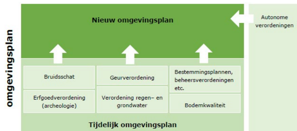
Van tijdelijk naar nieuw omgevingsplan.

De bruidsschat is onderdeel van het tijdelijke omgevingsplan. Dit zijn de regels die nu nog door het Rijk worden gesteld, maar die niet meer terugkomen in de Omgevingswet en worden overgeheveld naar de gemeente. De bruidsschat blijft intact tot en met 31 december 2029, of totdat de gemeente de regels wijzigt, schrapt of overneemt in het nieuwe omgevingsplan.