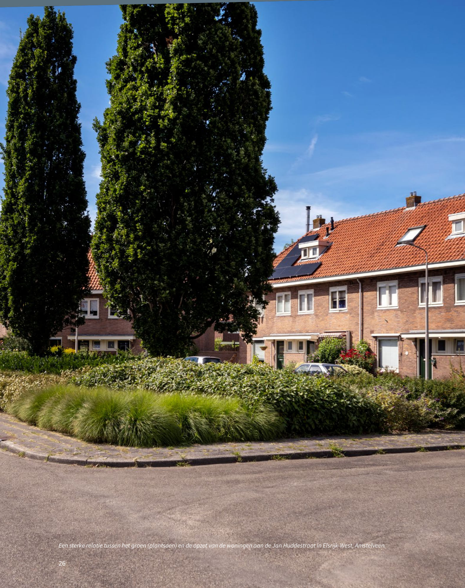
Een sterke relatie tussen het groen (plantsoen) en de opzet van de woningen aan de Jan Huddestraat in Elsrijk-West, Amstelveen.