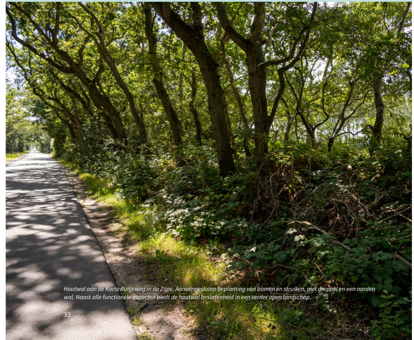
Houtwal aan de Korte Ruigeweg in de Zijpe. Aaneengesloten beplanting van bomen en struiken, met greppel en een aarden wal. Naast alle functionele aspecten biedt de houtwal beslotenheid in een verder open landschap.

Voor gewone onderhoudswerkzaamheden om bestaande beplanting en aanleg in stand te houden is geen vergunning nodig, want de beschermde aanleg en soort beplanting worden dan niet gewijzigd, denk aan snoeien, wieden, maaien, dunnen van bomen en heesters. Een monumentenstatus is in principe gericht op de langdurige instandhouding van de monumentale waarden van het object.