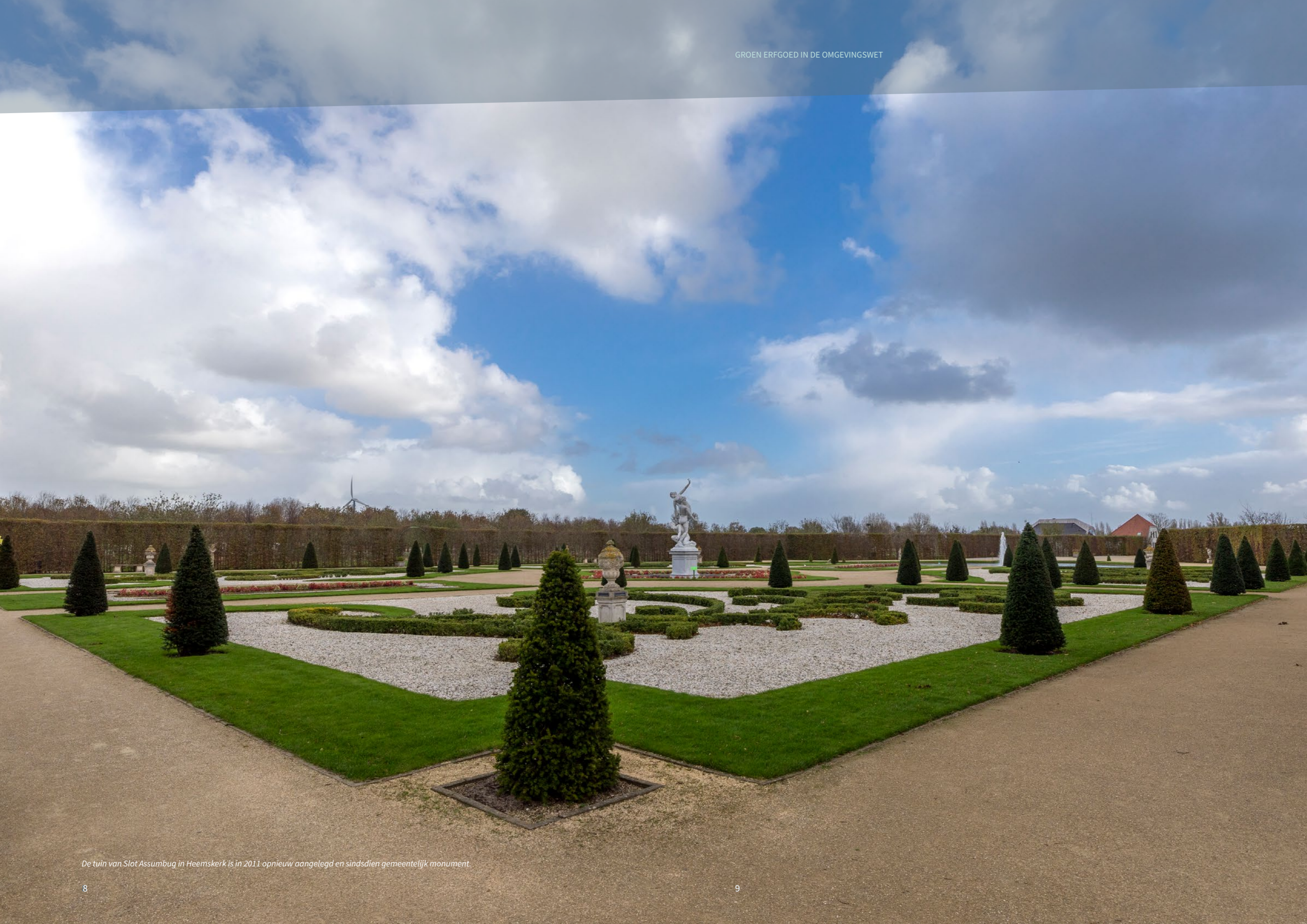
De tuin van Slot Assumbug in Heemskerk is in 2011 opnieuw aangelegd en sindsdien gemeentelijk monument.