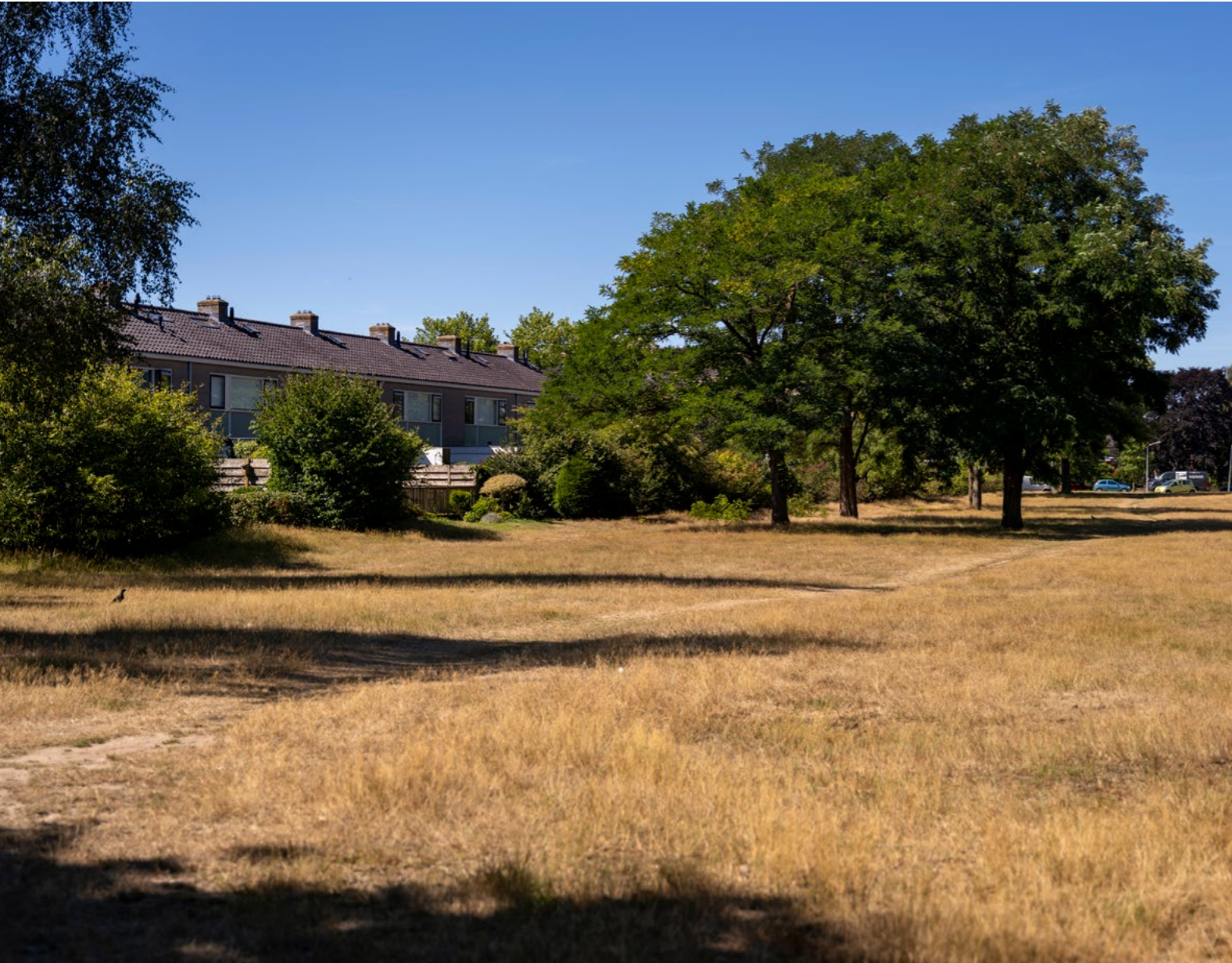
De overgang tussen openbaar groen en de particuliere tuinen van de woningen in de wijk Het Kamrad in Hilversum is 'zacht', er staan geen schuttingen. De paden in het plantsoen zijn niet verhard.