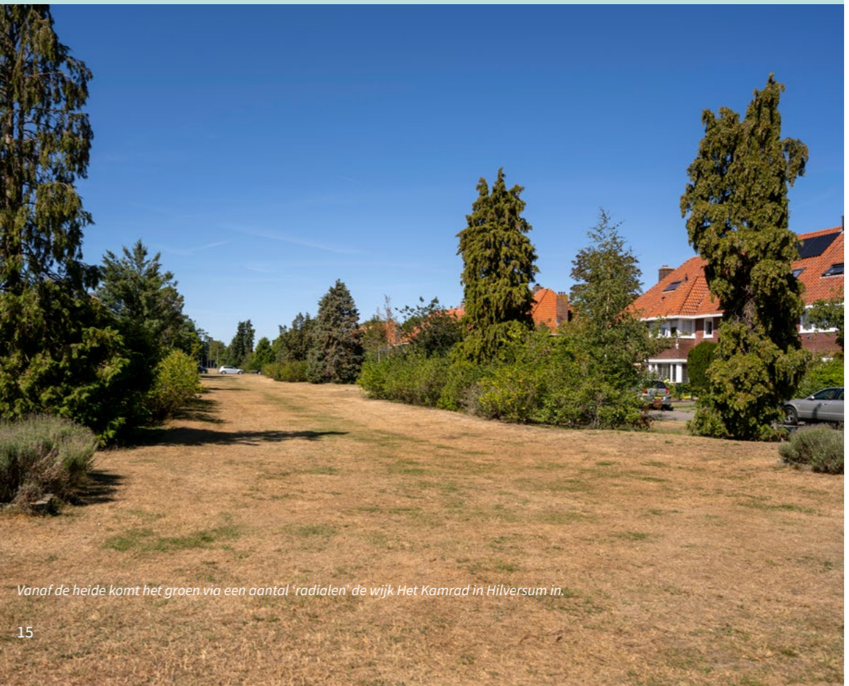
Vanaf de heide komt het groen via een aantal 'radialen' de wijk Het Kamrad in Hilversum in.

optiek van natuurbescherming. De natuurwaarden zijn afhankelijk van de kwaliteit en kwantiteit van de aanwezige flora en fauna, het landschap en de geologische gesteldheid. Om de natuurwaarden en -kwaliteit te beschermen bestaat natuurbeleid op Europees- en rijksniveau met Natura 2000-gebieden en het Natuur Netwerk Nederland (NNN). Menselijke activiteit kan zorgen voor hoge natuurwaarden. De stinzenbeplanting van buitenplaatsen, pastorietuinen en boerderijen is door mensen aangebracht. En in hakhoutbosjes kan een grote variëteit aan bijzondere, zeldzame soorten leven. Ook andere kleine aangelegde structuren in het landschap zoals hagen en houtwallen kunnen beschutting, voedsel en nestgelegenheid voor dieren bieden.