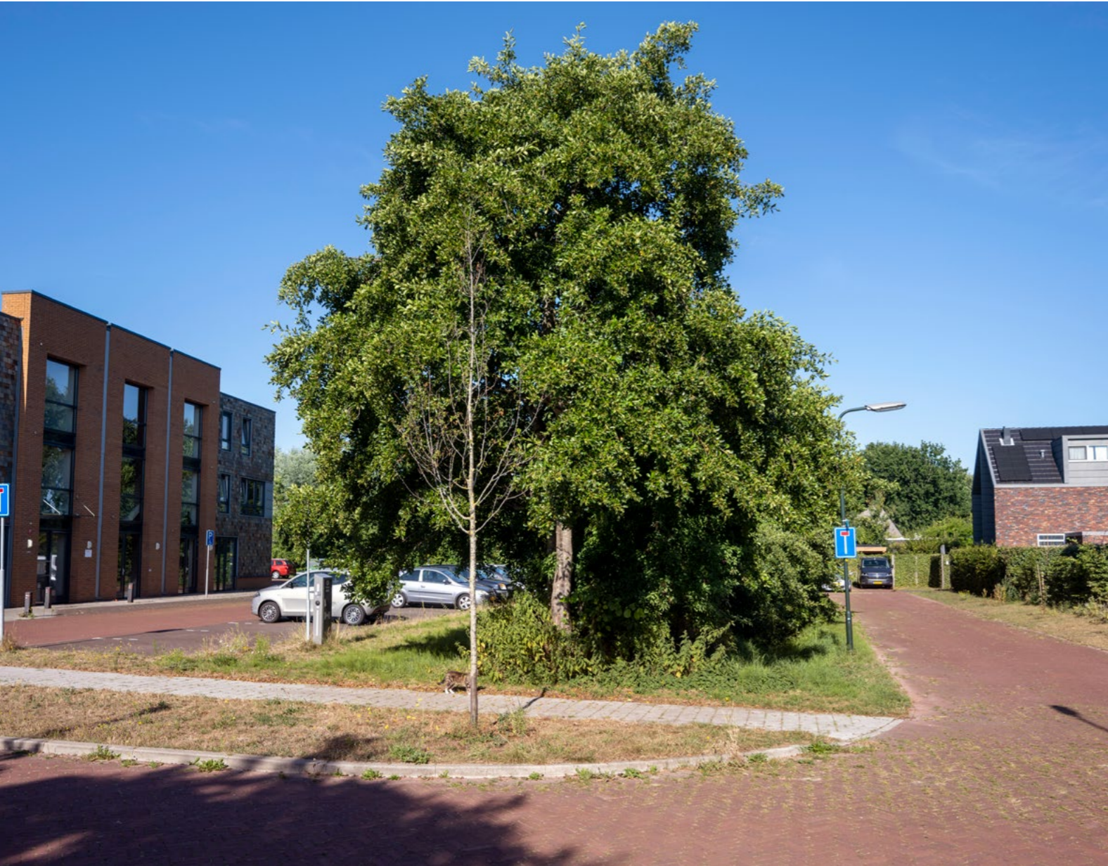
Door het behoud van oude houtwallen staat de relatief nieuwe woonwijk Zuiderloo in Heiloo stevig in het groen.

Wat maakt groen erfgoed? Zodra groen een ‘cultuurhistorische waardestelling’ krijgt en we het kunnen identificeren en (h)erken- nen, zegt de Rijksdienst voor het Cultureel Erfgoed (RCE). 1 Een waardestelling van het groen is een belangrijk argument om historisch groen beleidsmatig te bescher- men. Waarderingen wegen ook mee bij advisering en vergunningverlening wan- neer groene elementen, structuren of oppervlakten gewijzigd worden of een nevenfunctie krijgen. Er zijn meerdere waarderingcriteria voor groen erfgoed te onderscheiden. Een aantal valt onder de hoofdcategorie monumentale waarden. Naast monumentale waarden zijn kunnen ook bepaalde natuur- en gebruikswaarden bijdragen aan ecosystemendiensten.