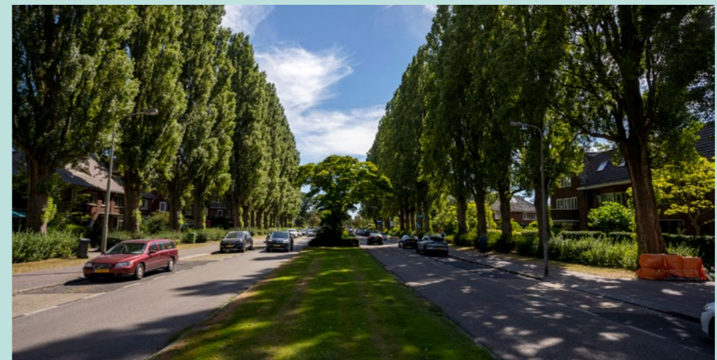
De laan van Italiaanse populieren langs de Keizer Karellaan vormt de entree van de wijk Elsrijk-West in Amstelveen.