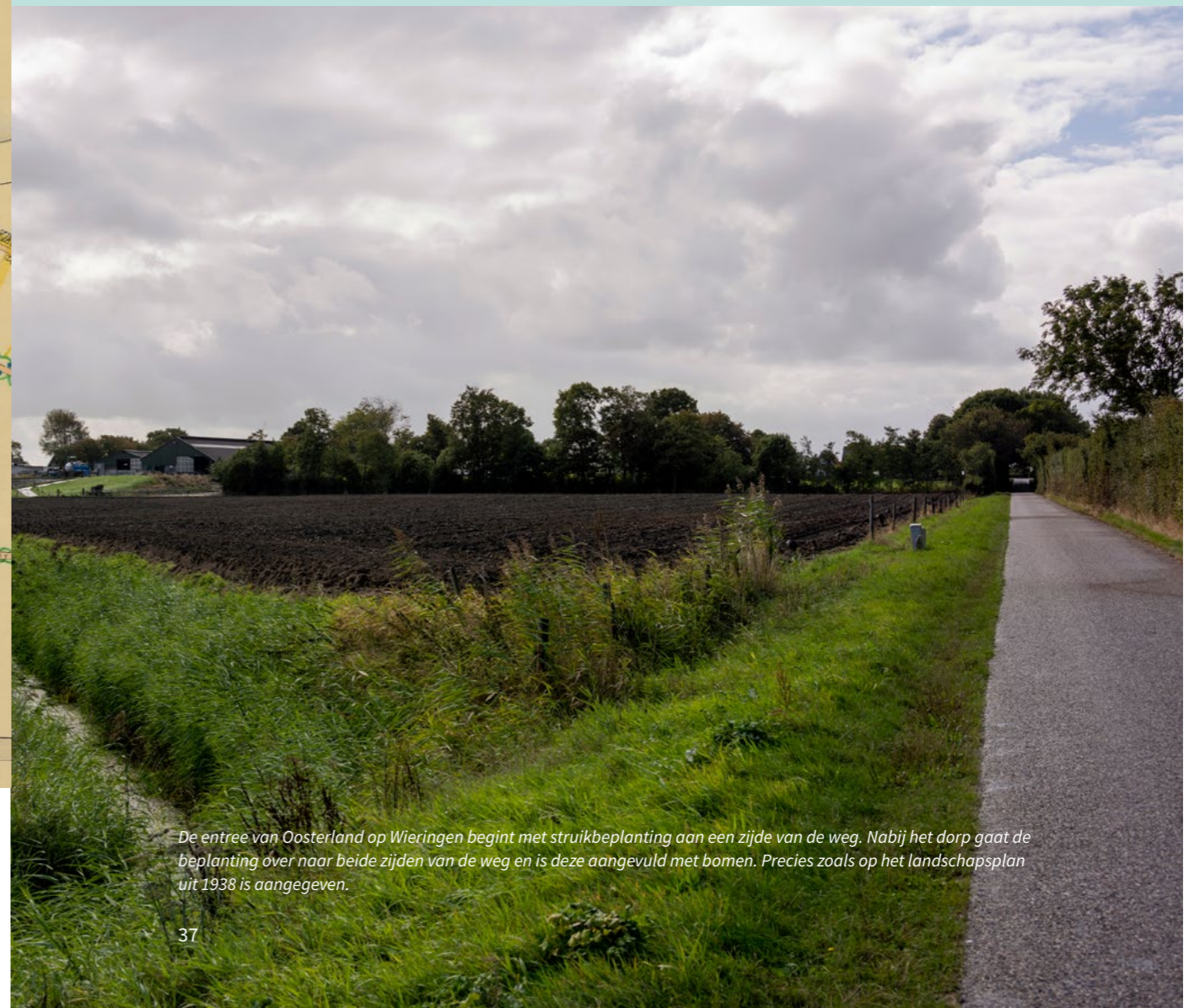
De entree van Oosterland op Wieringen begint met struikbeplanting aan een zijde van de weg. Nabij het dorp gaat de beplanting over naar beide zijden van de weg en is deze aangevuld met bomen. Precies zoals op het landschapsplan uit 1938 is aangegeven.