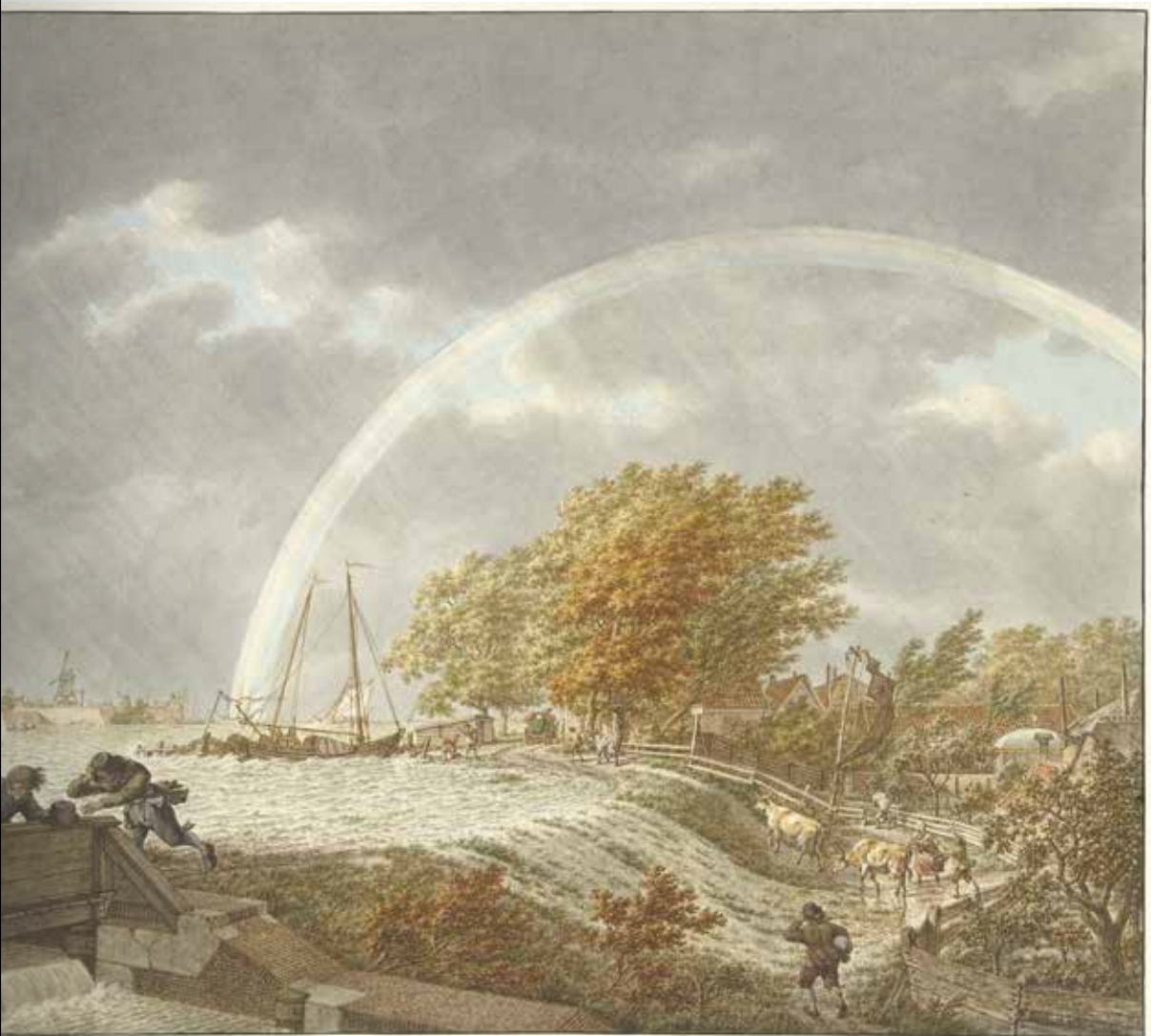
Schilderij 'Herfst, avond en water' van Jacob Cats uit 1797, dat het overstromen van de dijk verbeeldt als standaardgebeurtenis in dit seizoen.