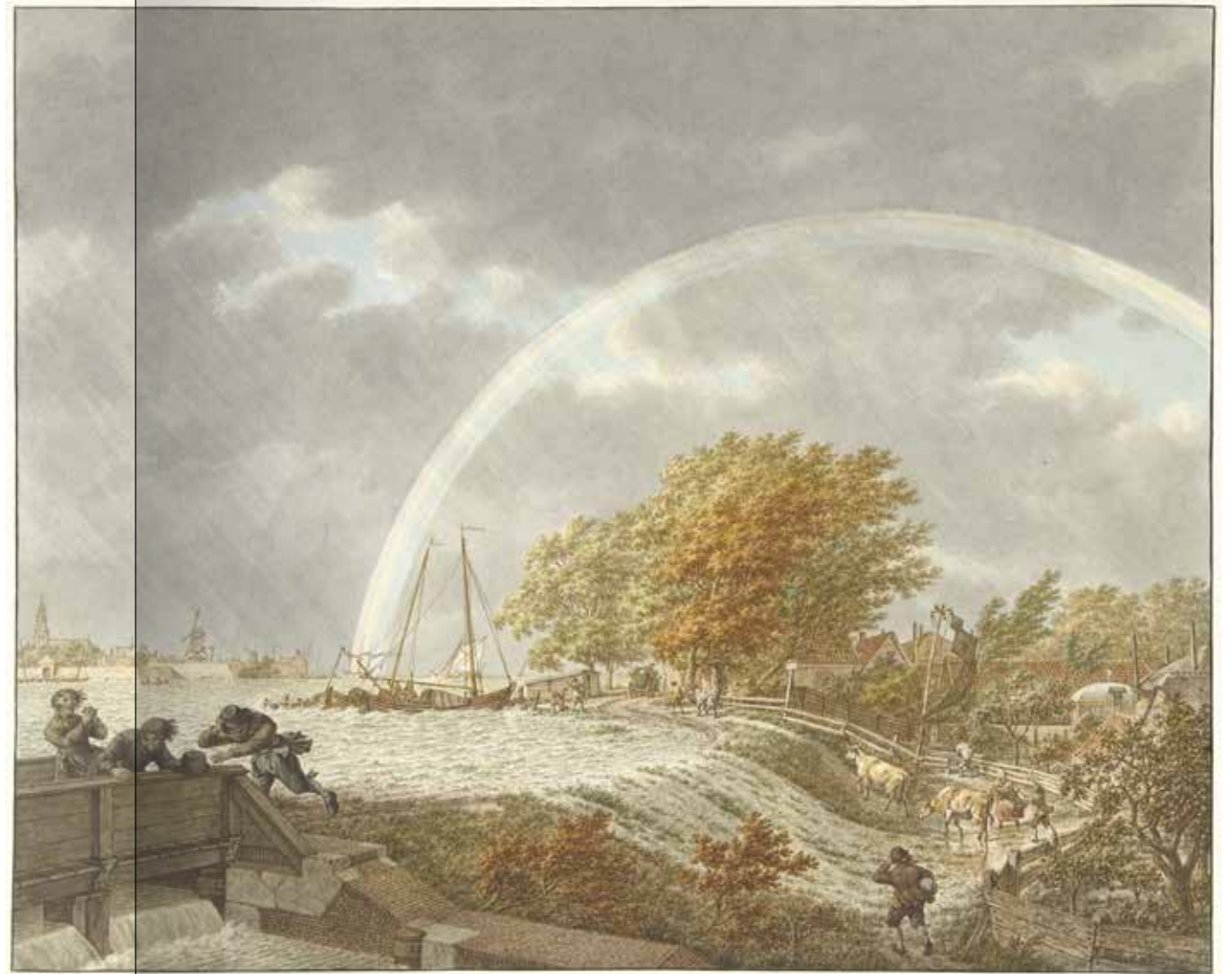
Schilderij 'Herfst, avond en water' van Jacob Cats uit 1797, dat het overstromen van de dijk verbeeldt als standaardgebeurtenis in dit seizoen.