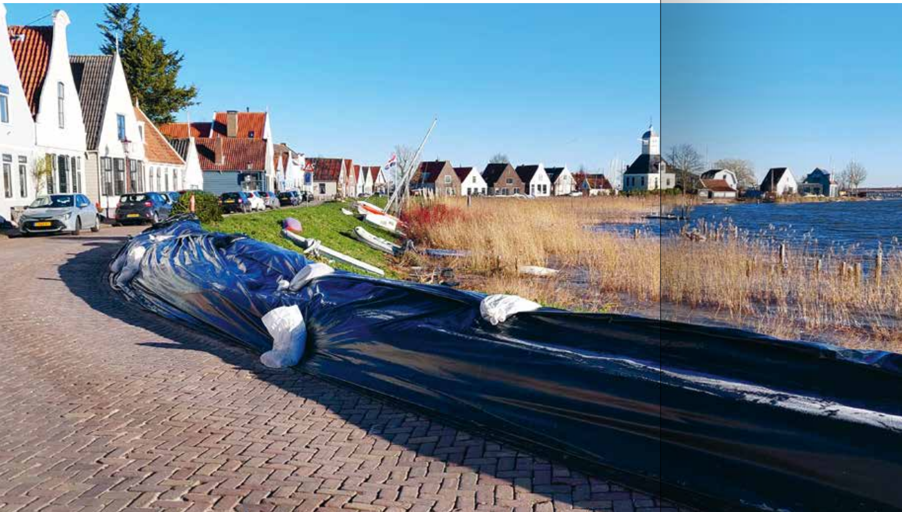
In Durgerdam werd in januari 2024 de dijk in het beschermde dorpsgezicht verstevigd om het dorp en de inwoners te beschermen tegen het hoge water.

Grote delen van Noord-Holland hebben nog een herkenbaar historisch verkavelingspatroon