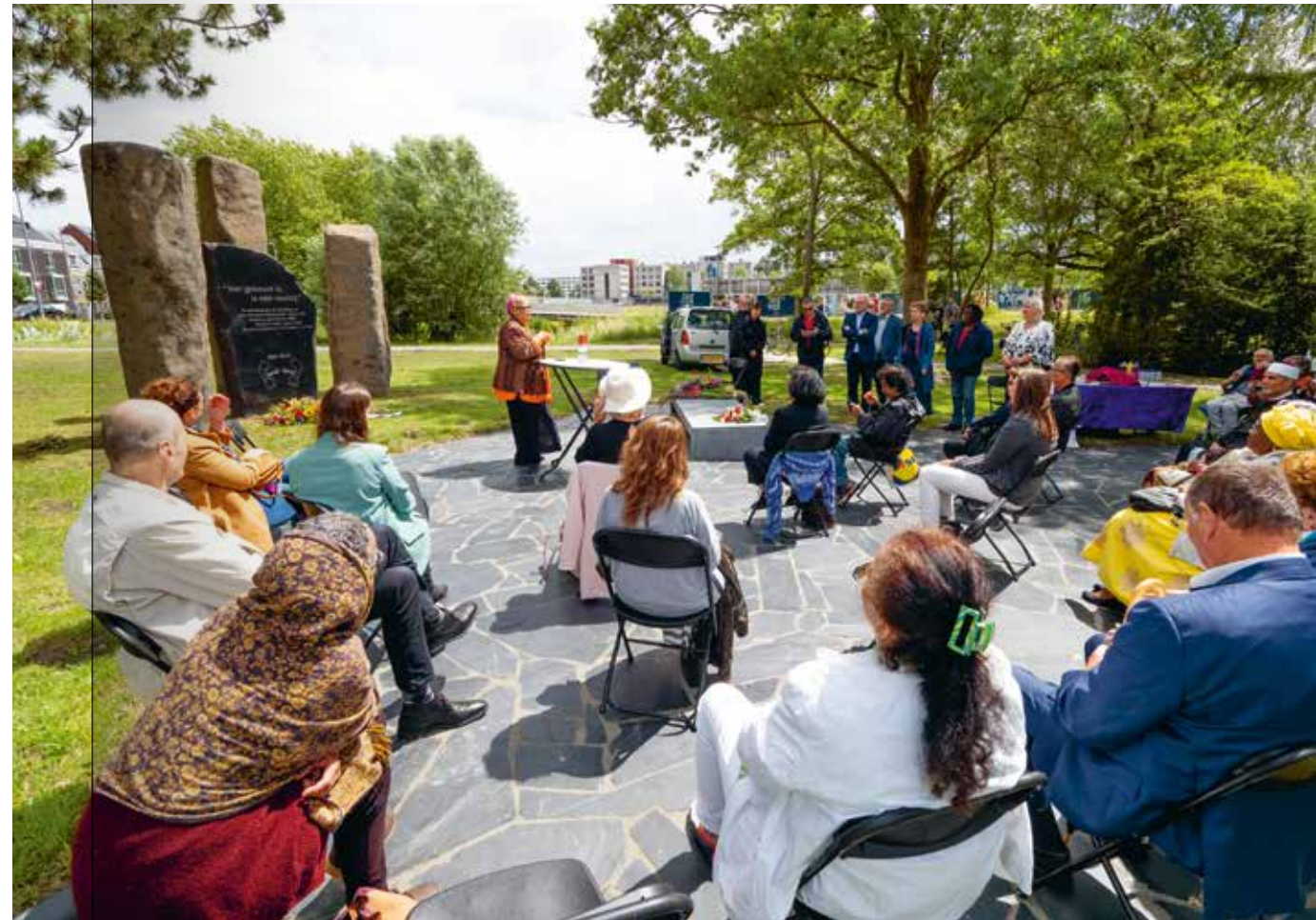
Jaarlijks wordt een Keti Koti-herdenking georganiseerd bij het Slavernij Monument in Hoofddorp. Het monument werd in 2018 geplaatst op initiatief van inwoners van de gemeente Haarlemmermeer.

De afgelopen jaren is er veel te doen geweest om sommige standbeelden in de openbare ruimte, mede onder invloed van de Black Lives Matter-beweging. De helden van vroeger komen in een ander daglicht te staan. De Koninklijke Nederlandse Akademie van Wetenschappen (KNAW) adviseert gemeenten in haar recente rapport 'Wankele sokkels' om meer zicht te krijgen op de standbeelden in de openbare ruimte en de historische kennis