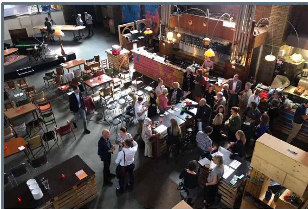
Netwerken na afloop van het plenaire gedeelte van de Dag van de Herbestemming

De Dag van de Herbestemming had dit jaar als thema 'Erfgoed in de participatiemaatschappij. Het organiseren van maatschappelijke betrokkenheid'. In de Sint-Annakerk in Amstelveen – voorlopig herbestemd als evenementenlocatie en brouwerij – gingen wethouders, ambtenaren, historische verenigingen, betrokken burgers en ondernemers met elkaar in gesprek over participatie, die binnen de Omgevingswet een permanent onderdeel van de beleids- en besluitvorming dient te worden, ook als het gaat om erfgoed. Na een welkom van gedeputeerde Jack van der Hoek ging de dagvoorzitter tijdens een panelgesprek in gesprek met wethouders van Ouder-Amstel en Amstelveen en mensen uit het erfgoedveld, zoals de Loods Herbestemming Monumenten en cultureel ondernemer Ellen Klaus. Verdere verdieping werd gezocht tijdens deelsessies met een centrale rol voor medewerkers van de gemeenten Zaanstad, Alkmaar en Bloemendaal.