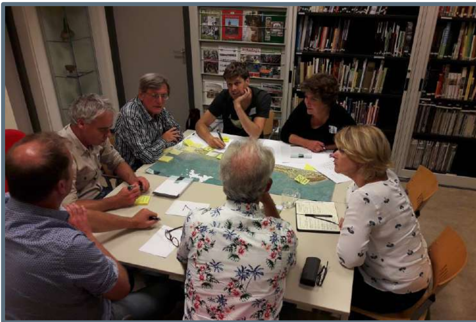
Een Ronde Tafelgesprek

In 2018 is door het Steunpunt één gezamenlijke bijeenkomst georganiseerd voor de twee provinciale gebieden Noordelijk- en Zuidelijk Duingebied. De duingebieden vormen landschappelijk en historisch gezien samen één groot complex binnen Noord-Holland waarbij het Noordzeekanaal als grens in feite een recente doorsnijding vormt.