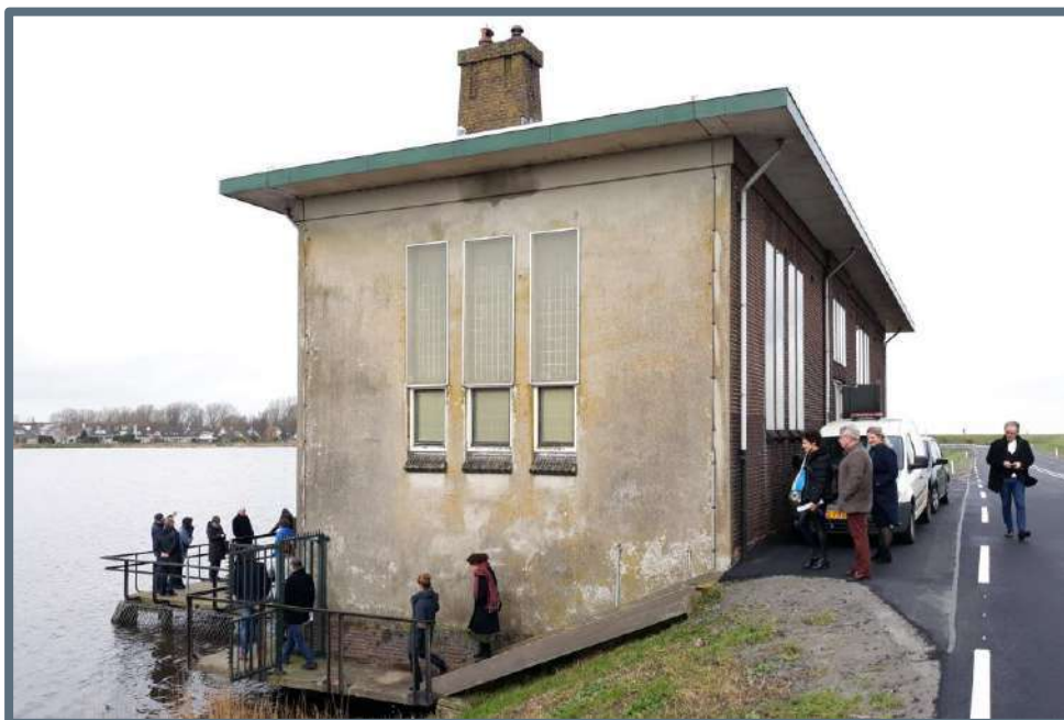
De bezichtiging van het gemaal De Poel