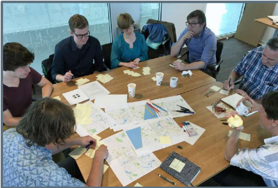
Workshop Erfgoed in de omgevingsvisie Haarlem

Diverse gemeenten kwamen bij het Steunpunt met de vraag: kunnen we een 'boodschappenlijstje' maken met de concrete stappen die we moeten gaan ondernemen om erfgoed op tijd te kunnen integreren in de omgevingsvisie? Met externe experts hebben we voor de gemeenten op maat gemaakte interactieve bijeenkomsten georganiseerd.