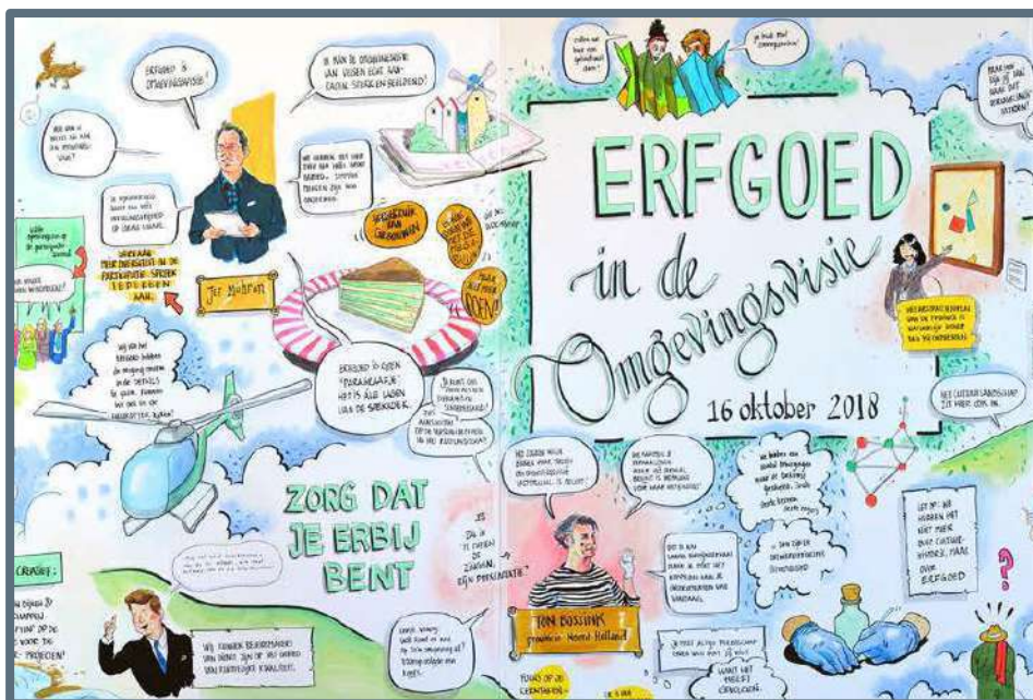
Getekend verslag van de expertmeeting Erfgoed in de Omgevingswet

Wat afgelopen jaar opviel is dat het voor veel gemeenten nog onduidelijk is wat de omgevingsvisie precies gaat betekenen en dat veel gemeenten nog maar net zijn begonnen met het opstellen van de omgevingsvisie. De vragen buitelen over elkaar heen. Wat betekent integraal werken? En hoe wordt dat concreet geregeld? Wat betekent participatie en hoe gaan we belanghebbenden actief betrekken? Wat betekenen open regels en hoe ga je met betrokkenen tijdig in gesprek? Hoe gaan de nieuwe regels er dan uit zien? En hoe kan erfgoed dan beschermd worden? Wat gaan we vastleggen? Hoe koppel je kernkwaliteiten aan de omgevingsvisie en aan regels? Het benoemen van kernkwaliteiten was over het algemeen gemakkelijk, maar het vertalen van de kwaliteiten naar de omgevingsvisie of het -plan was nog onduidelijk. Al met al lijkt er behoefte te zijn aan concrete uitwerkingen en voorbeelden. Daarmee kunnen we volgend jaar aan de slag.