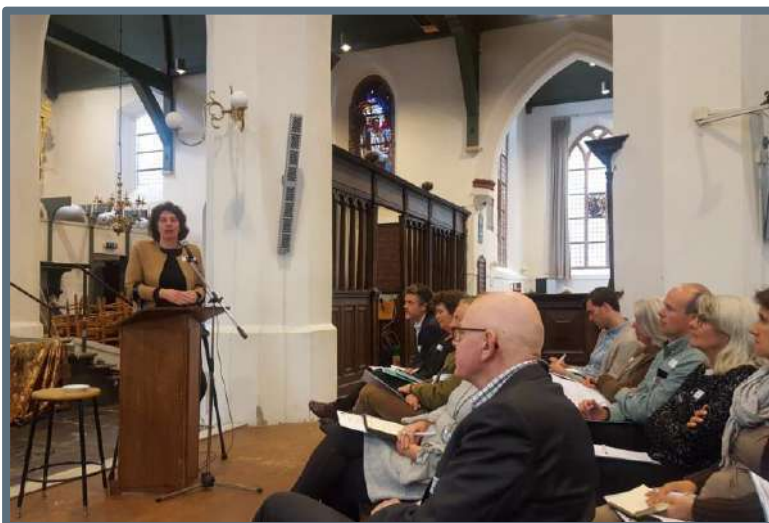
A&O Dag in de Grote Kerk in Beverwijk

Na de actualiteiten van de RCE, het Restauratiefonds en provincie Noord-Holland was er aandacht voor het verhaal van de Grote Kerk (Vereniging Grote Kerk, gemeente Beverwijk en de voorzitter van de kerkenraad). De RCE gaf een toelichting op de kerkensie en het Bisdop vertelde hoe zij hier mee omgaan. Daarna was er voor de deelnemers de keuze tussen de beklimming van de Wijkertoren of een rondleiding door de kerk. Na de pauze werden voorbeeldprojecten gepresenteerd. De dag werd afgesloten met een kenniscarrousel over religie en archeologie, en roerend religieus erfgoed.