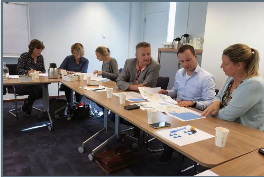
Workshop Erfgoed in de omgevingsvisie voor de IJmond-gemeenten

In 2018 is met 5 gemeenten (Haarlem, Alkmaar, en een gecombineerde workshop voor Heemskerk/Beverwijk/Velsen) gewerkt aan het thema erfgoed in de omgevingsvisie. De workshops vonden plaats bij de gemeenten en er waren steeds tussen de 10 en 15 gemeenteamttenaren aanwezig. Voor de gemeente Alkmaar was een boot gehuurd om langs de casus (Kanaalzone) te kunnen varen. De drie workshops werden begeleid door externe experts. Van iedere bijeenkomst is een verslag gemaakt dat naar de betreffende gemeenten is verstuurd.