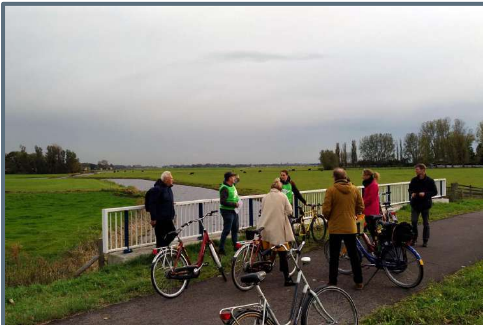
De fietsexcursie tijdens Expeditie Oer-IJ

De Expertmeeting Oer-IJ had als doel om met betrokkenen van gemeenten en organisaties in het gebied te verkennen hoe de kernwaarden en ruimtelijke kwaliteiten van het gebied behouden of versterkt kunnen worden bij de verschillende ruimtelijk opgaven die op het gebied afkomen. De bijeenkomst is georganiseerd in samenwerking met Stichting Oer-IJ die de uitkomsten en ideeën van de bijeenkomst zal gaan gebruiken bij het maken van het Inspiratiebeeld Oer-IJ gebied waar ze aan werken.