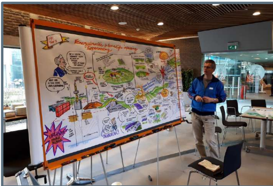
Expeditie Energietransitie in Heerhugowaard

Tijdens de bijeenkomst is vooral veel kennis uitgewisseld en samen nagedacht over de inpassing van aardwarmteprojecten en zonneweides. Het inpassen van aardwarmteprojecten blijkt vooral om de inpassing van het ondergrondse transportnetwerk te gaan en is daarmee met name een archeologisch vraagstuk. De inpassing van zonneweides is meer een ontwerp-vraagstuk waarin het proces een belangrijke rol heeft. Met wie? Hoe? Voor hoe lang? Wat is het instrumentarium? Deze vragen werden (ontwerpend) onderzocht.