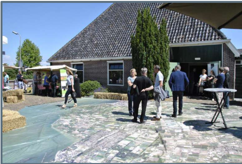
De Grote Stolpendag

Het Steunpunt Monumenten & Archeologie Noord-Holland had met de Grote Stolpendag in Venhuizen het doel om het behoud van de stolp weer bovenaan alle agenda's van gemeenten, provincie, maatschappelijke organisaties, financiers en andere betrokkenen te krijgen. Medewerkers van een aantal grote stolpengemeenten gingen in de ochtend aan de slag met de kersverse handreiking voor gemeentelijk stolpenbeleid, getiteld Vierkant achter de stolp 2.0 , die het Steunpunt in 2017 had opgesteld.