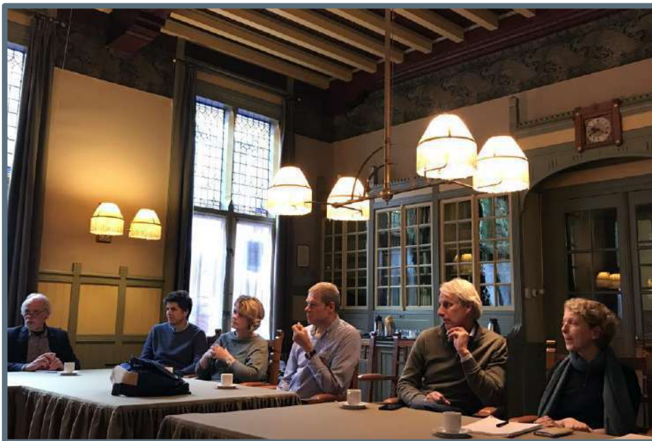
In de monumentale Heerenkamer van de Verenigde Doopsgezinde Gemeente te Haarlem

Het Erfgoedteam, dat voor het tweede jaar op rij werd georganiseerd, is er in 2018 in geslaagd ambtenaren (gemeenten, provincie en rijk), erfgoedadviseurs en betrokken van externe organisaties bij elkaar te brengen op interessante locaties verspreid over de provincie. Het aanbod was divers en actueel. Het jaar werd afgetrapt met een drieluik over religieus erfgoed waarbij zowel het boven- als het ondergrondse erfgoed werd belicht.