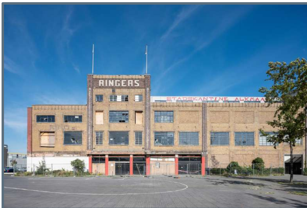
De Ringersfabriek in Alkmaar

Tekstschrijvers Isabel van Lent en Sophie van Ginneken hebben hiervoor de belangrijkste betrokkenen geïnterviewd, waarbij de nadruk lag op het proces van de herbesteding en de lessons learned . Voor de cultuurhistorische achtergronden is er samengewerkt met Oneindig Noord-Holland; de websites van Oneindig Noord-Holland en het Steunpunt verwijzen naar elkaar. Architectuurfotograaf Ossip van Duivenbode was verantwoordelijk voor de fotografie.