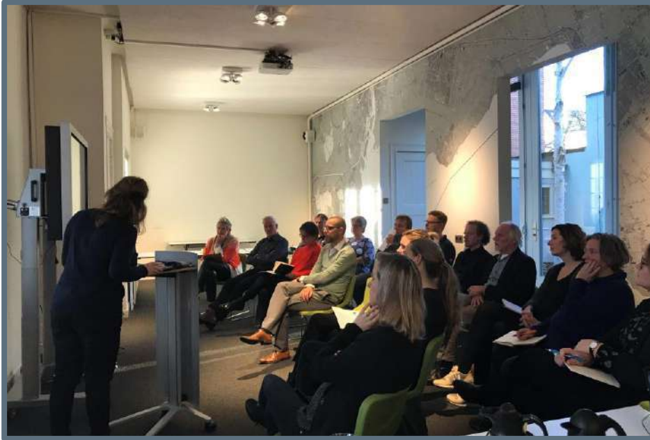
Erfgoedteam: collectieve verduurzamingsoplossingen