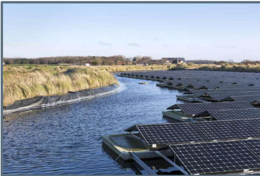
Landschappelijke inpassing van een zonneweide op Texel

In navolging van de voorbeeldprojecten herbestemming zijn er in 2018 ook drie voorbeeldprojecten energietransitie toegevoegd aan de voorbeeldenbank op de website van het Steunpunt. Het doel van de voorbeeldenbank is om medewerkers van Noord-Hollandse gemeenten te ondersteunen bij het beantwoorden van vragen van initiatiefnemers over herbestemming of het inpassen van zonneweides,