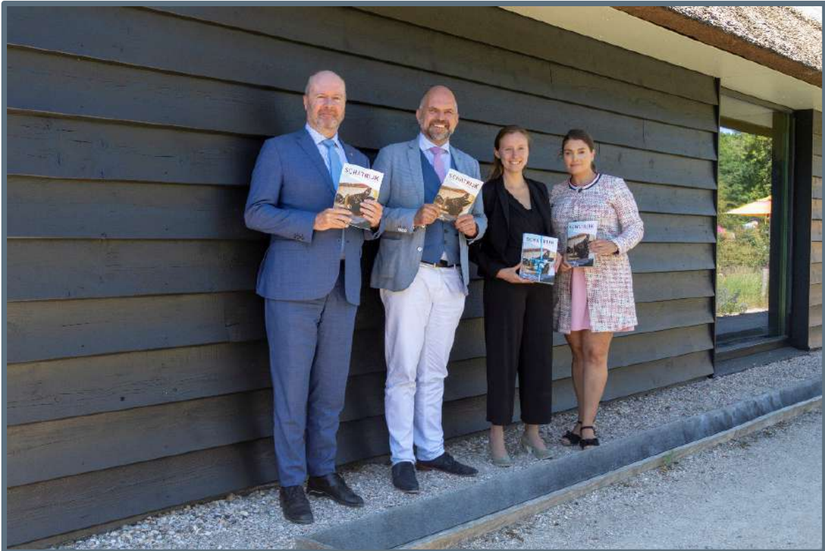
Presentatie SCHATRIJK – 3 juli 2019.

Wethouder Verwoort van gemeente Velsen, wethouder Wijkhuizen van gemeente Bloemendaal en wethouder Verheij-de Haas van gemeente Zandvoort dankten de gedeputeerde en zeiden het belangrijk te vinden het verhaal van het verleden te vertellen en te benutten in de toekomstige ontwikkelingen binnen hun gemeenten.