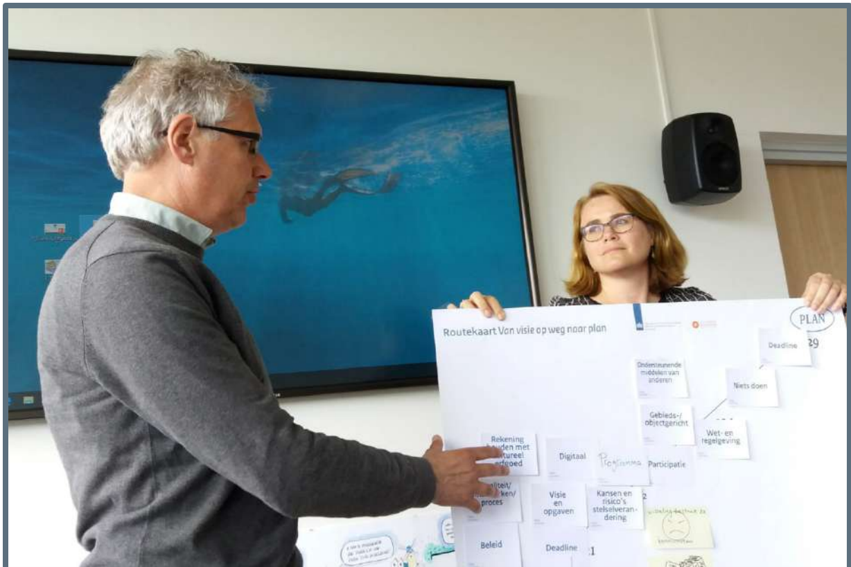
Cursus Erfgoed in de Omgevingswet – 14 mei 2019 (foto: Steunpunt Monumenten & Archeologie Noord-Holland).