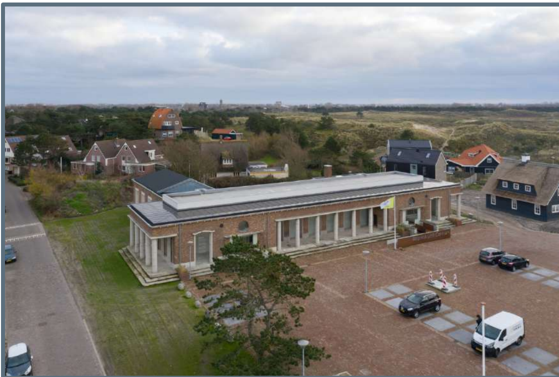
Logementsgebouw, Huisduinen.

Voor de cultuurhistorische achtergronden is het Steunpunt ook dit jaar de samenwerking aangegaan met Oneindig Noord-Holland. De websites van Oneindig Noord-Holland en het Steunpunt verwijzen daarbij ook naar elkaar. De overige tekst is geschreven door onze tekstschrijvers Sophie van Ginneken en Primo Reh, op basis van interviews met de belangrijkste betrokkenen. Architectuurfotograaf Ossip van Duivenbode maakte voor elk project de foto's, van zowel het exterieur, als interieur.