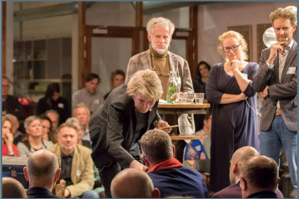
Het Noord-Hollands Erfgoeddebat – 7 maart 2019.

gedeputeerde Jack van der Hoek opende – waren meerdere wethouders, gemeenteraadsleden en provinciale statenleden aanwezig. Ook was er pers aanwezig.