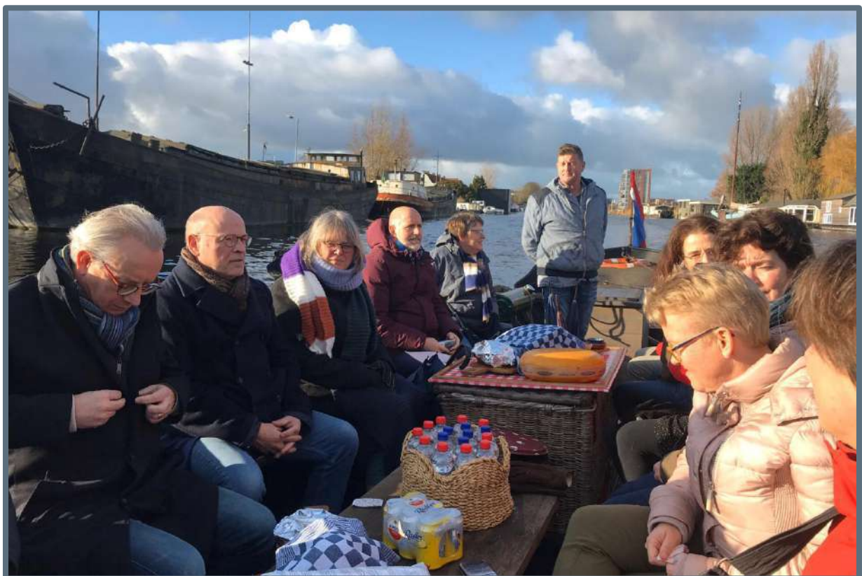
Landelijk overleg en excursie provinciale steunpunten (EOS) – 2 december 2019 (foto: Steunpunt Monumenten & Archeologie Noord-Holland).

Het Steunpunt heeft het afgelopen jaar extra ingezet op een integrale benadering van de onderwerpen, en ook het werkveld geattendeerd op de meerwaarde die een integrale benadering van de gestelde opgaven met zich mee kan brengen. Onze adviseurs zijn alert op de kansen en mogelijkheden die crossovers kunnen bieden. Zo zijn actuele thema's als duurzaamheid, klimaatadaptatie, agrarisch en religieus erfgoed, Omgevingswet, Atlantikwall en de Hollandse Waterlinie in de volle breedte gepresenteerd waarbij aandacht is gevraagd voor de samenhang tussen de thema's waar het Steunpunt zich mee bezig houdt: archeologie, gebouwd erfgoed en landschap).