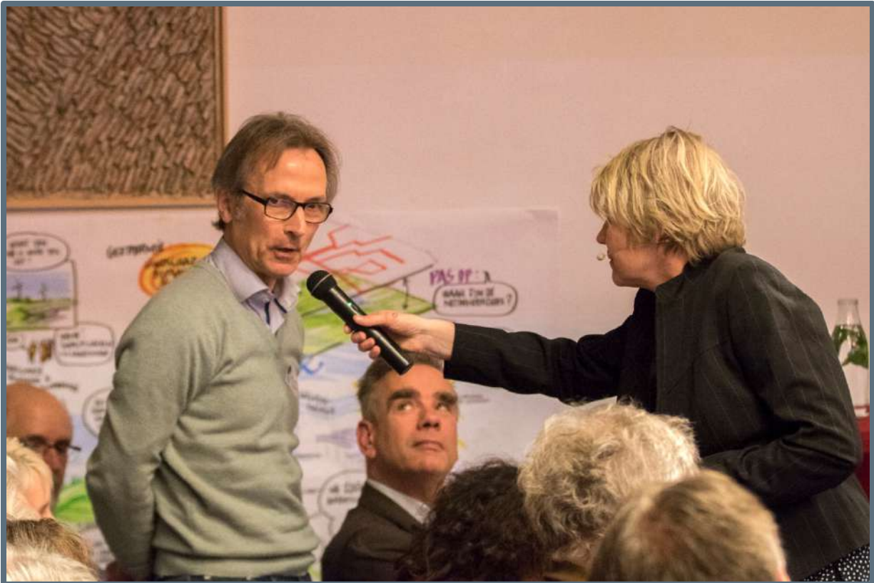
Het Noord-Hollands Erfgoeddebat – 7 maart 2019 (foto: André Russcher).