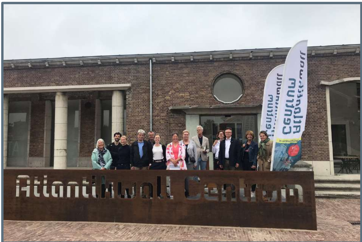
Zomerexcursie Erfgoedteam – 27 juni 2019 (foto: Steunpunt Monumenten & Archeologie Noord-Holland).