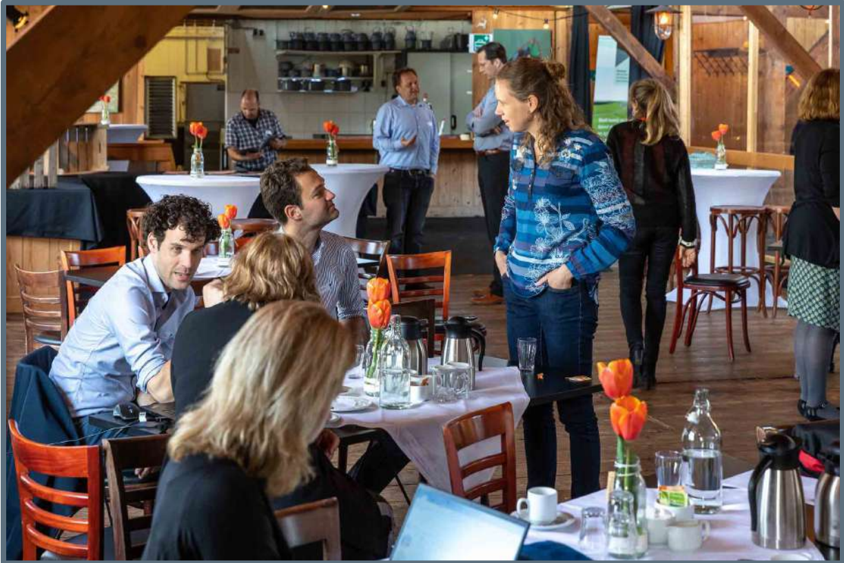
Netwerkbijeenkomst Broek op Langedijk – 16 april 2019.

Veilingmuseum Broek op Langedijk, dinsdag 16 april. Met medewerking van de gemeente Langedijk.