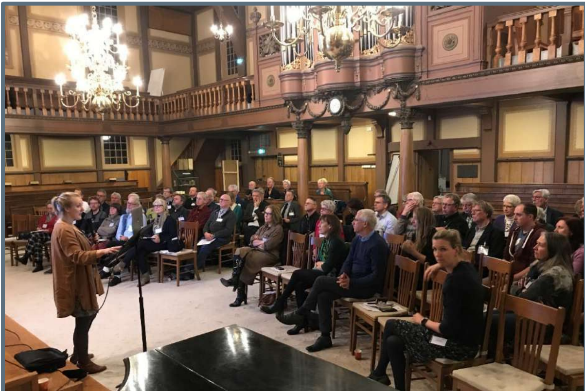
Kerkenvisie Zaanstreek startbijeenkomst – 13 maart 2019.