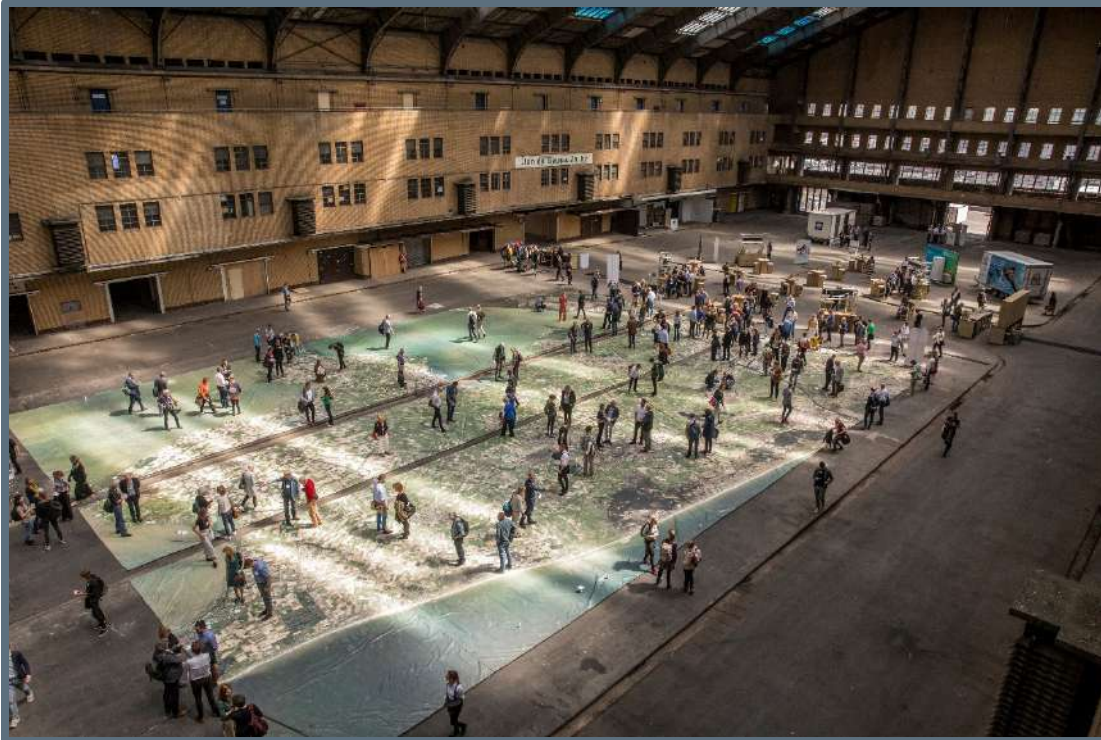
Duurzaam Erfgoed Congres – 6 juni 2019.