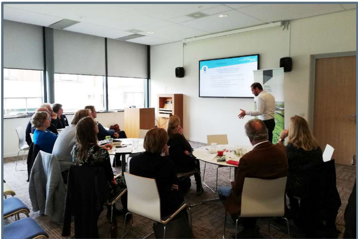
Bijeenkomst Community Archaeology – 5 november 2019.