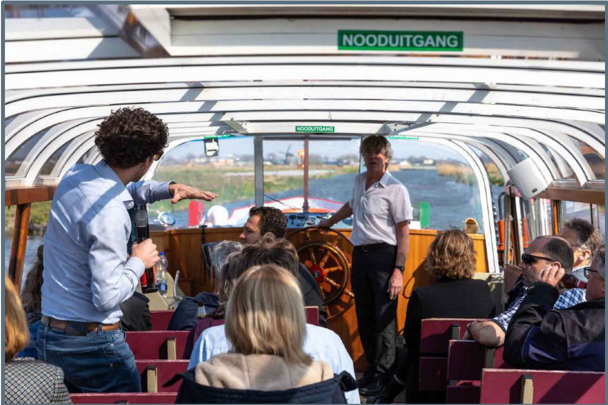
Netwerkbijeenkomst Broek op Langedijk – 16 april 2019.