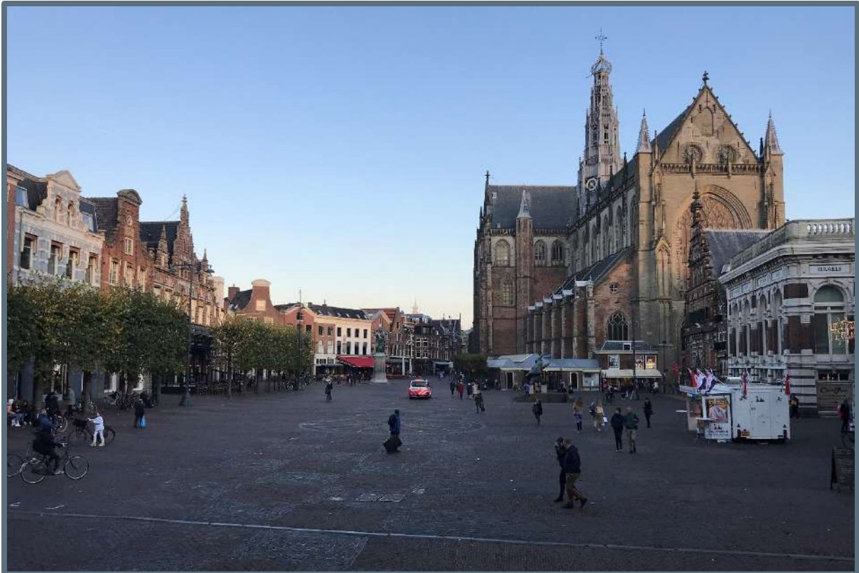
Erfgoedteam: de toekomst van de historische openbare ruimte – 30 oktober 2019.

Het onderwerp was informatief voor andere gemeenten die een dergelijk onderzoek overwegen maar bood ook de mogelijkheid om te brainstormen over de volgende stap die de gemeente gaat maken: er ligt een rapport. Hoe nu verder?