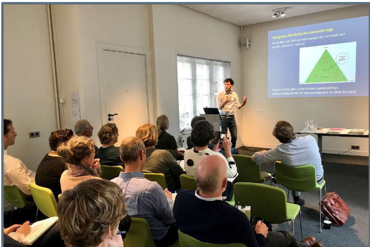
Informatiebijeenkomst Gebiedsbiografie en de Omgevingsvisie – 15 oktober 2019 (foto: Steunpunt Monumenten & Archeologie Noord-Holland).

In de omgevingsvisie benoemen gemeenten hun eigen ruimtelijke kernkwaliteiten. Hierover is in de samenleving veel kennis aanwezig en betrokken burgers willen hun kennis ook graag delen. De gebiedsbiografie is een instrument dat gemeenten daarbij goed kan helpen. Daarom organiseerden wij op dinsdag 15 oktober een middagprogramma over de gebiedsbiografie op het kantoor van MOOI Noord-Holland te Alkmaar. De uren die gemoeid waren met de voorbereiding en deelname door medewerkers van het Steunpunt zijn deels gemaakt als onderdeel van het programma Erfgoed in de Omgevingswet, aangezien het onderwerp overlappend is voor de beide thema's.