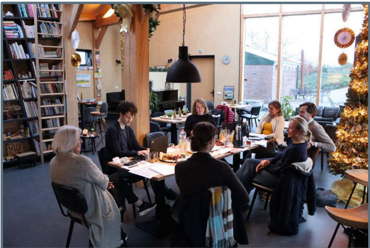
Steunpunt teamoverleg in de Twuyvermolen – 10 december 2019.