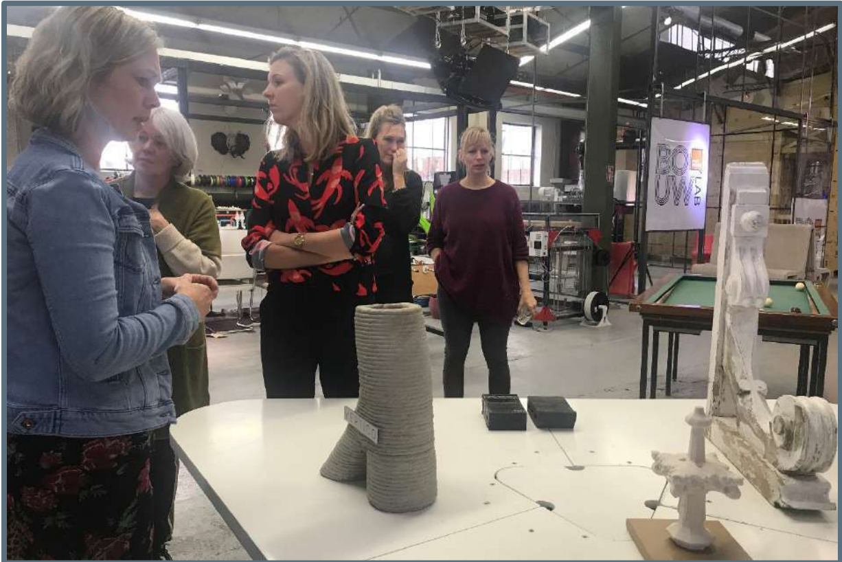
Erfgoedteam: Innovatie bij restauratieprojecten – 28 november 2019.