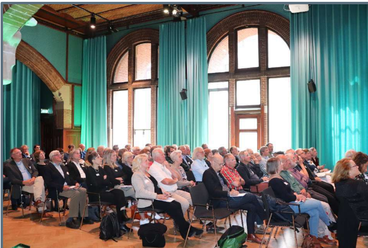
Bijeenkomst Erfgoed in de Omgevingswet voor historische verenigingen – 27 mei 2019 (foto: Steunpunt Monumenten & Archeologie Noord-Holland).

Projectverantwoordelijk: Kim Zweerink, MOOI Noord-Holland