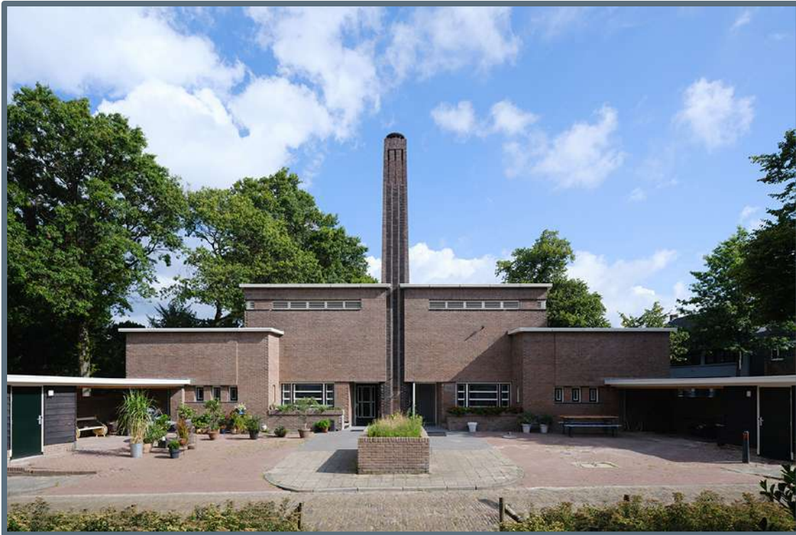
Badhuis Dudok, Hilversum.

Voor de cultuurhistorische achtergronden is het Steunpunt ook dit jaar de samenwerking aangegaan met Oneindig Noord-Holland. De websites van Oneindig Noord-Holland en het Steunpunt verwijzen daarbij ook naar elkaar. De overige tekst is geschreven door onze tekstschrijvers Sophie van Ginneken en Primo Reh, op basis van interviews met de belangrijkste betrokkenen. Architectuurfotograaf Ossip van Duivenbode maakte voor elk project de foto's, van zowel het exterieur, als interieur.