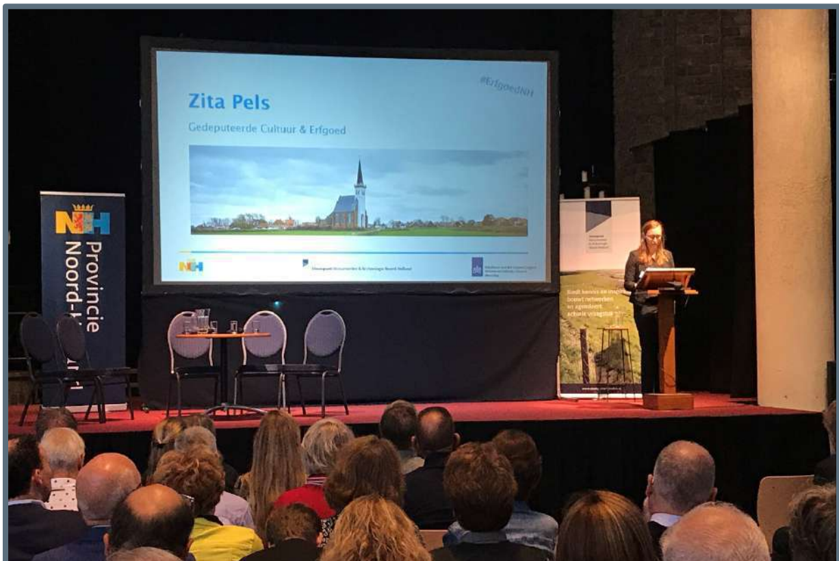
Toekomst Religieus Erfgoed symposium – 12 september 2019 (foto: Steunpunt Monumenten & Archeologie Noord-Holland).

In 2019 zijn in verschillende provincies voorlichtingsbijeenkomsten gehouden, waarbij geïnteresseerde gemeenten, kerkgenootschappen, erfgoedorganisaties en burgers informatie kregen over de mogelijkheid om een integrale lokale kerkenvisie op te stellen. In Noord-Holland was deze bijeenkomst onderdeel van het Toekomst Religieus Erfgoed Symposium, dat op 12 september in de herbestemde Cultuurkoepel Heiloo plaatsvond. Het symposium werd vanuit provincie Noord-Holland georganiseerd, samen met de Rijksdienst voor het Cultureel Erfgoed en het Steunpunt Monumenten & Archeologie Noord-Holland.