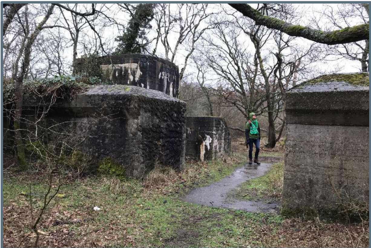
Excursie naar de Atlantikwall – 13 maart 2019 (foto: Steunpunt Monumenten & Archeologie Noord-Holland).