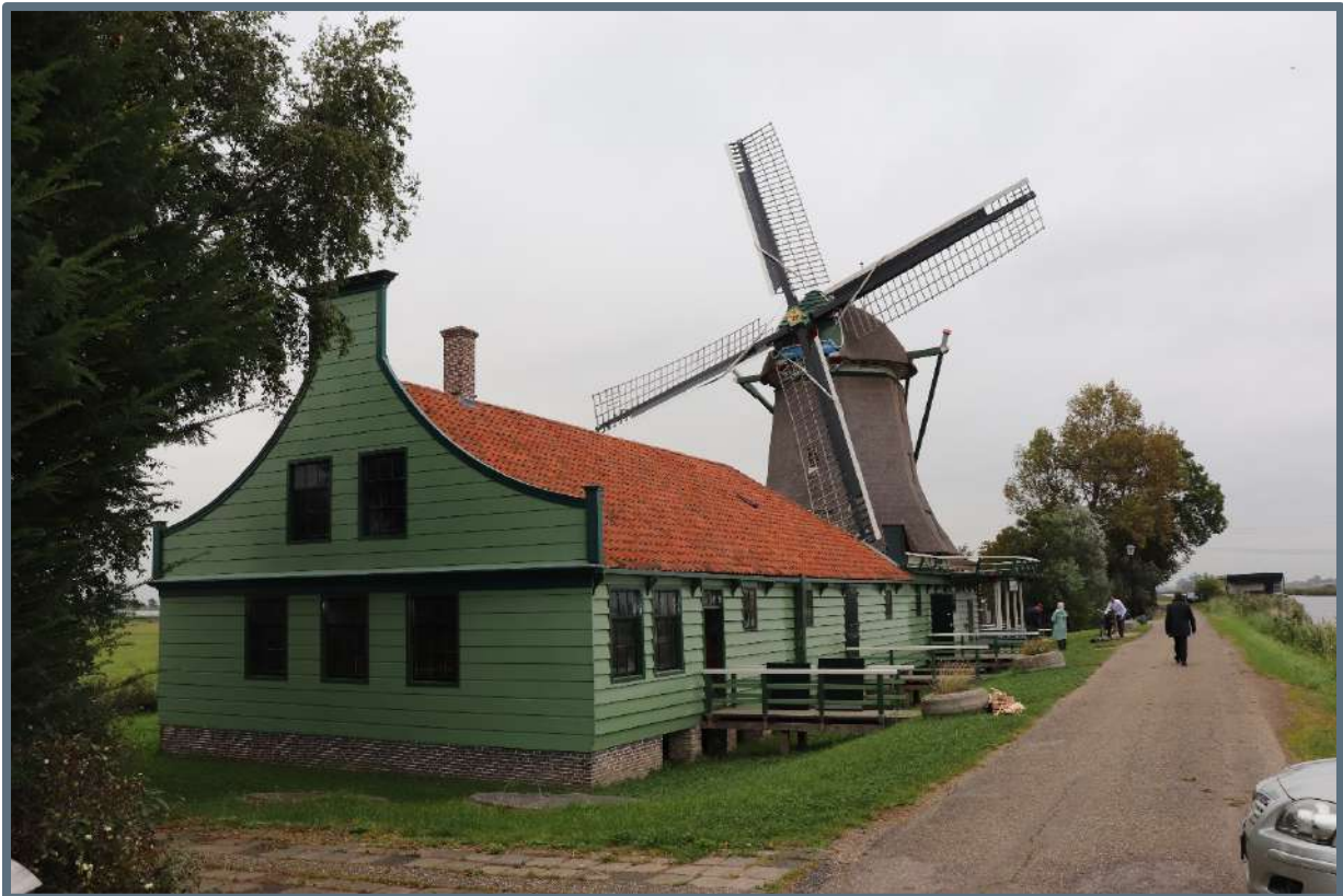
Erfgoedteam Houtconstructies – 4 september 2019 (foto: Steunpunt Monumenten & Archeologie Noord-Holland).

Doel van de excursie was om van mensen uit de praktijk (aannemers, restaurateurs) te horen hoe complex restauratie van houtbouw kan zijn. Uitgebreid verslag gemaakt waarin de dilemma's worden geschetst opdat gemeenten er van kunnen leren.