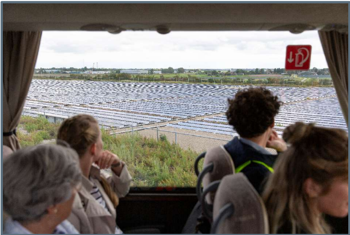
Excursie Zonnevelden – 3 september 2019.

Doel: Het informeren van ambtenaren op het gebied van zonnevelden doormiddel van een tour langs een viertal zonnevelden.