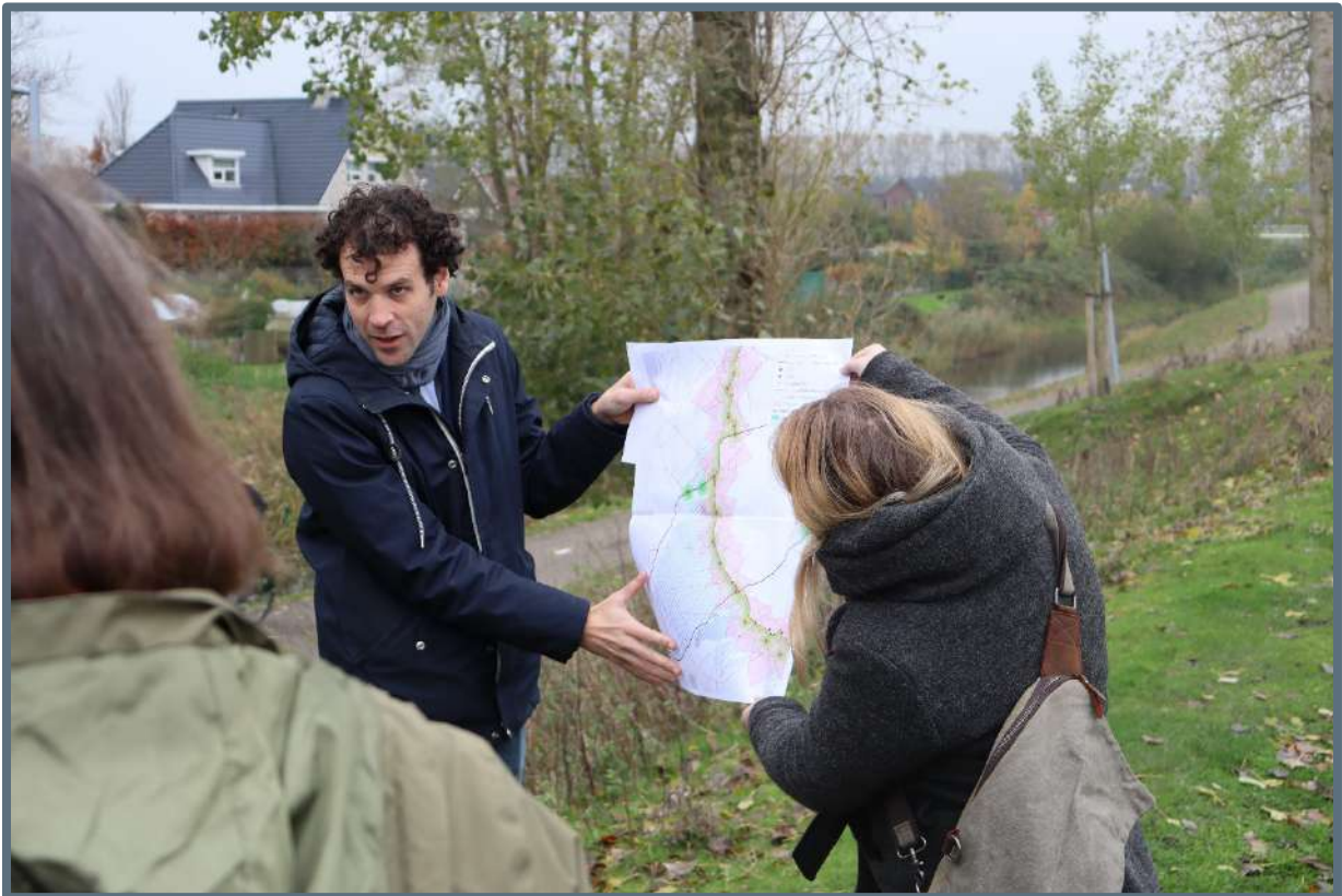
Symposium Stelling van Amsterdam – 15 november 2019.

werelderfgoed de Stelling van Amsterdam. Daarna was er een excursie over het terrein van Fort Vijfhuizen en vervolgens verschillende deelsessies met discussies op het gebied van landschap, biodiversiteit en herbestemming en de samenwerking tussen de verschillende organisaties op deze thema's.