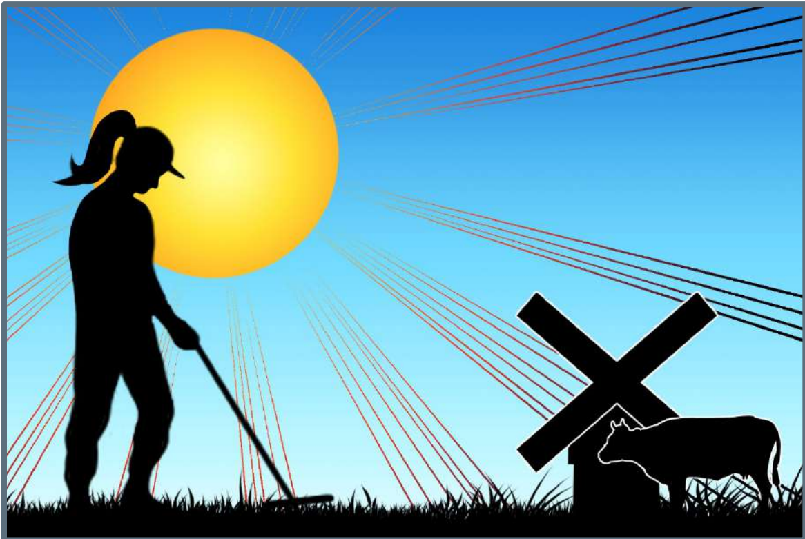
Metaaldetectie en vondstmeldingen.

In Nederland bestaat er een wettelijke verplichting tot het melden van archeologische toevalsvondsten. In de praktijk blijken toevalsvondsten echter niet altijd te worden gemeld. Dit betekent dat gemeenten geen compleet beeld hebben van de archeologische waarden waarvoor zij de wettelijke zorgplicht hebben. Deze kennislacune hindert hen bij het uitvoeren van hun wettelijke taak. De provincie heeft het Steunpunt gevraagd om te inventariseren wat de stand van zaken is met betrekking tot particuliere vondstmeldingen in Noord-Holland, de resultaten zijn na te lezen in het rapport van de uitgevoerde casestudy.