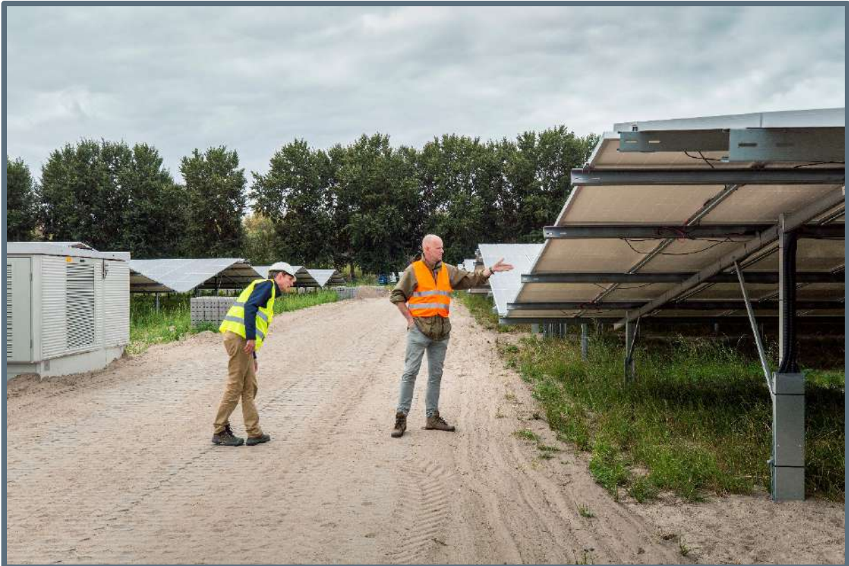
Excursie Zonnevelden – 3 september 2019.

Citaat: Landschappelijke inpassing is zeer belangrijk voor publieke acceptatie van zonneweides Als je geen tijd besteed aan de acceptatie van zonnevelden verlies je tijd en geld. (Lenneke Slooff-Hoek / TNO/ECN)