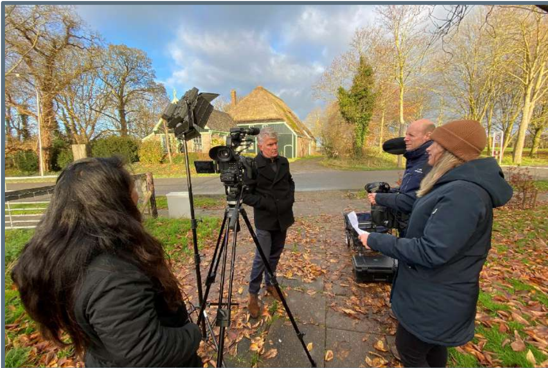
Opnamedag filmpje Stolpenstructuren in gemeentelijk beleid – 2 december 2019 (foto: Steunpunt Monumenten & Archeologie Noord-Holland).

Het filmpje maakt met mooie beelden, animaties en een inspirerende verteller inzichtelijk wat de stolpenstructuren en de kernwaarden van de stolpenstructuren zijn. Ook gaat het filmpje in op wat de provinciale borging van de structuren in de Leidraad betekent voor gemeenten. Het aan het filmpje gekoppelde artikel werkt op heldere wijze uit wat de gemeentelijke verplichtingen zijn op basis van de PRV, hoe de borging in bestemmingsplannen werkt en wat een geschikte denkrichting is om grotere structuren, zoals de stolpenstructuren, te borgen in omgevingsplannen.