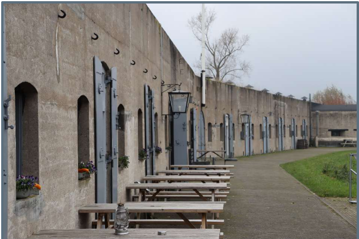
Symposium Stelling van Amsterdam – 15 november 2019.

Doel: Praten met wethouders en beleidsmedewerkers van betrokken gemeenten, waterschappen en grote eigenaren over de toekomstige opgaven in de Stelling van Amsterdam en de Nieuwe Hollandse Waterlinie in Noord-Holland.