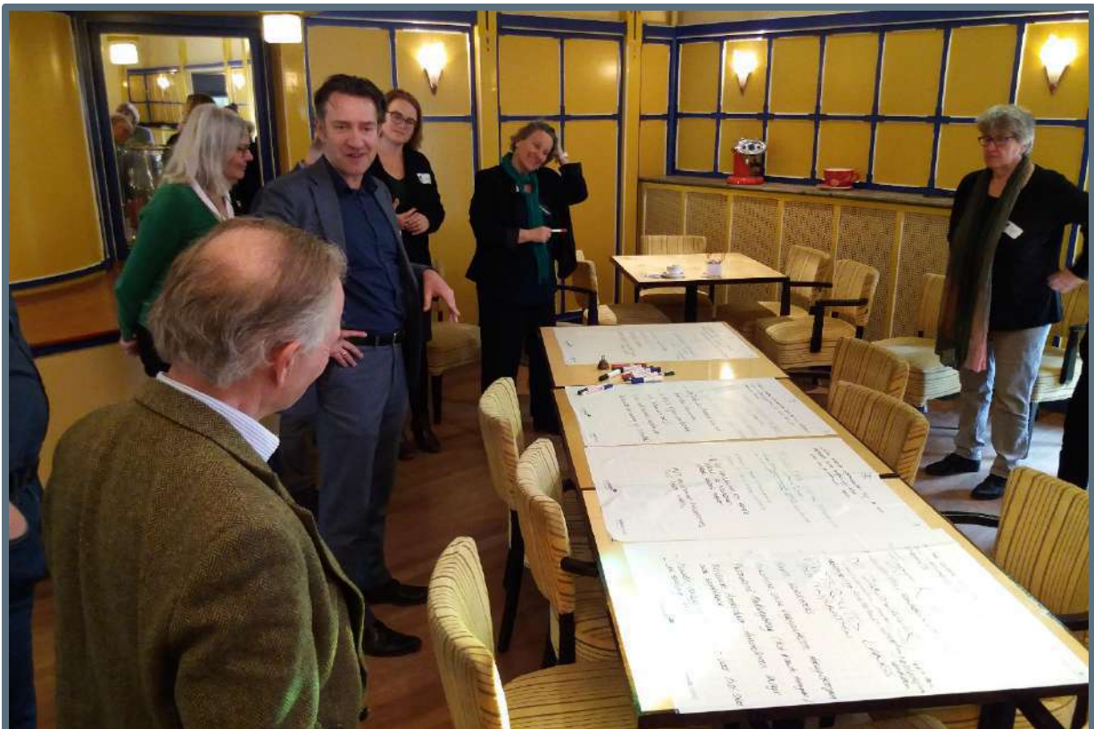
Netwerkbijeenkomst Bloemendaal – 28 februari 2019 (foto: Steunpunt Monumenten & Archeologie Noord-Holland).