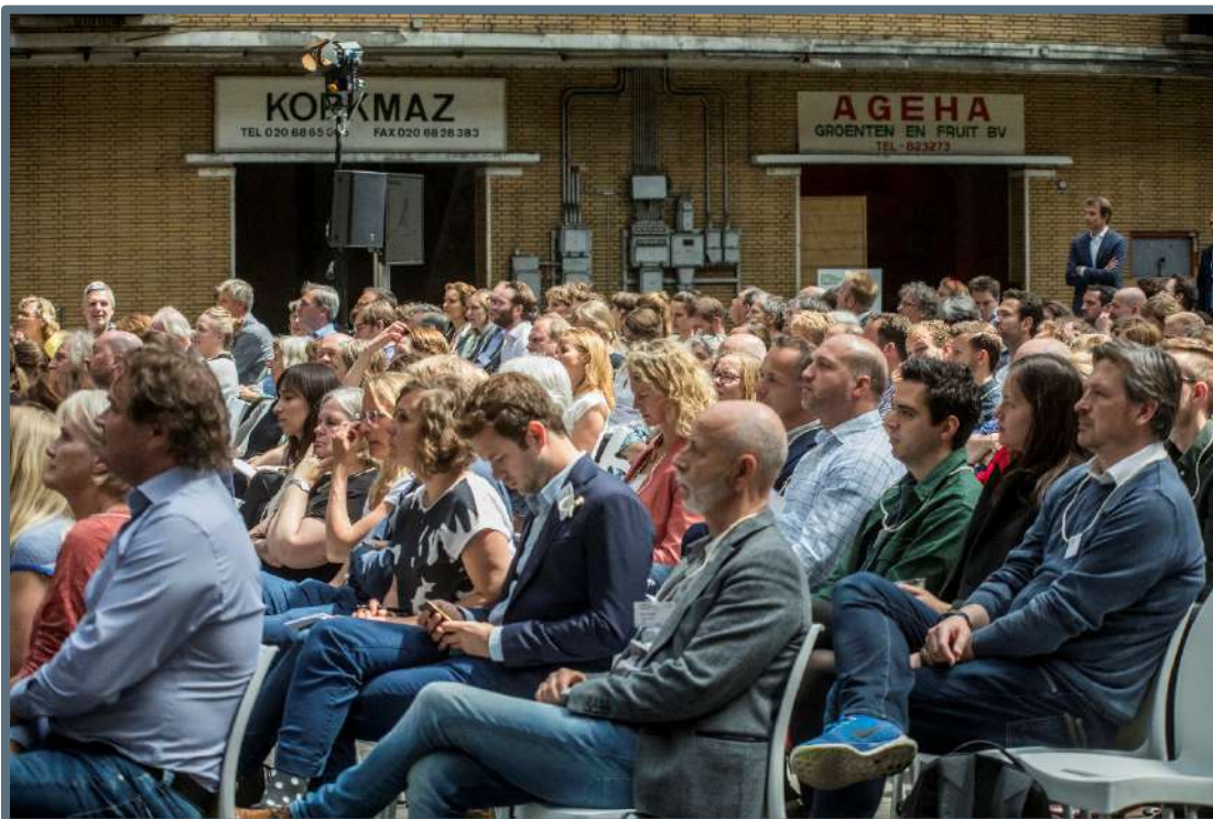
Duurzaam Erfgoed Congres – 6 juni 2019 (foto: eiko.nl).