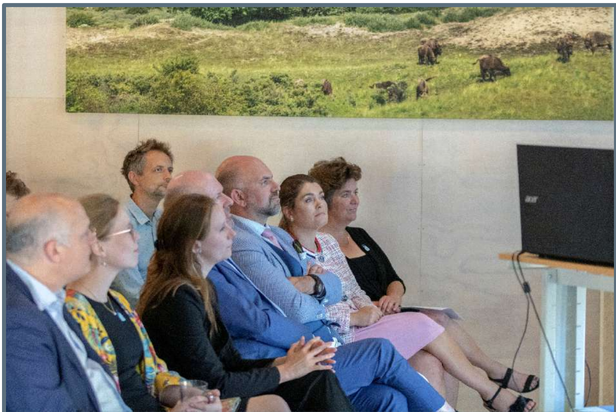
Presentatie magazine SCHATRIJK – 3 juli 2019.

In overleg met Rob van Eerden (PNH) is besloten om een deel van de uren voor 2019 op dit onderdeel van archeologie te besteden aan de invulling van de archeoglossy 2020. In 2020 zullen dan uren naar rato extra worden besteed aan het Platform.