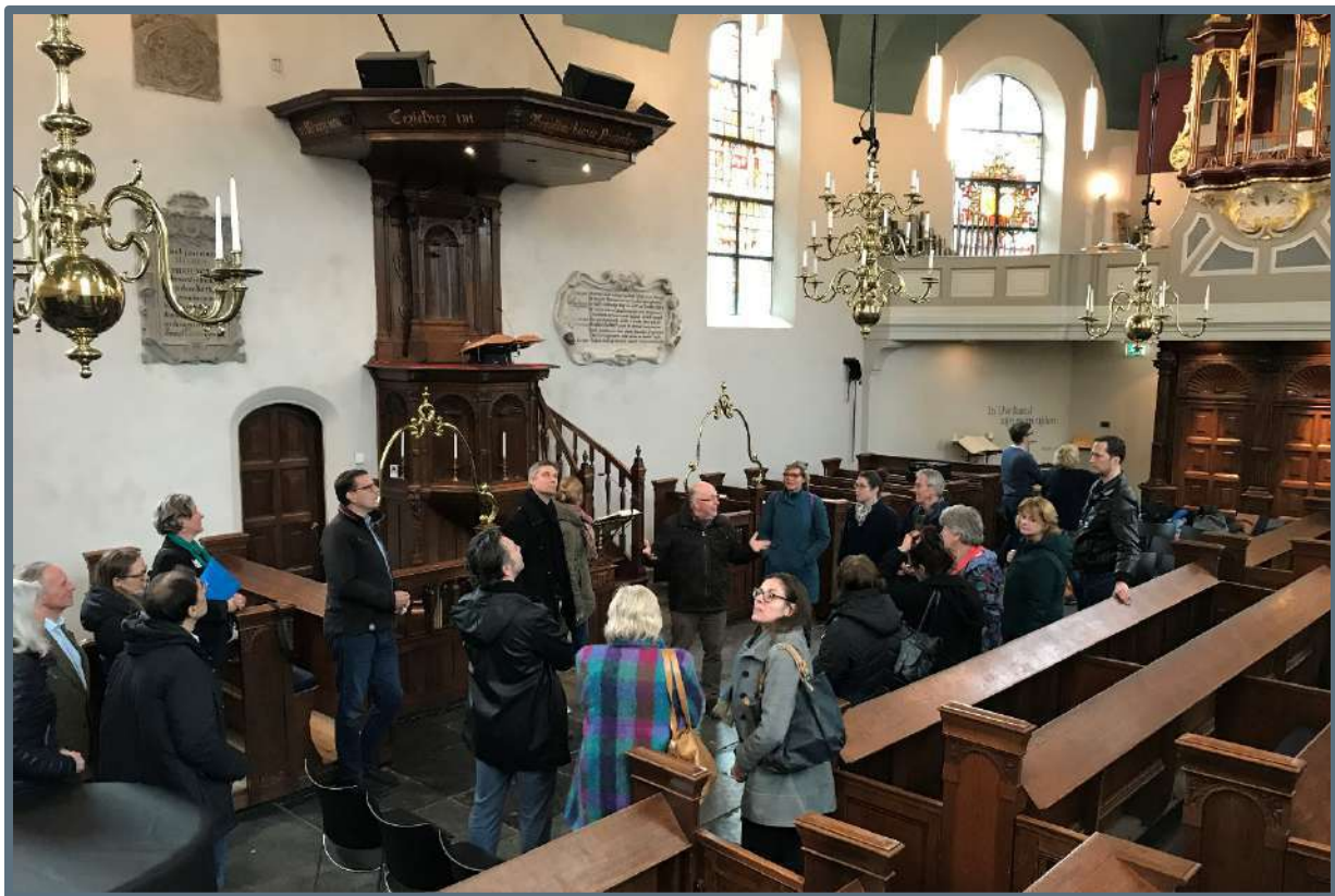
Netwerkbijeenkomst Bloemendaal – 28 februari 2019.

Vanouds Het Dorpshuis, Bloemendaal, 28 februari 2019. Met medewerking van de gemeente Bloemendaal.