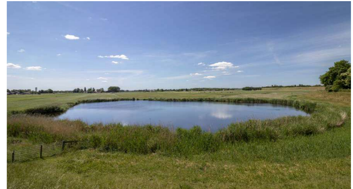
Oude dijkdoorbraak, of wiel bij de Oude Zuiderzeedijk tussen Naarden en Muiderberg.

Het magazine staat ook stil bij het belang van archeologie en de omgang met erfgoed. Het verleden, heden en toekomst zijn met elkaar verweven. “De vroegere bewoners van het Gooi en de Vechtstreek kregen te maken met ontwikkelingen en thema’s waar wij ook mee te maken hebben”, aldus gedeputeerde Zita Pels in het voorwoord. De glossy is verzonden aan de zeven betrokken gemeenten, erfgoedinstellingen, VVV, amateurverenigingen in de regio en Huis van Hilde. Totale oplage is 1000 stuks.