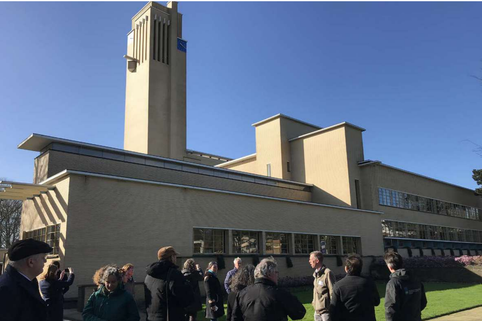
Netwerkbijeenkomst in Hilversum