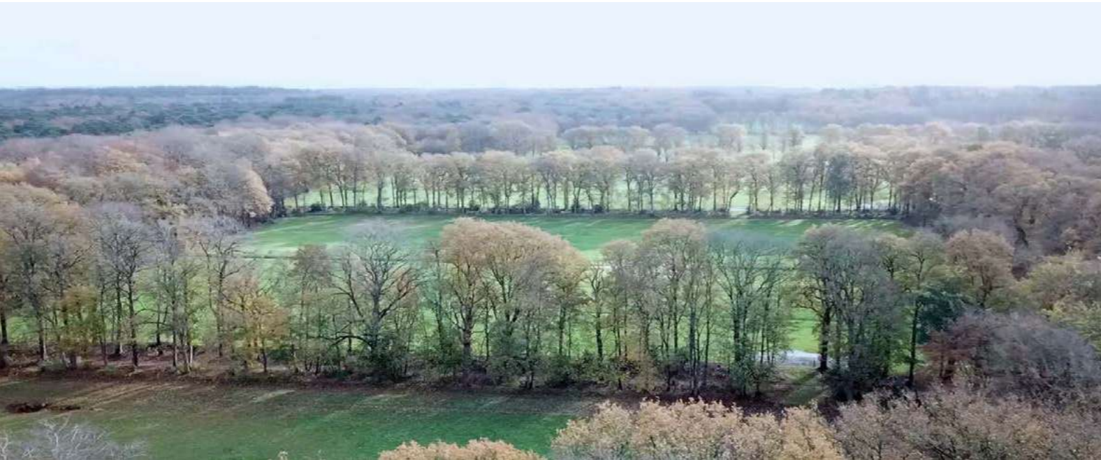
Bos, lanen, singels en houtwallen geïnventariseerd en opgenomen in de gebiedsbiografie Súdwesthoeke, gastgemeente voor de Masterclass van het Steunpunt.