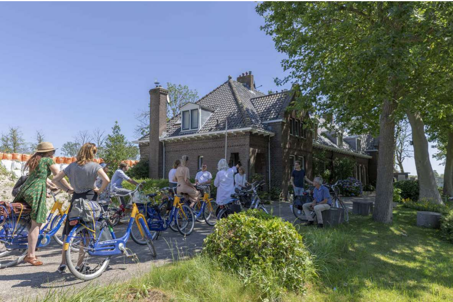
Zomerexcursie bij de Krijgsman in Muiden.