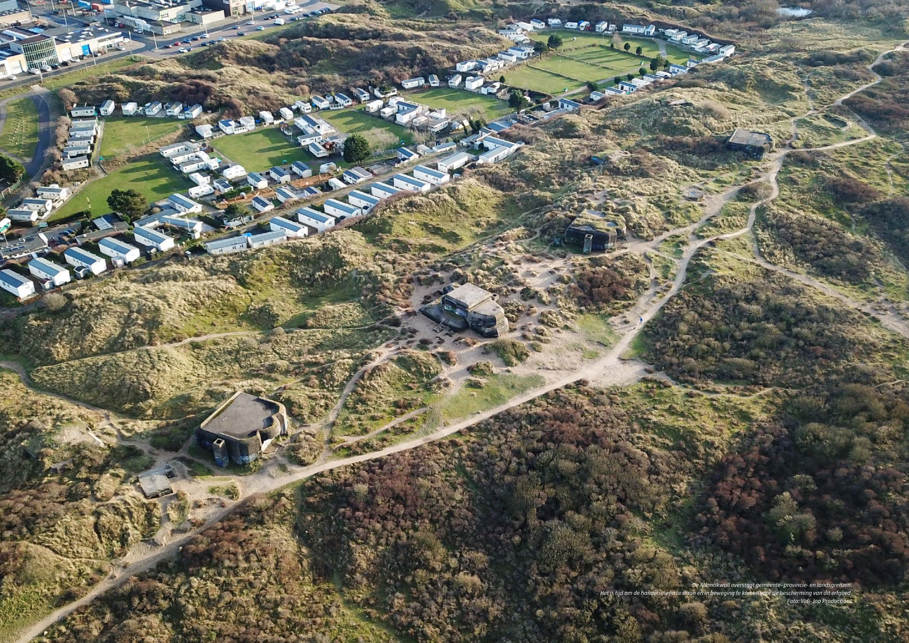
De Atlantikwall overstijgt gemeente- provincie- en landsgrenzen. Het is tijd om de handen ineen te slaan en in beweging te komen voor de bescherming van dit erfgoed.