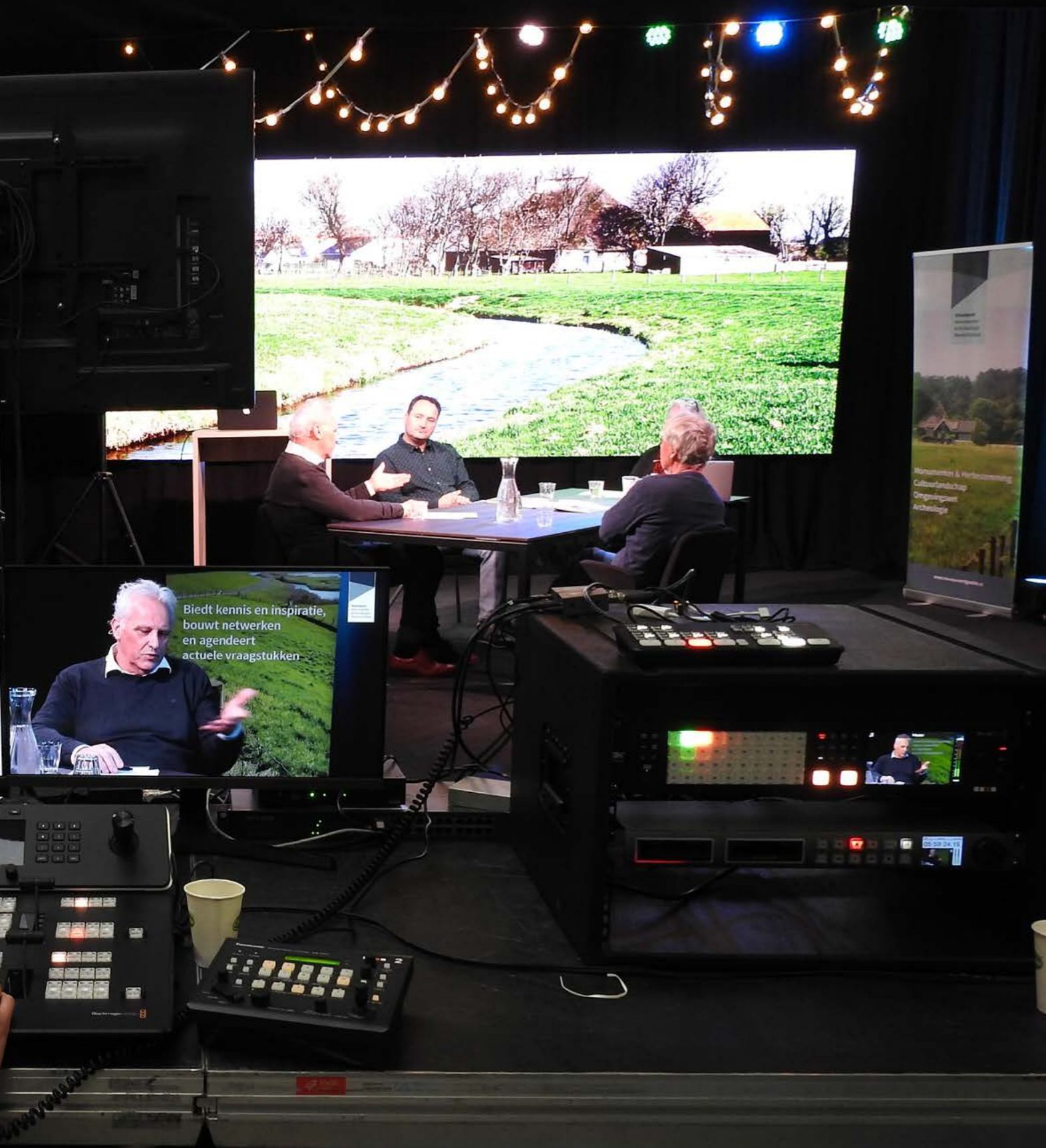
Oer IJ webinar