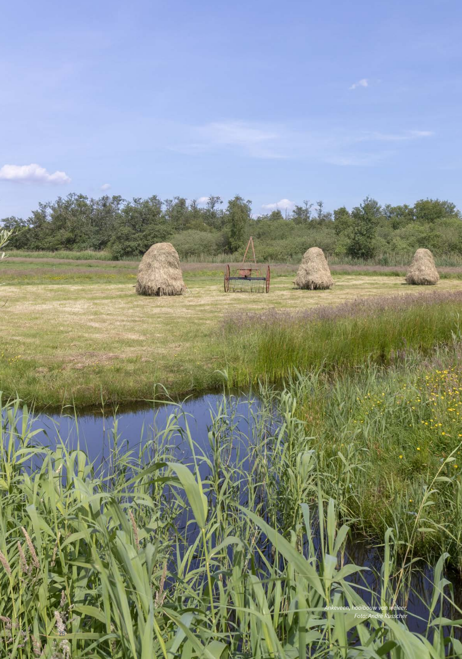
Ankeveen, hooibouw van weleer.