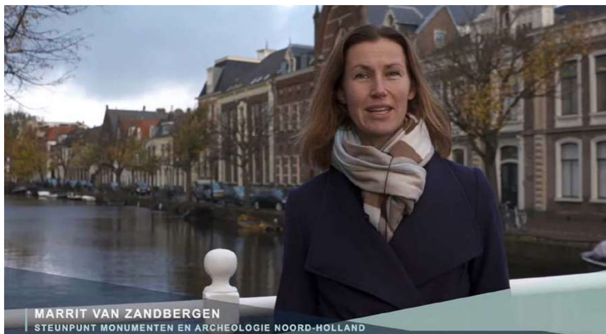
Introductiefilm bij de Masterclass voor Bouwtoezichters