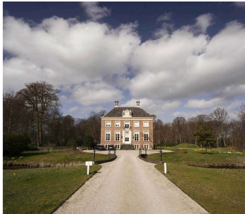
Huis te Manpad, Heemstede.