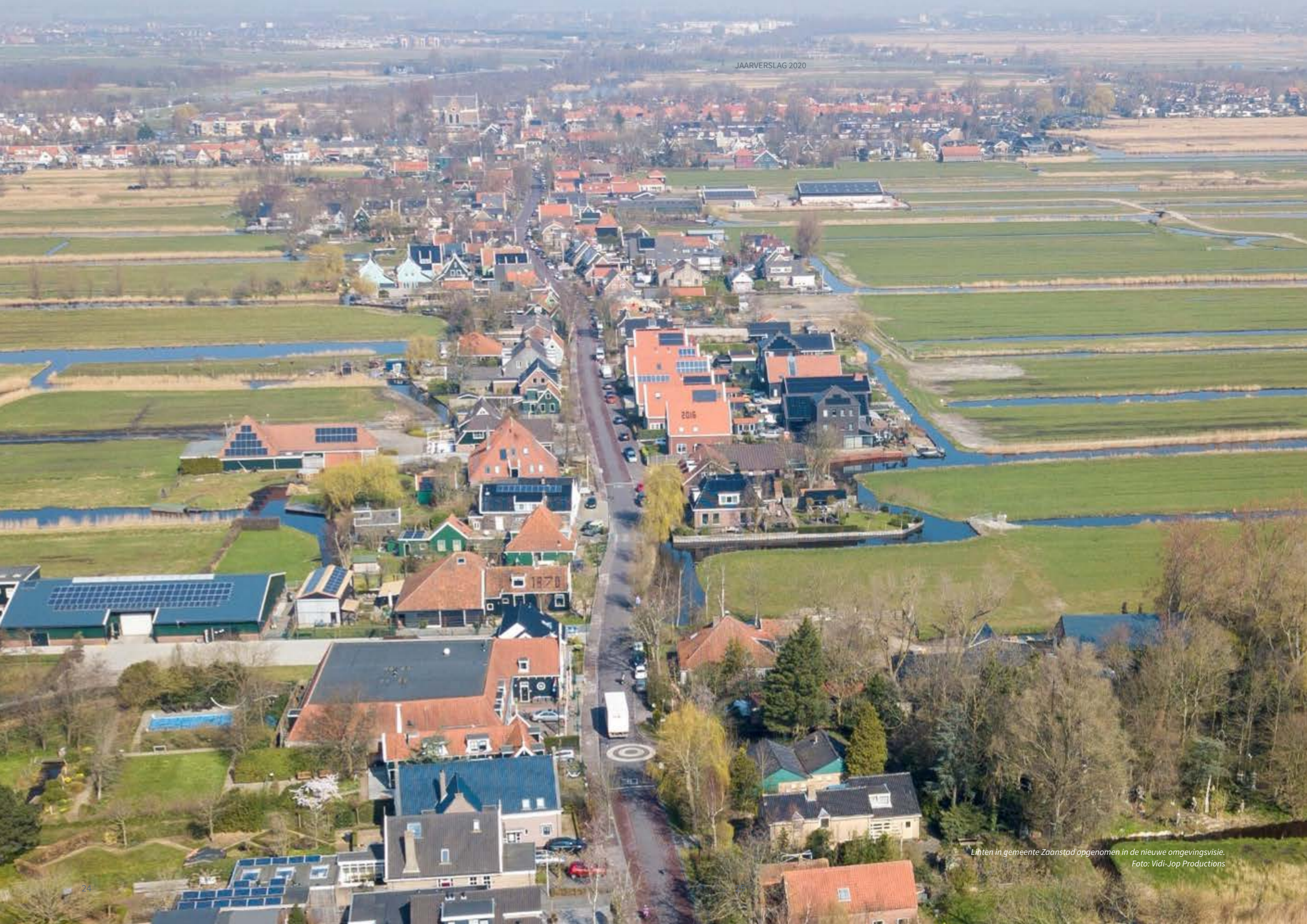
Linten in gemeente Zaanstad opgenomen in de nieuwe omgevingsvisie.