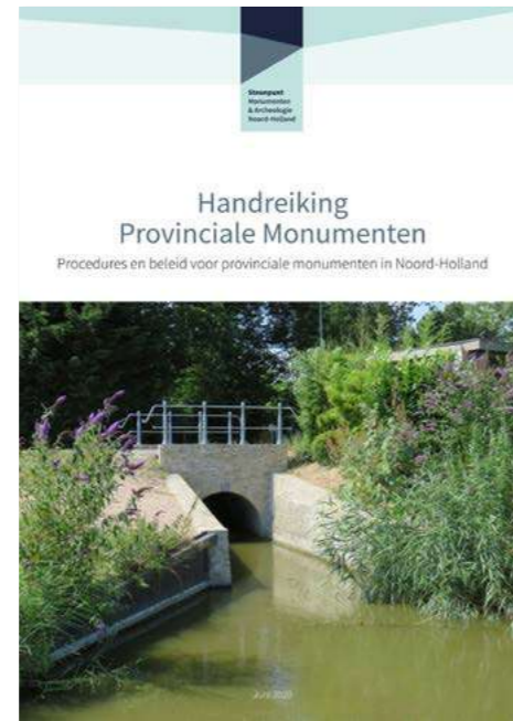
Handreiking Provinciale monumenten