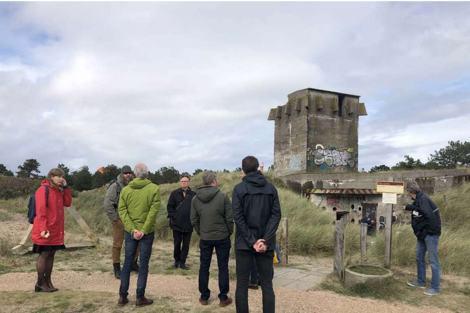
Expertsessie Atlantikwall Den Helder

deel uitmaakt van een veel langere militaire geschiedenis, richtte het programma zich meer op het organiseren van maatschappelijke betrokkenheid en het beter zichtbaar maken van dit erfgoed. Beverwijk vormt samen met Velsen het gebied van de voormalige Festung IJmuiden; aanleiding om daar een werksessie te organiseren waarin we kansen voor onderlinge samenwerking onderzochten. Drie werksessies rondom één thema bieden een duidelijke rode draad en deze is verwoord in een artikel dat verschijnt in Ode 2021. Dit onderwerp wordt in 2021 verder onderzocht. Bijzonder was dat twee van de drie sessies live waren.