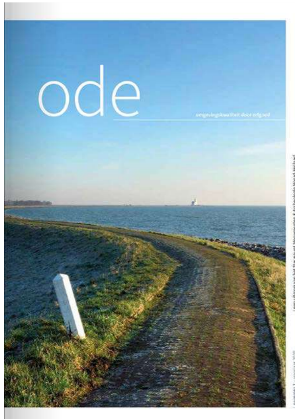
Ode het erfgoed tijdschrift van het Steunpunt

Lange tijd werd de Atlantikwall, een doorlopende structuur van bunkers, drakentanden, tankgrachten en andere verdedigingswerken langs de Europese kust, met enige terughoudendheid bekeken. Het is immers erfgoed van de bezetter. Nu, 75 jaar later, is deze houding aan het veranderen. De Rijksdienst voor het Cultureel Erfgoed werkt aan een visie op de Atlantikwall en ook vanuit gemeenten worden er steeds meer vragen over dit onderwerp gesteld. Het is een pijnlijk onderwerp, maar wel onderdeel van onze militaire geschiedenis. Daarom heeft het Steunpunt drie werksessies over het erfgoed van de Atlantikwall georganiseerd. Het doel van de bijeenkomsten was om te onderzoeken wat er speelt bij gemeenten als het gaat over de Atlantikwall. In Bloemendaal ging de bijeenkomst vooral over de bescherming van de bunkers en andere onderdelen van de verdedigingslinie. In Den Helder, waar de Atlantikwall onder-