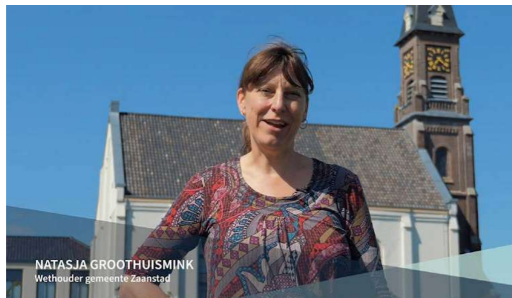
Blog van gemeente Zaanstad in het kader van de Erfgoedraad