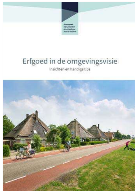
Publicatie Erfgoed in de omgevingsvisie

Een gebiedsbiografie is bij uitstek een manier om de kernkarakteristieken van een gebied in kaart te brengen en om op basis hiervan ontwikkelprincipes en -doelen te bepalen. Veel gemeenten gebruiken daarom een gebiedsbiografie als onderlegger voor de omgevingsvisie. Het Steunpunt heeft in samenwerking met gemeente Fryske Marren een masterclass georganiseerd over dit onderwerp. Hoe ziet een gebiedsbiografie er uit, wat zijn de aandachtspunten bij het maken van dit document en welke partijen zijn erbij betrokken? Hoe wordt vervolgens de brug geslagen naar de omgevingsvisie? Naast de masterclass heeft het Steunpunt meerdere gemeenten geïnformeerd over de mogelijkheden van gebiedsbiografieën in relatie tot de omgevingsvisie.