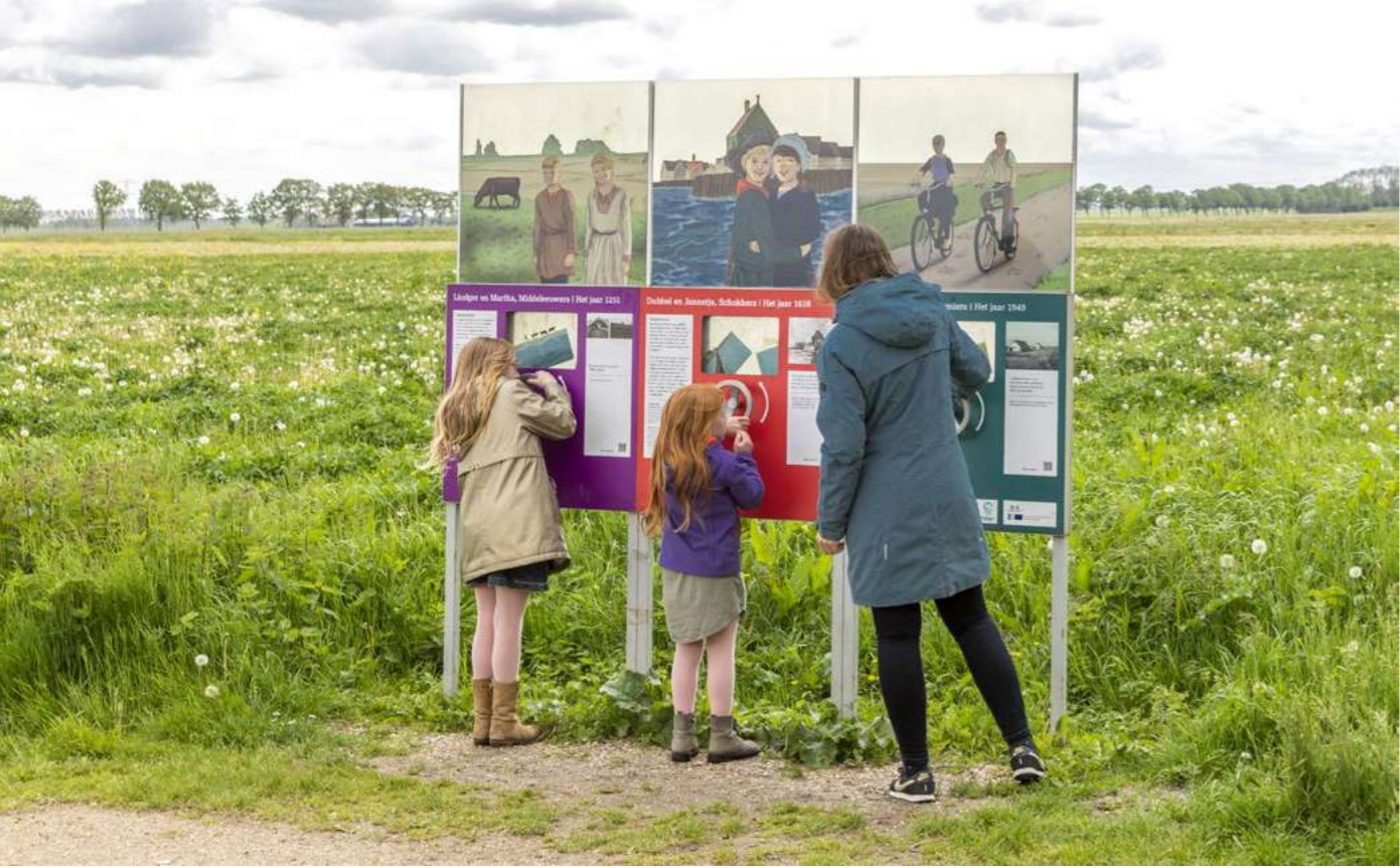
Voorbeeldproject Archeoroute op Schokland.

door afwezigheid van de vaste ambtenaar op het gebied van archeologie in de gemeente aanleiding om het gesprek uit te stellen en om het aandachtsgebied te vergroten en het rondetafelgesprek samen te voegen met het archeologiegebied West-Friesland. Dit gebied is onderwerp van het Project: Provinciale archeologiegebieden in 2022.