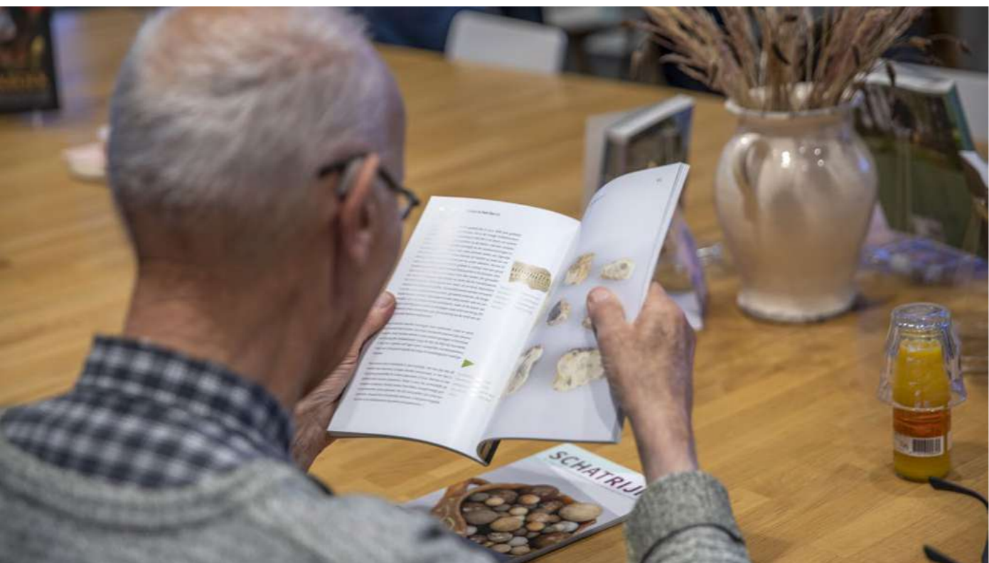
Op 4 november werd SCHATRIJK Oer-IJ in ontvangst genomen.

tatie zijn diverse persberichten aan media gestuurd, met als resultaat dat via zes afzonderlijke kanalen aandacht is besteed aan het magazine: in de Uitgeester, Oneindig Noord-Holland, De Castricummer, IJmuider Courant, Noord-Hollands dagblad en stichting Oer-IJ. De SCHATRIJK is bovendien gedeeld op social media (LinkedIn, Twitter) en via onze nieuwsbrief. Ook is gezorgd voor verspreiding van SCHATRIJK aan gemeenten en aan archeologische werkgroepen, Huis van Hilde, historische verenigingen en stichting Oer-IJ. De totale oplage van de SCHATRIJK is 1000 stuks.