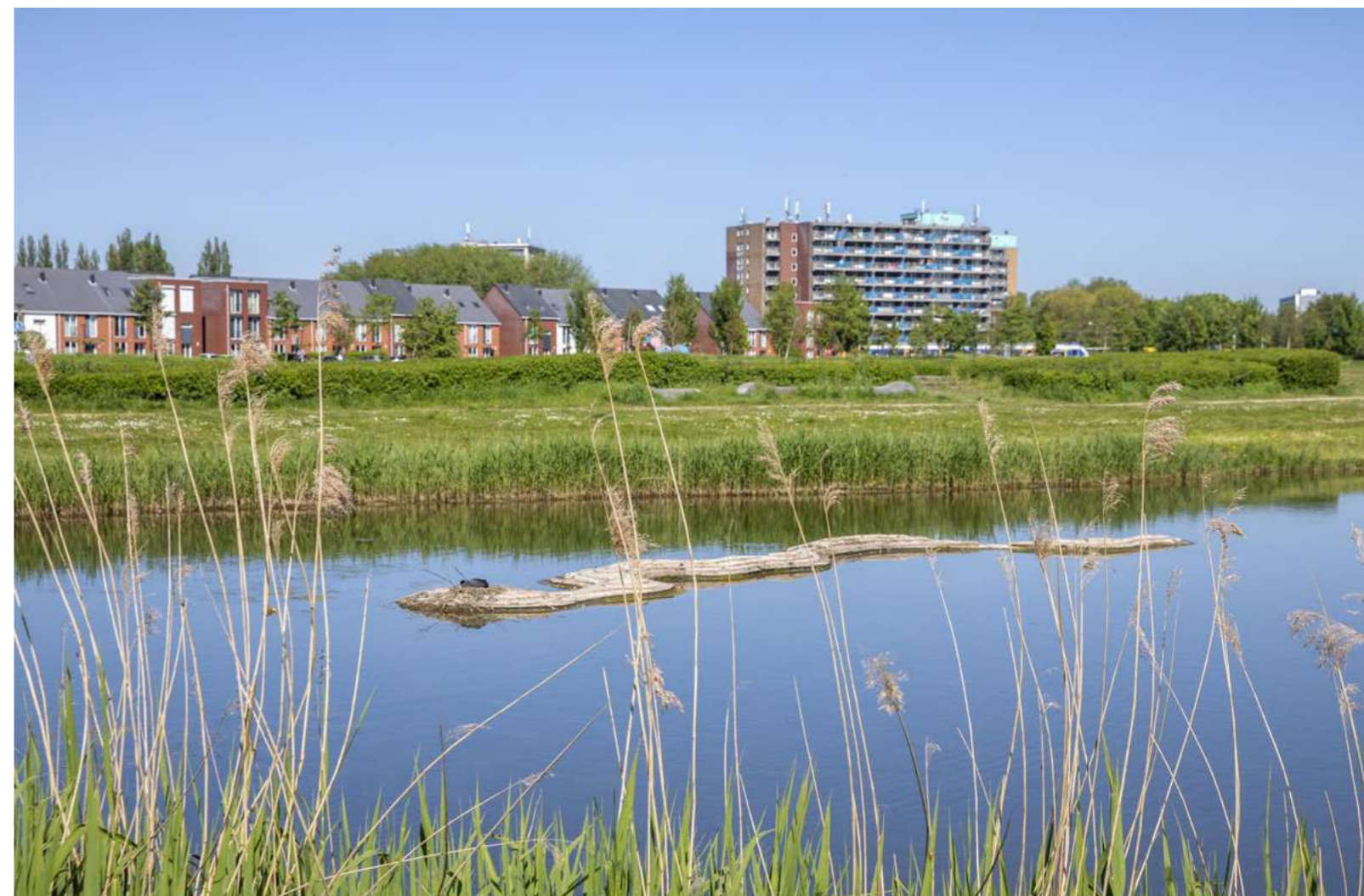
Voorbeeldproject Wateroffers in Heemskerk (foto: André Russcher).