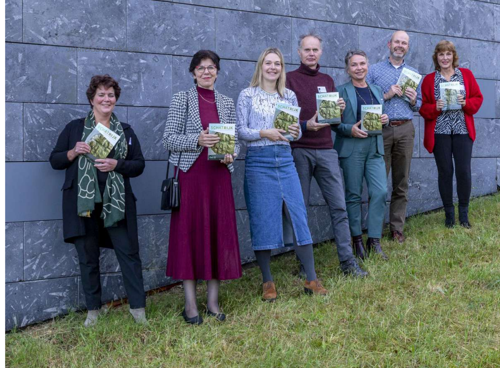
Presentatie SCHATRIJK Oer-IJ.

Een van de mooie publicaties van het Steunpunt is het magazine SCHATRIJK. Deze 'archeoglossy' is een middel om de mooie archeologische vindplaatsen en belangrijke vondsten in een provinciaal archeologiegebied onder de aandacht te