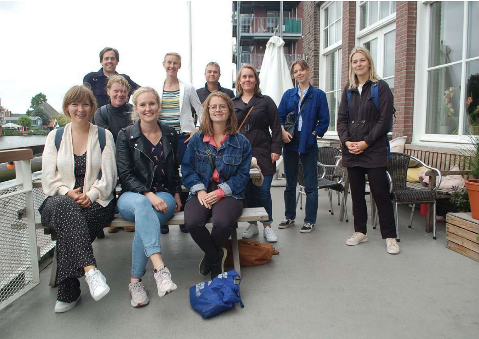
Netwerk voor nieuwe erfgoedprofessionals op excursie in Zaandam