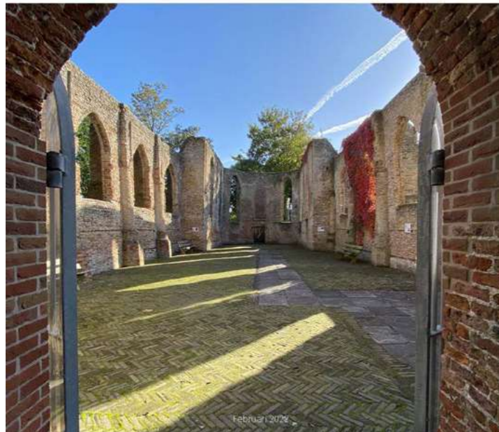
Handreiking van Kerkenvisies naar omgevingsplan

Handreiking voor Noord-Hollandse gemeenten