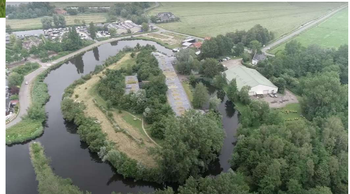
Fort Bezuiden Spaarndam

toekomstig beheer van het archeologische erfgoed in Noord-Holland. Het geeft beleidsmakers en vergunningverleners een beter afwegingskader voor het nemen van beslissingen over (ruimtelijk) beleid en bij vergunningverlening. De uitkomsten van dit onderzoek werden gepresenteerd en besproken in het Erfgoedteam op 16 november over dit thema, waarna het stuk aangepast werd met de uitkomsten van de discussie. In 2022 zullen we het onderwerp verder aan de orde laten komen.