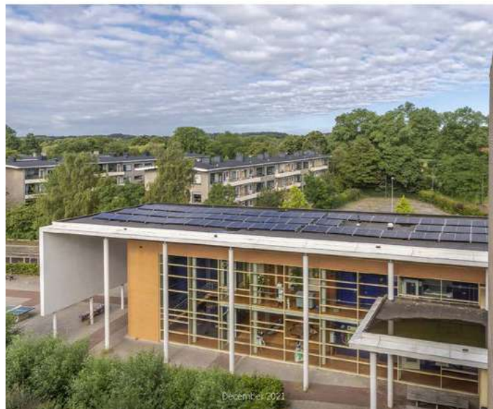
Handreiking Duurzaam monumentenwerk is maatwerk