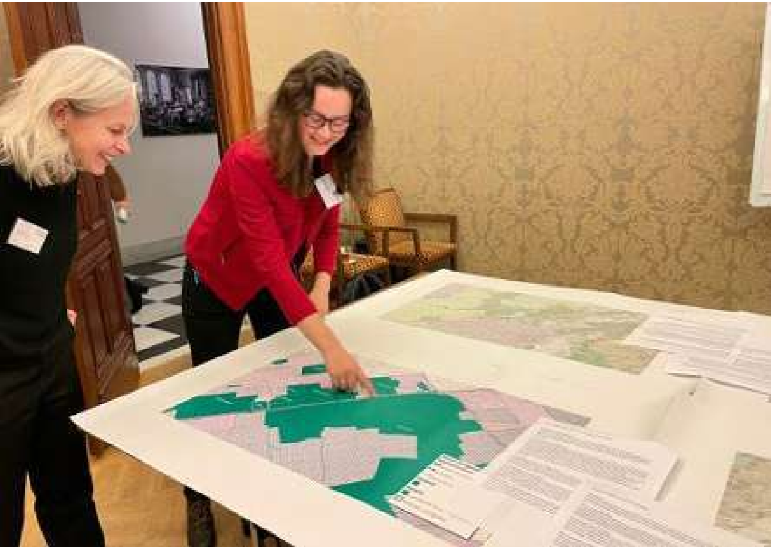
Deelsessie van het Steunpunt op het Nationaal Monumentencongres.