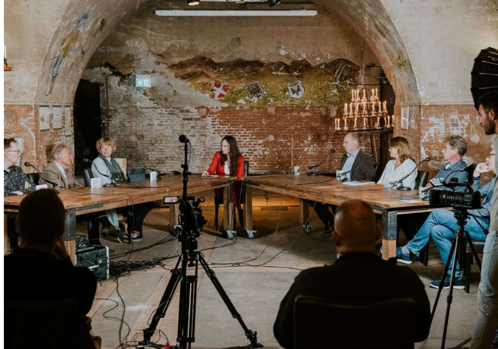
Landschapstalk Atlantikwal

De Casestudy's gebouwd erfgoed worden aangewend om vraagstukken van gemeenten onder de loep te nemen of om grotere erfgoedvraagstukken in een onderzoek onder te brengen.