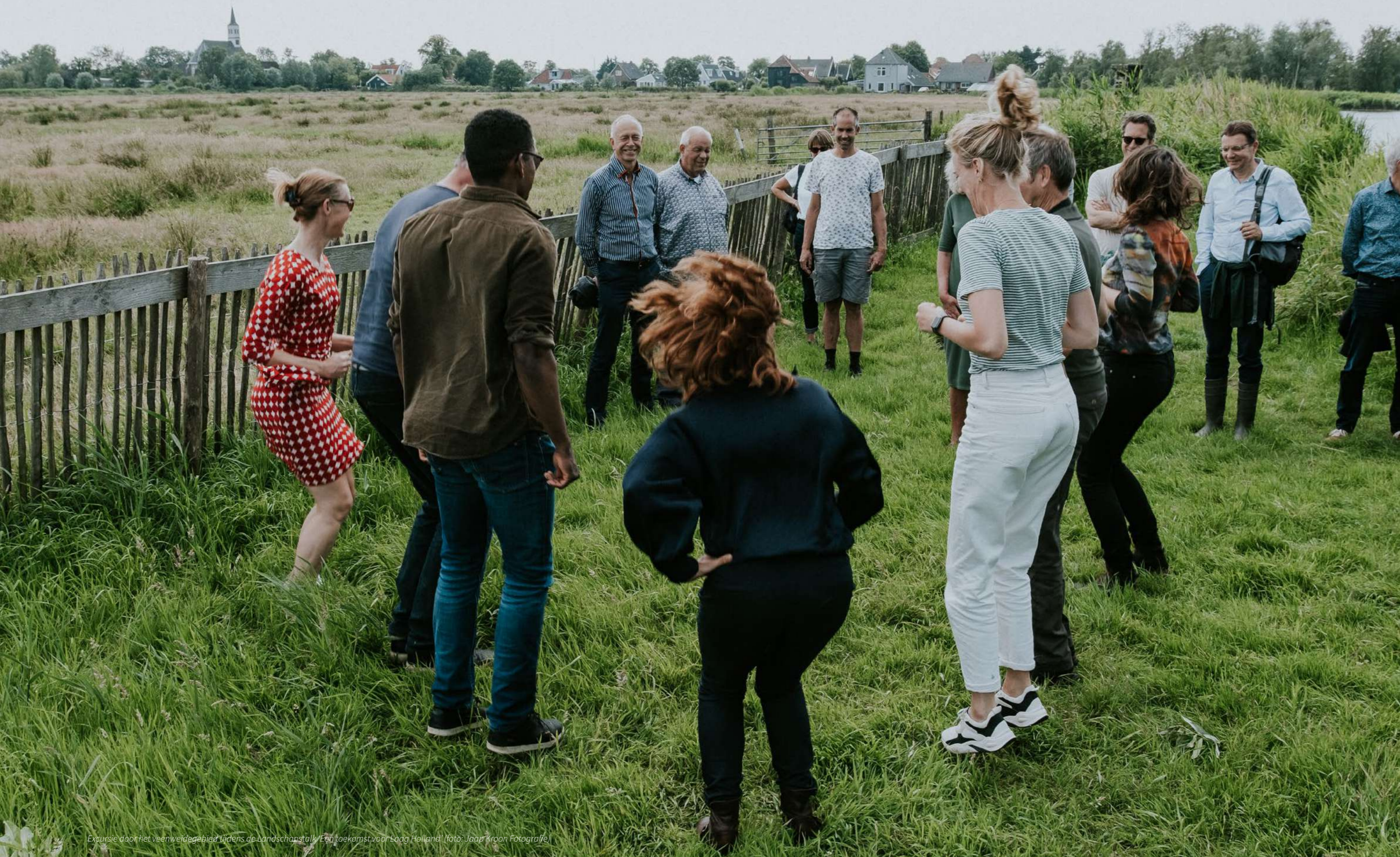
Excursie door het veenweidegebied tijdens de Landschapstak 'Een toekomst voor Laag-Holland'