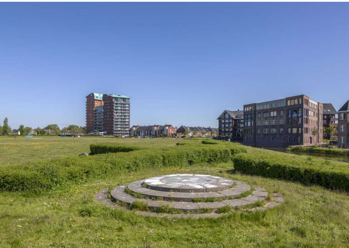
Voorbeeldproject park de Vlaskamp in Heemskerk

Het uitdragen en participeren in archeologie is een relevant onderwerp. Het doel van het project Community Archaeology was dan ook om betrokkenheid met het verleden te vergroten door interactieve workshops met gemeentebesturen te organiseren, waarbij thema's als inclusiviteit onder de aandacht kunnen worden gebracht. Wegens de Coronamaatregelen is het niet mogelijk gebleken om in 2021 interactieve workshops te organiseren. De ruimte van dit project is daarom besteed aan de voorbereidingen voor de SCHATRIJK van het nieuwe provinciale archeologiegebied van 2022: West-Friesland.