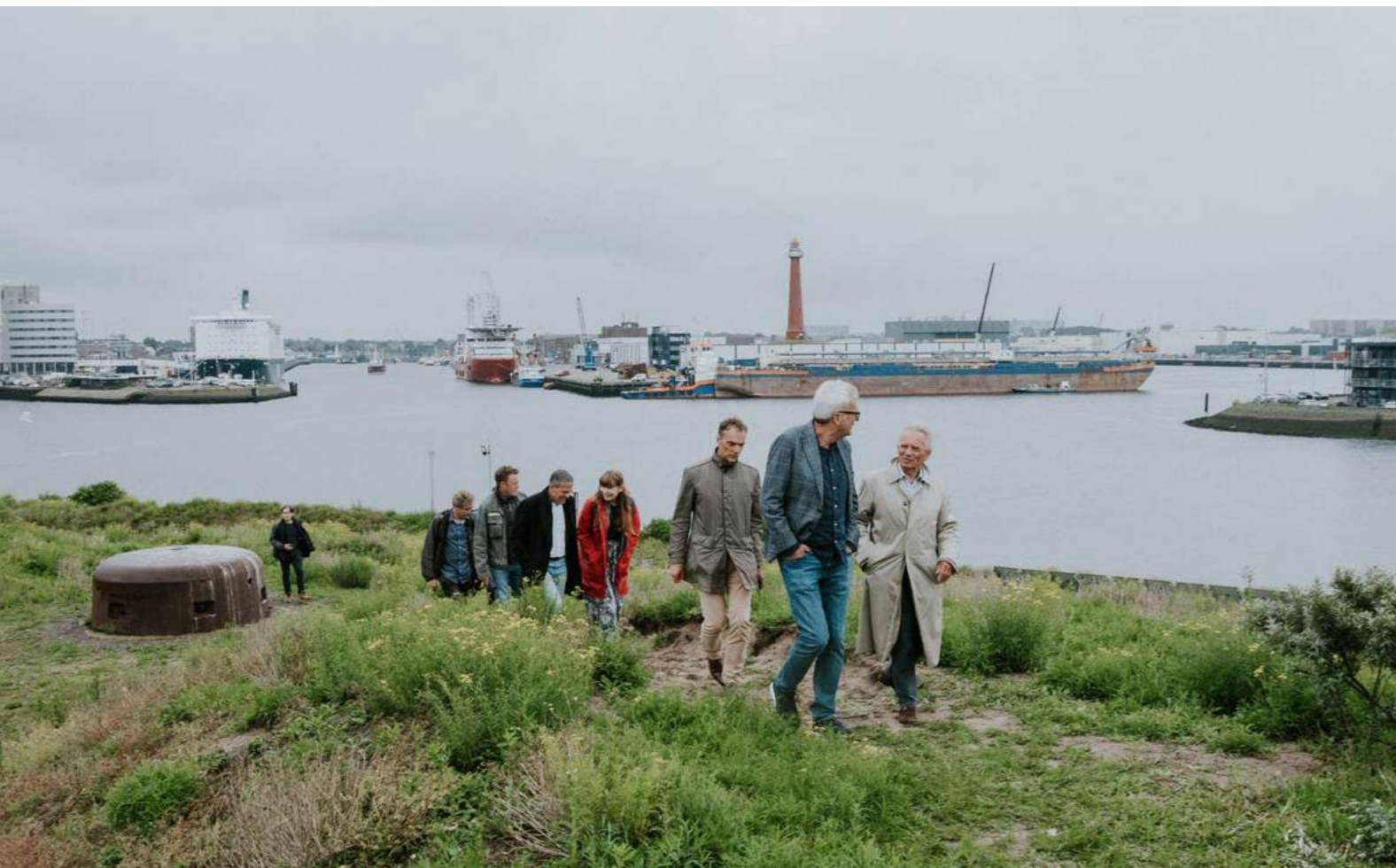
Excursie over Fort IJmuiden tijdens de landschapstalk 'Een visie op de Atlantikwall'