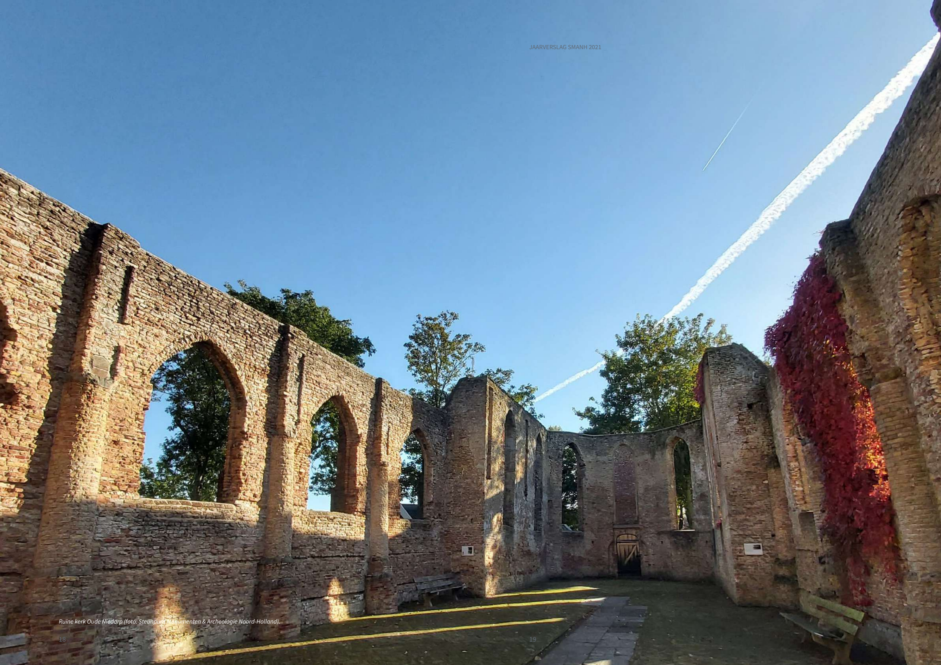
Ruïne kerk Oude Niedorp.