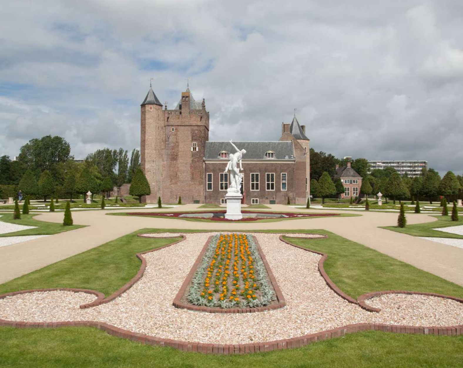
Buitenplaats Assumburg