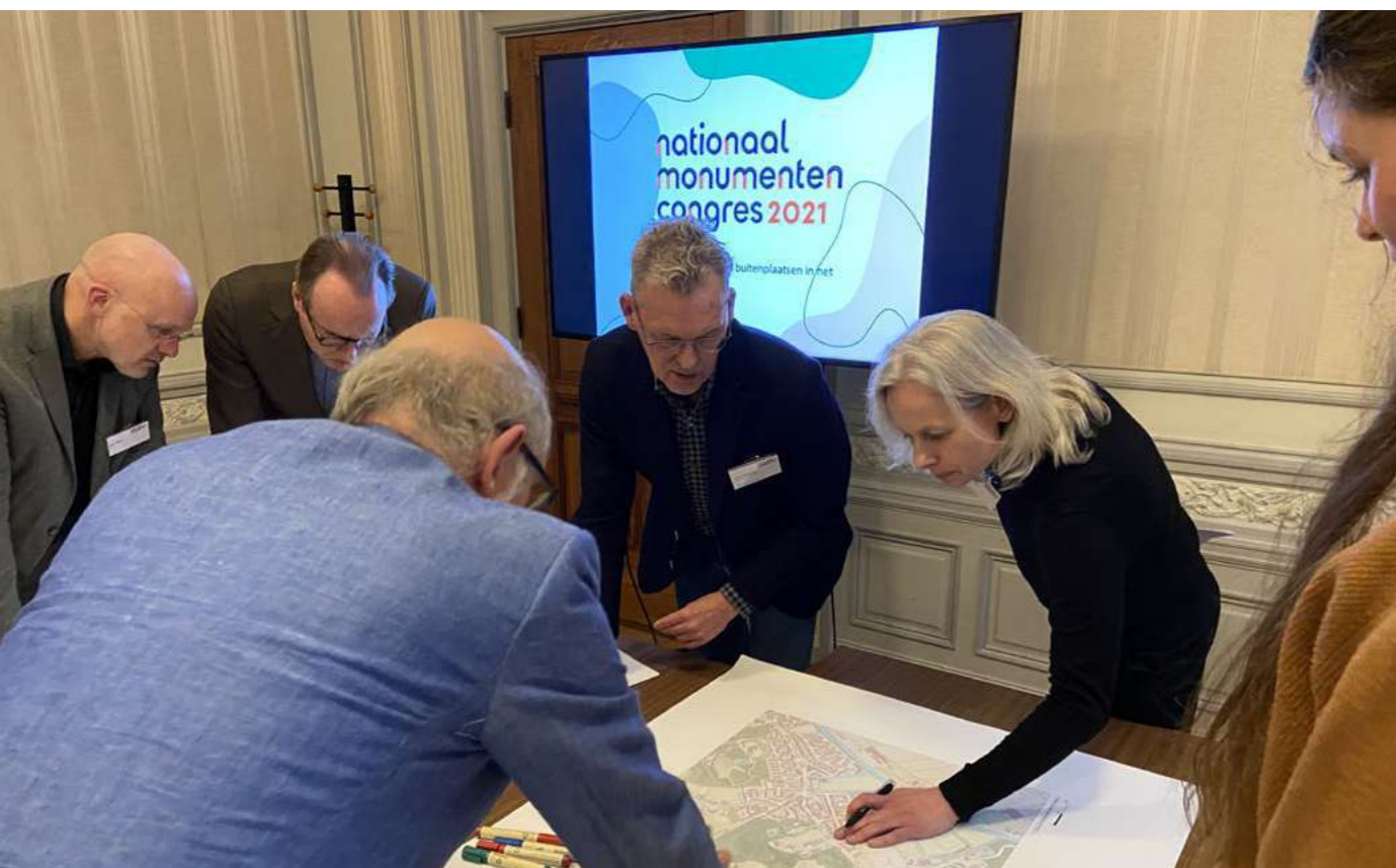
Deelsessie tijdens het Nationaal Monumentencongres