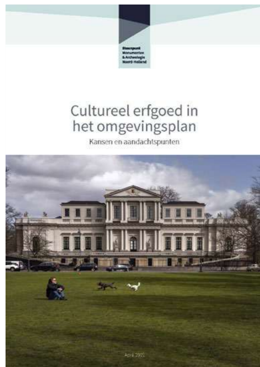
Publicatie 'Cultureel erfgoed in het omgevingsplan'