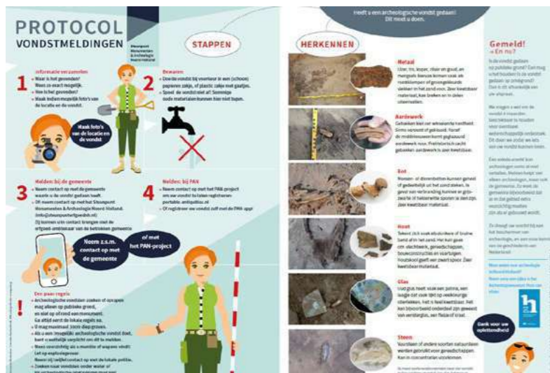
Protocol vondstmeldingen (ontwerp: BLK-VLD Uitgevers)

Op 13 januari 2021 heeft het rondetafelgesprek over het Oer-IJ plaatsgevonden dat in 2020 reeds was voorbereid. In 2021 is gekozen om het rondetafelgesprek te richten op de nieuwe fusiegemeente Dijk en Waard. Ondanks de heel positieve ervaringen met de online webinar over het Oer-IJ, was de wens om voor Dijk en Waard een rondetafelgesprek te organiseren over de archeologische waarden in de nieuwe gemeente met meerdere deelnemers. Vanwege de coronamaatregelen was het echter niet mogelijk om dit op locatie te organiseren. Ook waren personele wisselingen