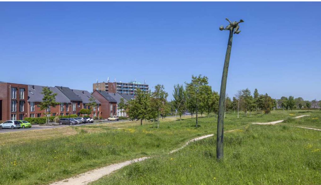
Kunst op de nieuwe kwelderwal, in Park Vlaskamp in Broekpolder, Heemskerk

In 2021 is tussen Provincie Noord-Holland en het Steunpunt veel contact geweest over wijzigingen in beleid met betrekking tot aardkundige waarden. Dit contact heeft geleid tot een interview met Martin Vos over deze wijzigingen, dat is gepubliceerd als artikel voor Nieuwsbrief 2.