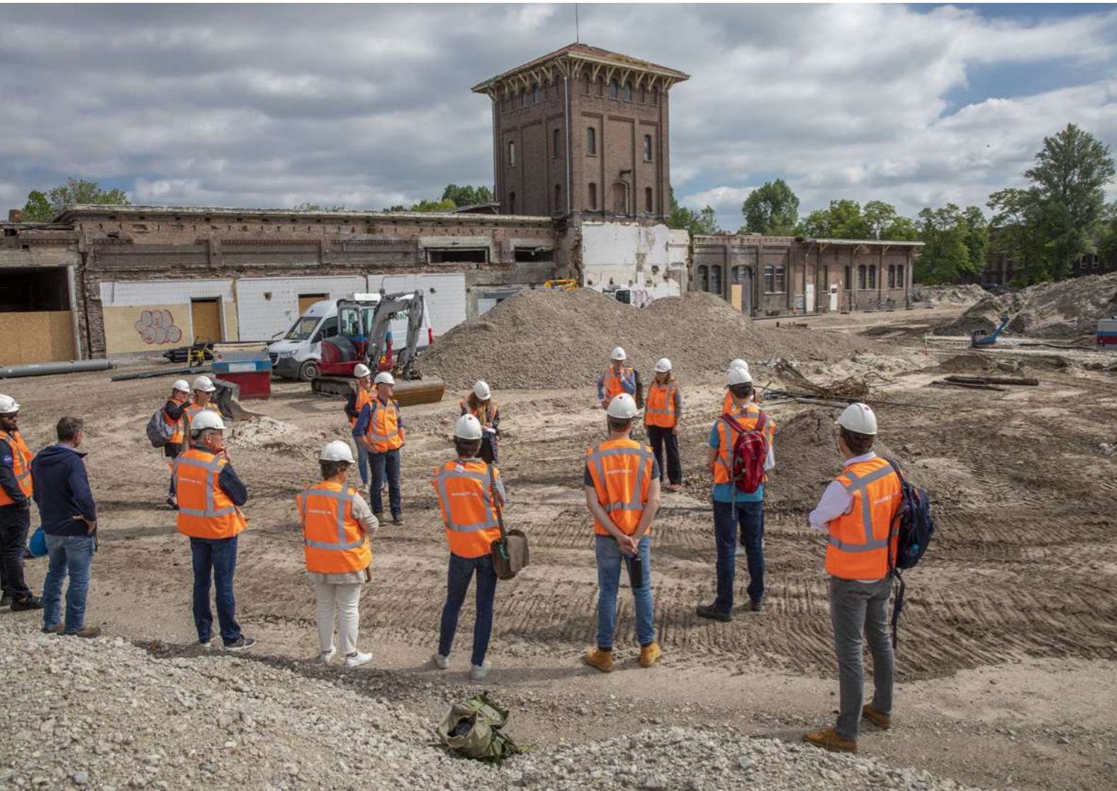
Zomerexcursie van het Erfgoedteam in Haarlem

In 2021 werden vier nieuwsbrieven verstuurd. De nieuwsbrieven zijn via e-mail verspreid onder alle gemeenteambtenaren en wethouders van Noord-Holland die zich bezig houden met erfgoed, ruimtelijke ordening, de Omgevingswet en landschap. In 2021 hebben zich 46 nieuwe abonnees voor de nieuwsbrief aangemeld. Daarmee zitten we nu op een totaal van 224 abonnees: vooral erfgoedambtenaren, ambtenaren van andere vakgebieden en erfgoed specialisten van andere organisaties zoals de RCE, de ErfgoedAcademie et cetera. De nieuwsbrieven bevatten zoals gebruikelijk inhoudelijke artikelen over erfgoedthema's, maar we bieden in de nieuwsbrief ook steeds meer bewegend beeld aan, zo worden films geïmplementeerd in de nieuwsbrief en in de laatste uitgave is zelfs de podcast 'Erfgoedraad' gepubliceerd. Hiermee is de nieuwsbrief dynamischer en bondiger geworden.