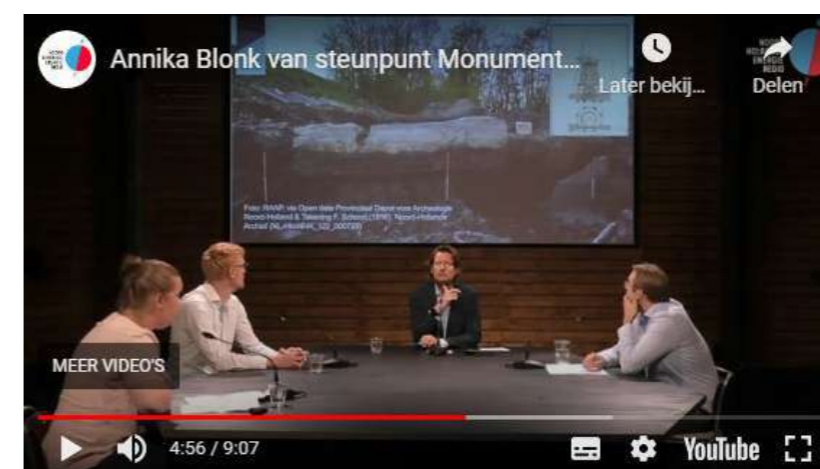
Het steunpunt neemt deel aan kennissessie van de RES Noord-Holland Zuid