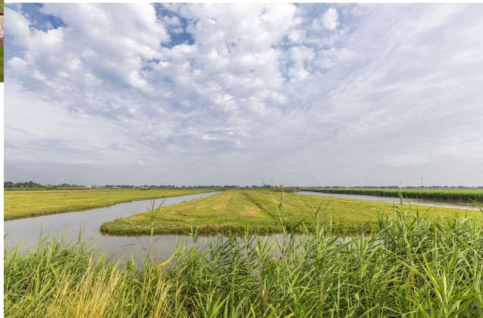
Waterberging Drachterveld, voorbeeldproject klimaatadaptatie

Wateroverlast en waterschaarste vragen steeds meer aandacht. Kennis over water is echter van alle tijden en steeds vaker ontstaan er projecten waarbij eeuwenoude kennis óf oude structuren als inspiratie dienen voor de huidige wateropgaven. Een voorbeeld hiervan is de nieuwe waterberging bij Drachterveld, waarvan het ontwerp is ingepast in het landschap door gebruik te maken van de bestaande historische kavelstructuur. Het Steunpunt heeft een artikel gepubliceerd van dit voorbeeldproject op haar website.