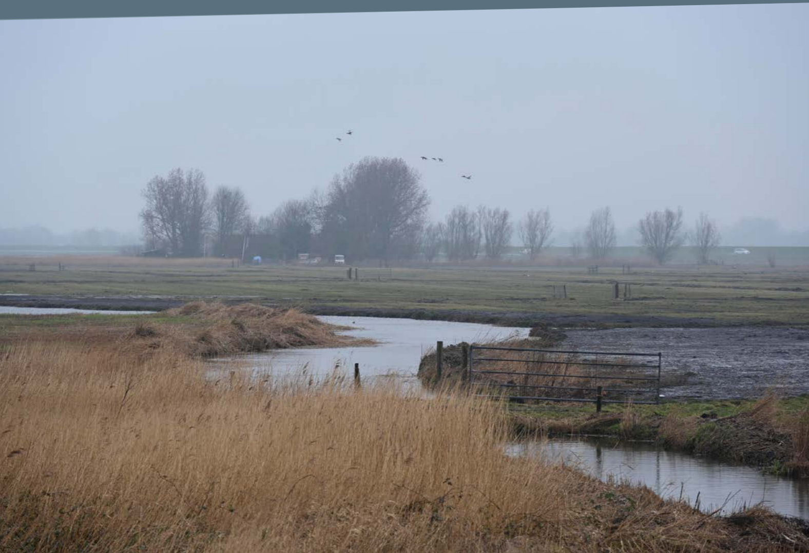
Gemeente Waterland.

‘De provincie wil gemeenten ondersteunen bij hun rol in de nieuwe Omgevingswet, cultuurhistorie onder de aandacht brengen in relatie tot ruimtelijke opgaven en beleidsvisies, en activiteiten ondersteunen rond ruimtelijke opgaven en in relatie tot archeologie en herbestemming. Stichting NMF en MOOI Noord-Holland stellen voor de uitvoering van de steunpunttaken een gezamenlijk activiteitenplan op. Dat bevat onder meer een website, digitale kennisbank, expertmeetings, vraagloket, kennisbijeenkomsten, contactdagen en uitgewerkte casestudies. Het Steunpunt richt zich daarbij in de eerste plaats op de ondersteuning van gemeenten, maar betreft een brede groep van organisaties uit het erfgoedveld bij de kennisbijeenkomsten, contactdagen, expertmeetings en casestudies.’ Uit: Beleidskader erfgoed en cultuur 2022, Provincie Noord-Holland