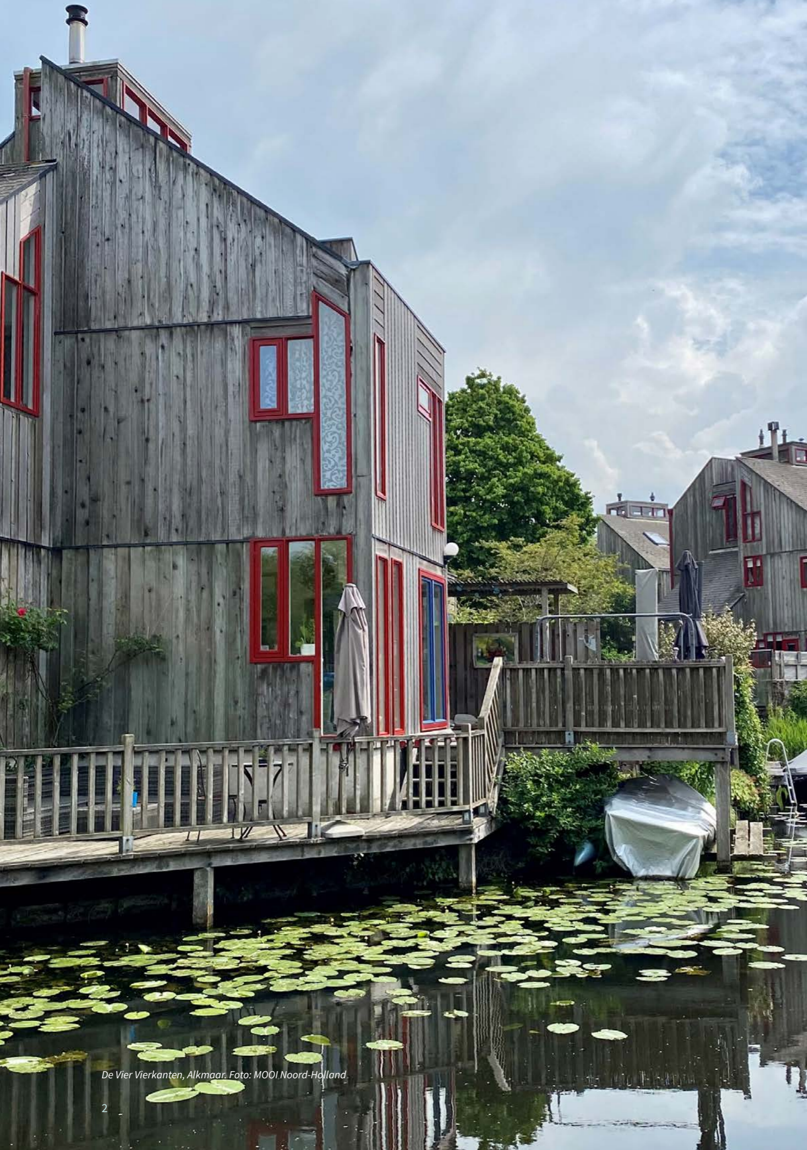
De Vier Vierkanten, Alkmaar.