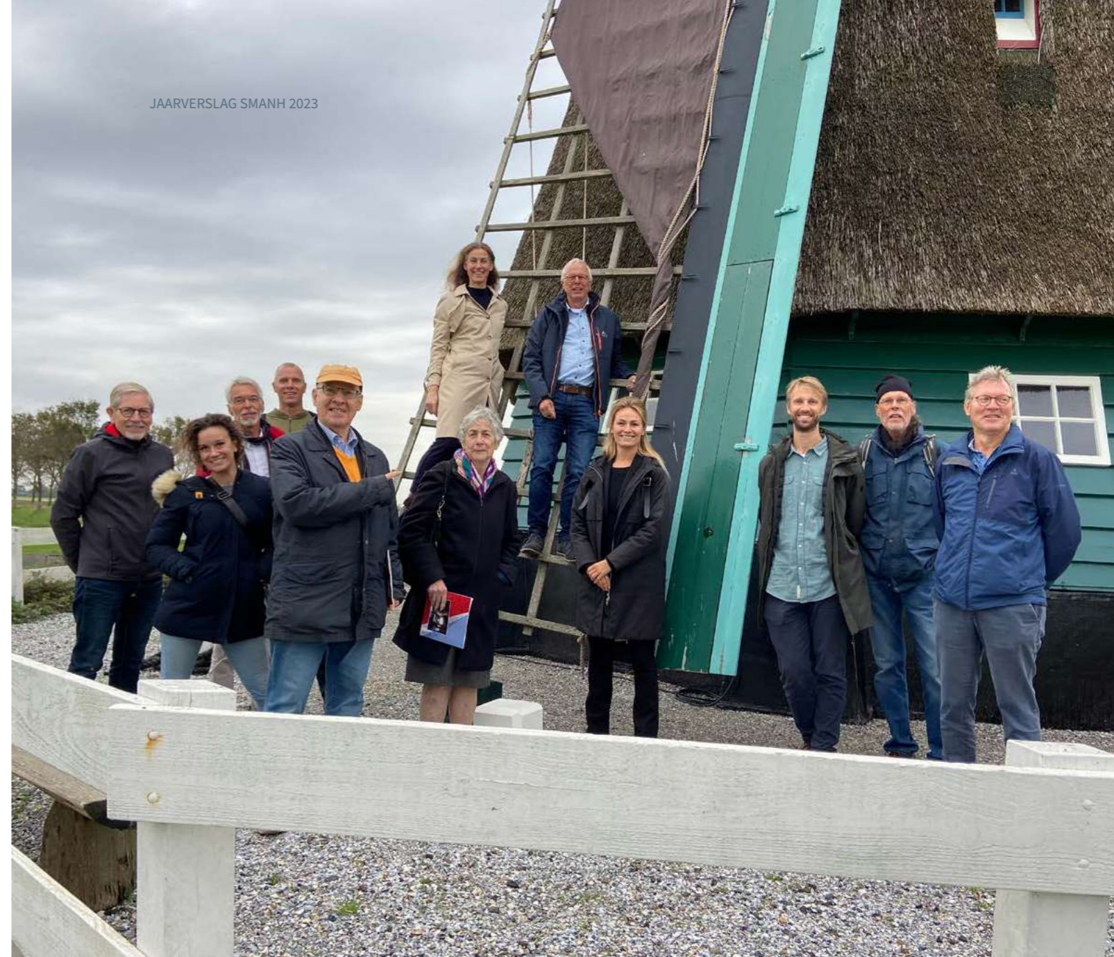
Excursie naar molen De Nachtegaal tijdens het Molensymposium.

Elke gemeente kent waardevol historisch groen. Soms is dat groen daadwerkelijk beschermd als monumentale boom of park, maar veelal is het gewoon aanwezig, gekoesterd en verder onbeschermd. Het Steunpunt heeft in samenwerking met Landschap Noord-Holland onderzoek gedaan naar de mogelijkheden voor groen erfgoed in het omgevingsplan. Dit is een uitgebreid onderzoek geworden dat is uitgevoerd in de periode 2021-2023. Nadat we het rapport gepubliceerd hebben in februari 2023 hebben we in maart een masterclass georganiseerd over het onderwerp met als doel om gemeenten praktisch inzicht te geven in de mogelijkheden om de ruimtelijke en fysieke kwaliteiten van het groene erfgoed te borgen met de nieuwe instrumenten van de Omgevingswet. Met deze instrumenten geven gemeenten onder meer aan