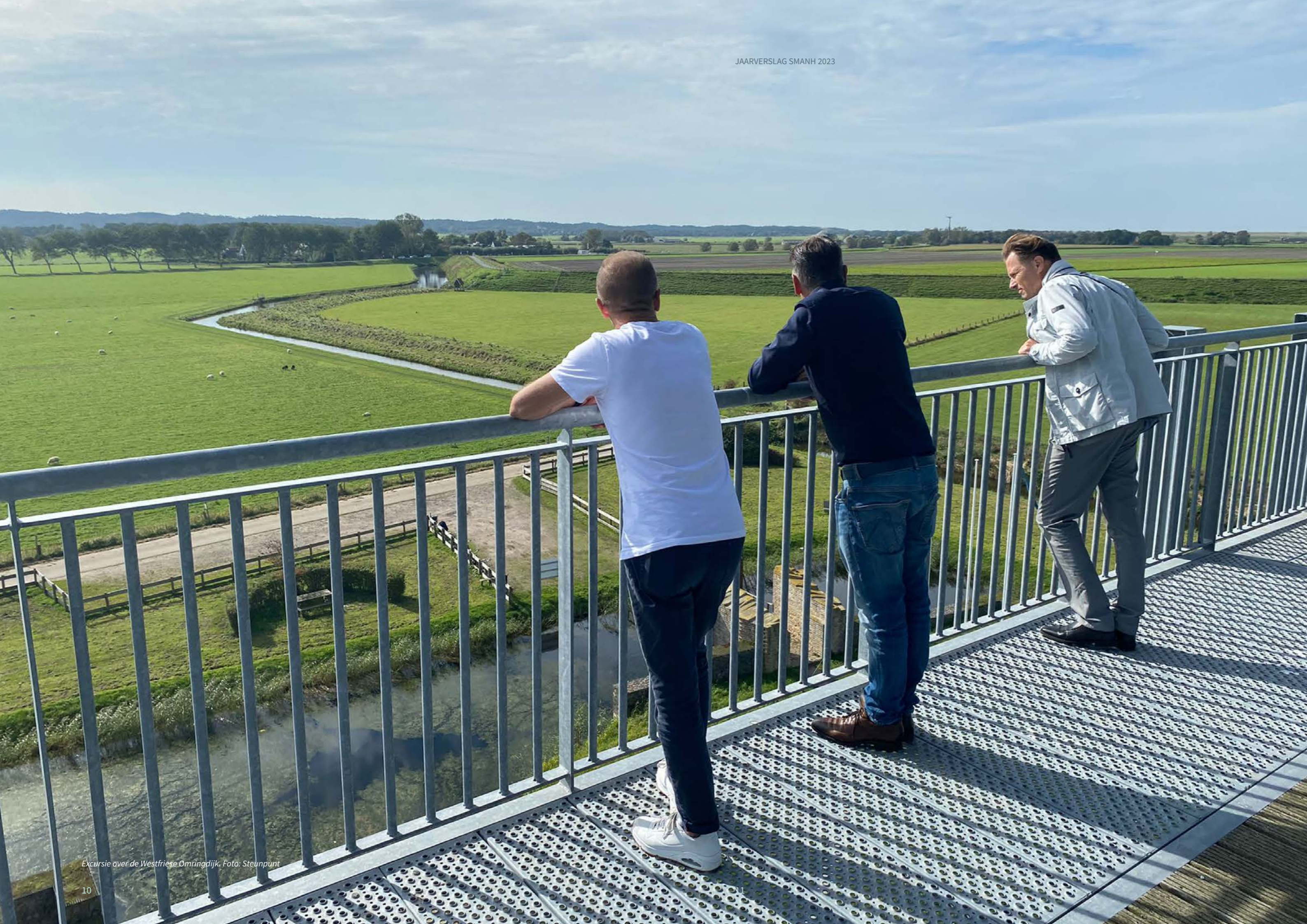
Excursie over de Westfriese Omringdijk.