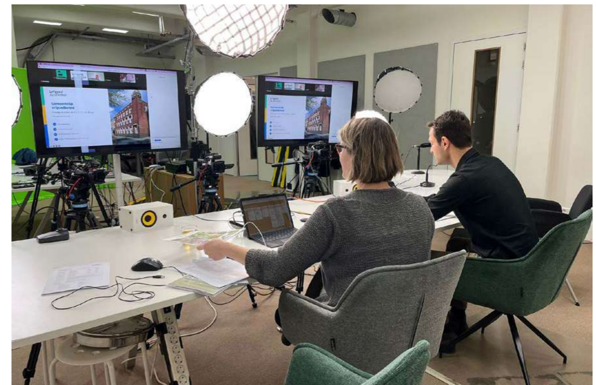
De ErfgoedAcademie schakelt de medewerkers van het Steunpunt in als spreker bij hun cursussen.