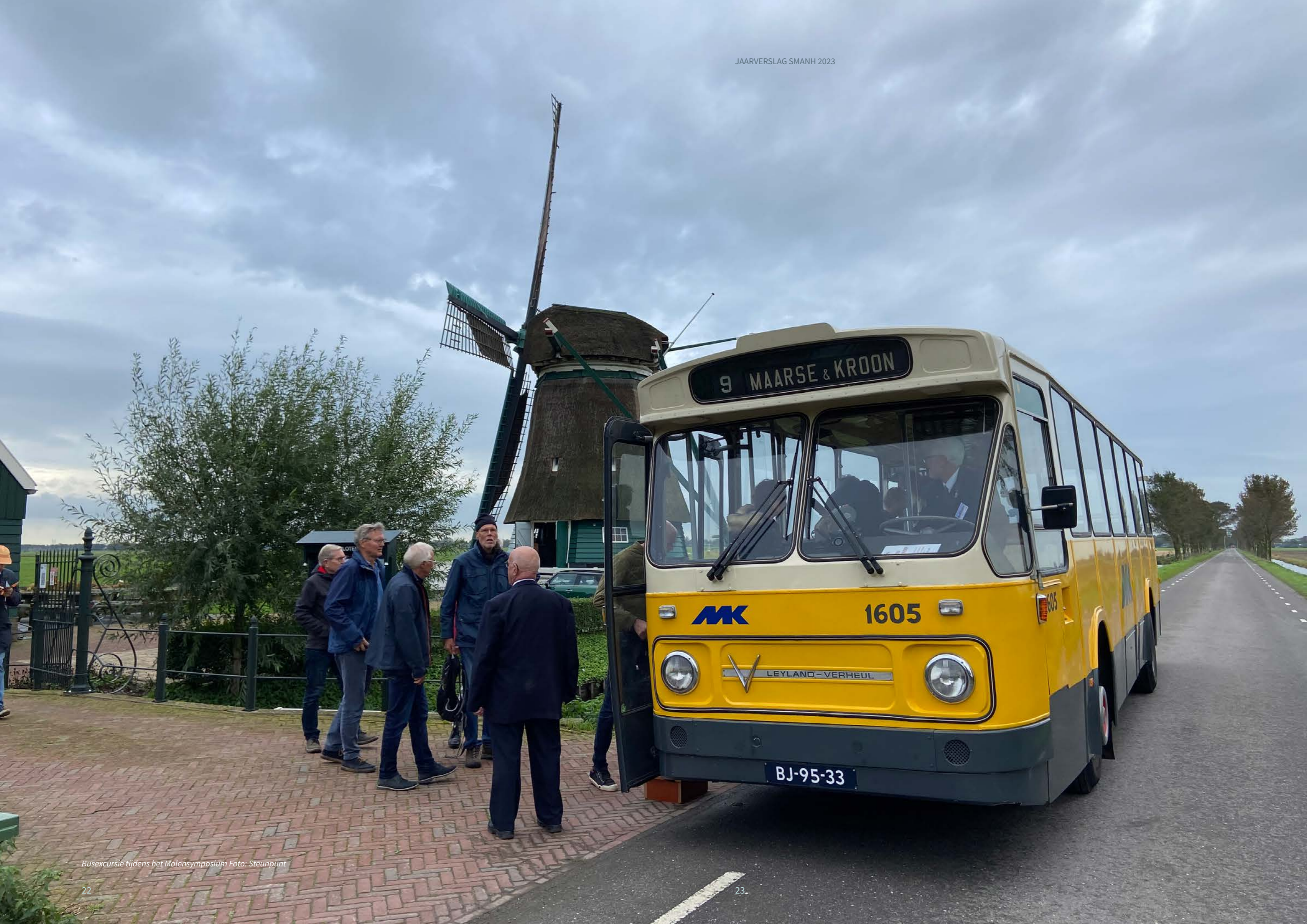
Busexcursie tijdens het Molensymposium