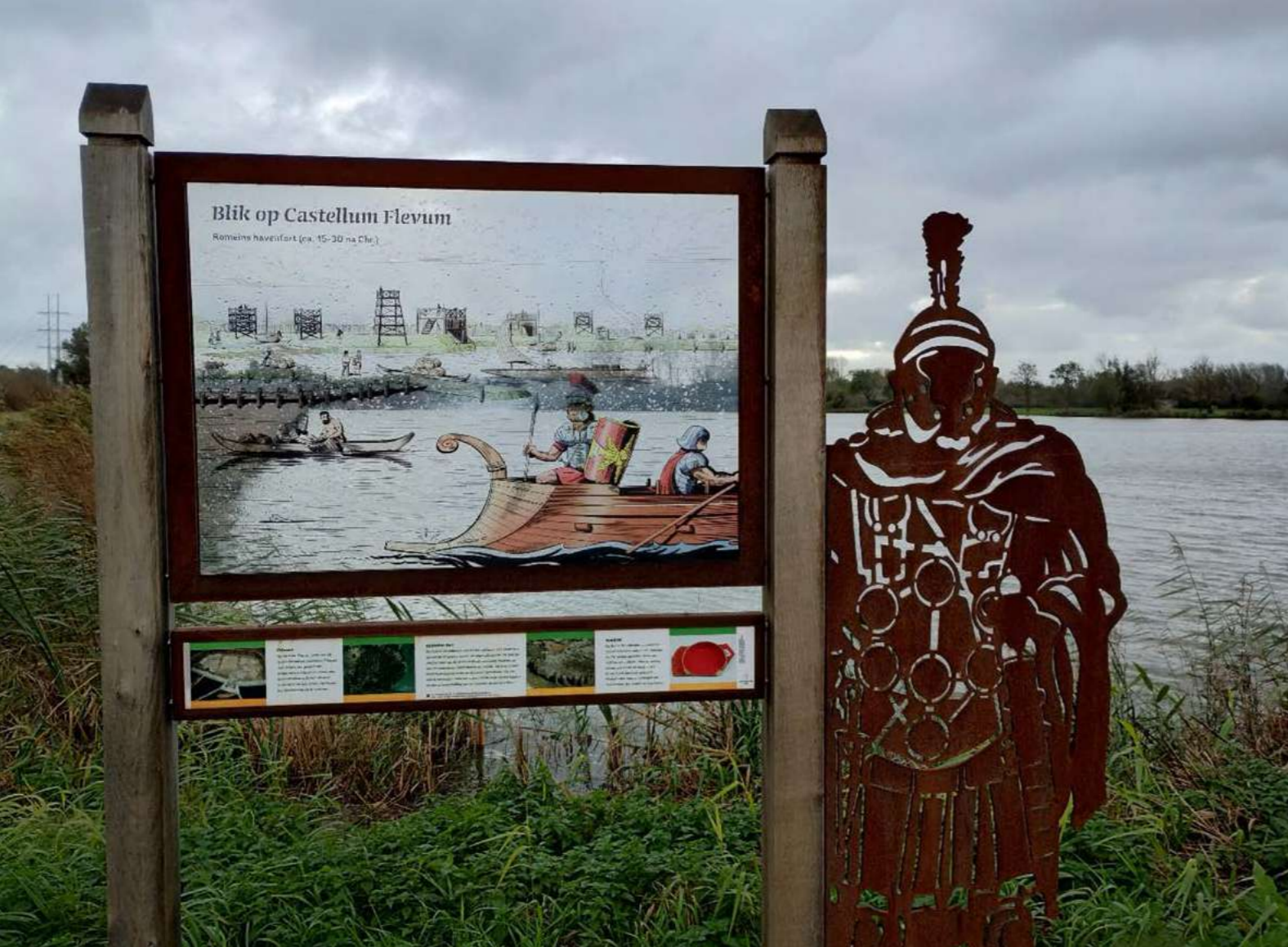
Romeinenroute Velsen.