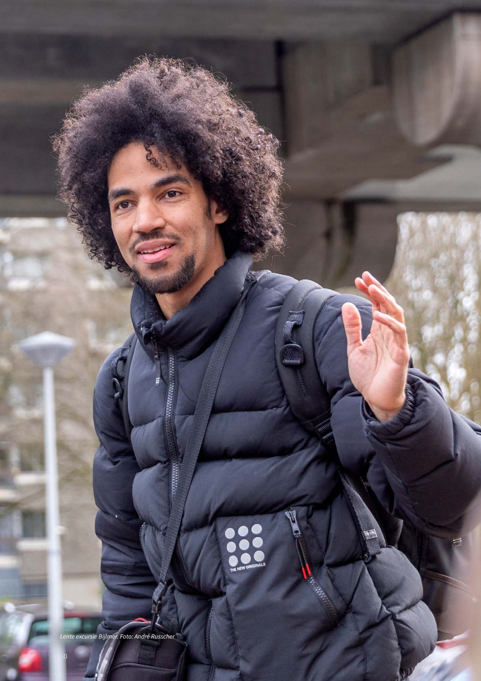
Lente excursie Bijlmer.

Het Steunpunt Monumenten & Archeologie Noord-Holland wordt mogelijk gemaakt door de Provincie Noord-Holland en de Rijksdienst voor het Cultureel Erfgoed.