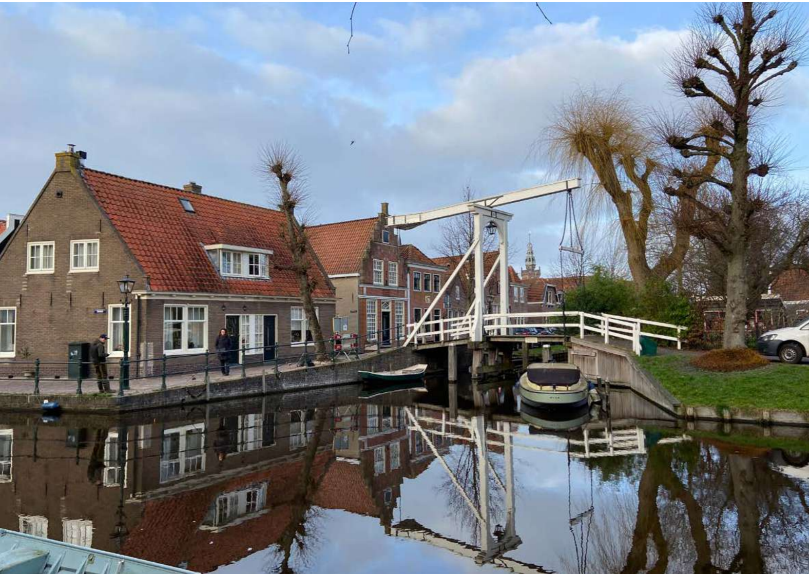
Zicht op Fluwelen Burgwal Monnickendam.

erfgoedwerk met verhalen, interviews en goede voorbeelden uit de rijke voorraad Noord-Hollands erfgoed. Dit jaar staat ode in het teken van goede omgevingskwaliteit, omdat goede omgevingskwaliteit een kerndoel is van de Omgevingswet. En daar zijn wij blij om, want als bij nieuwe ontwikkelingen wordt uitgegaan van de bestaande kwaliteiten, komt goede omgevingskwaliteit telkens een stap dichterbij. Goede omgevingskwaliteit ontstaat als iedereen die werkt in het ruimtelijk domein daar elke dag naar streeft, het liefst in onderlinge samenspraak. Om deze cultuurverandering bij gemeenten te stimuleren staat ode dit jaar vol met inspirerende artikelen over hoe verschillende sleutelfiguren in de erfgoedsector werken met goede omgevingskwaliteit als kerndoel. Met Ana Pereira Roders hoogleraar Heritage and Values aan de faculteit Bouwkunde, TU Delft hadden we een