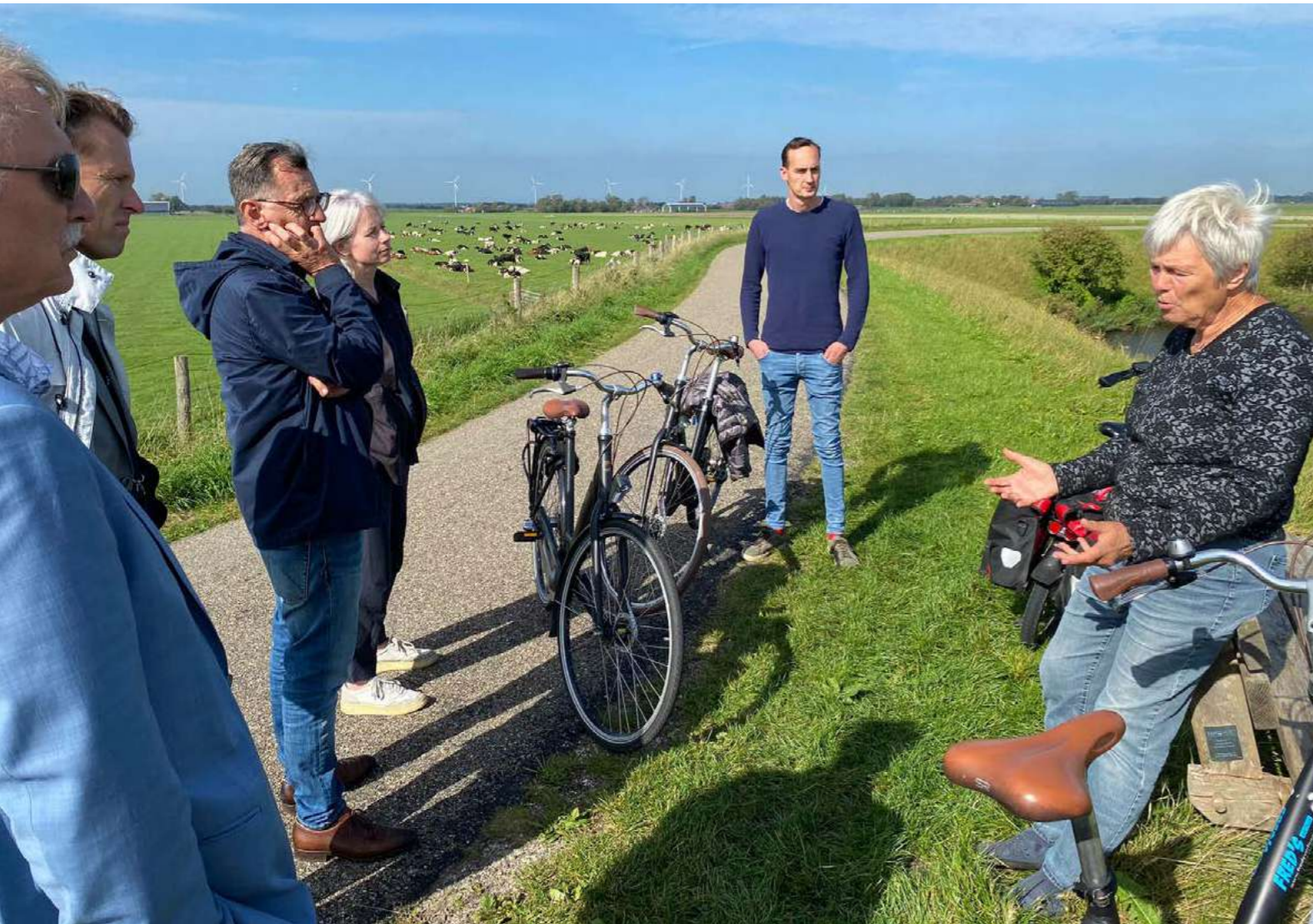
Een fietstocht over de Westfriese Omringdijk was een onderdeel van de bijeenkomst over deze dijk, een provinciaal monument dat door verschillende gemeenten loopt.