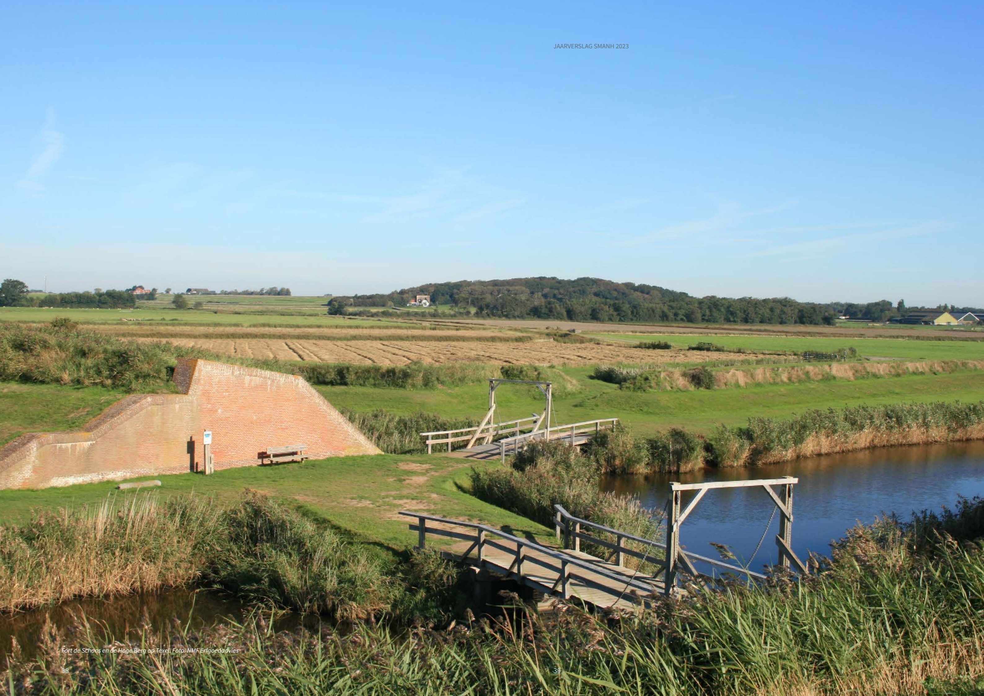
Fort de Schans en de Hoge Berg op Texel.