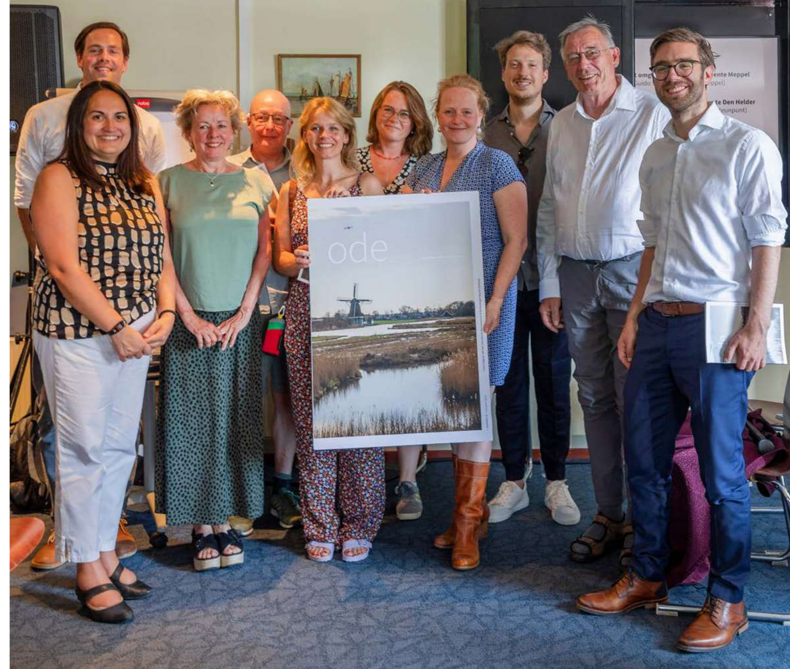
Lancering van ode op het Omgevingswetsymposium Samen Slimmer 2.0.

Hoe borg je de cultuurhistorische waarden van een landgoed in het omgevingsplan? En wat als dat landgoed deel uitmaakt van een grensoverschrijdende landgoederenzone, met kilometers lange lanen en zichtlijnen? Steunpunt Monumenten en Archeologie Noord-Holland en Erfgoedhuis Zuid-Holland hebben samen een eerste handreiking ontwikkeld om tot antwoorden te komen. In 2023 is een vervolg gegeven op deze handreiking door met een werkgroep van Omgevingswet- en erfgoeddeskundigen na te denken over de praktische invulling van het omgevingsplan voor dit gebied. De zoektocht heeft geleid tot een werkwijze en