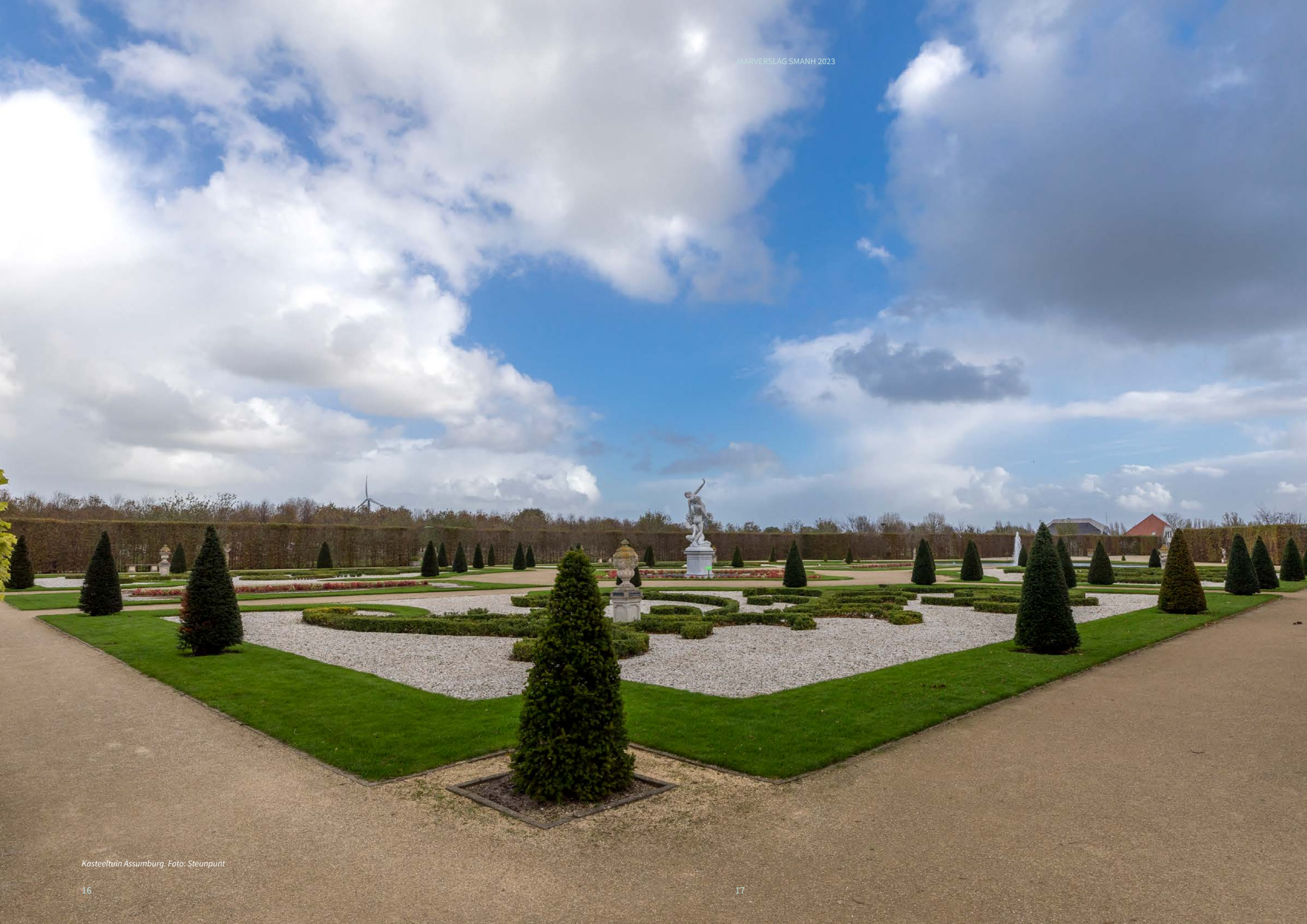
Kasteeltuin Assenburg.