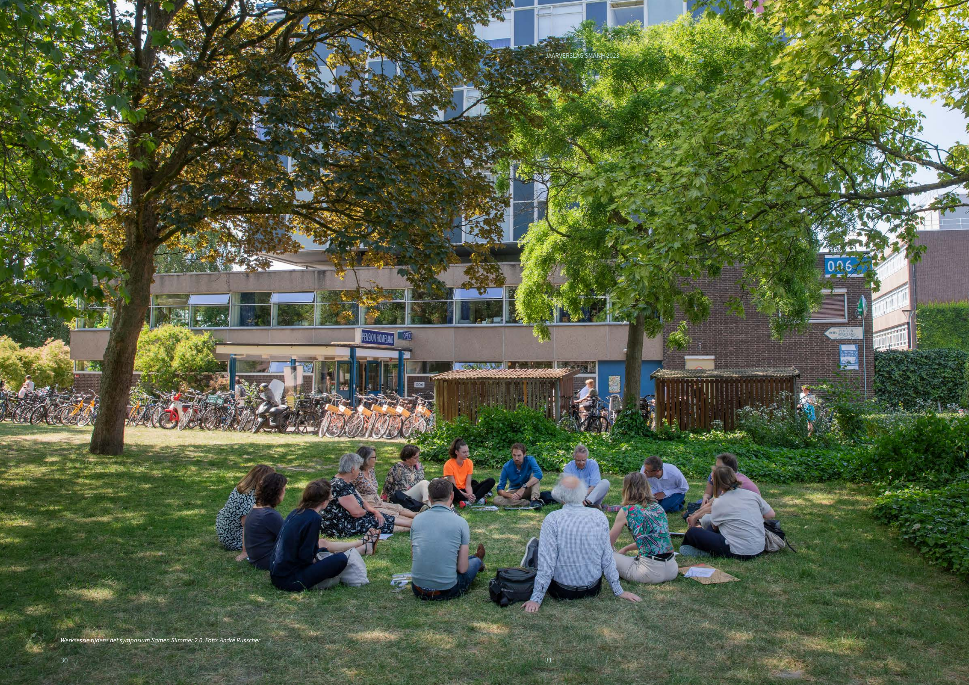
Werk sessie tijdens het symposium Samen Slimmer 2.0.