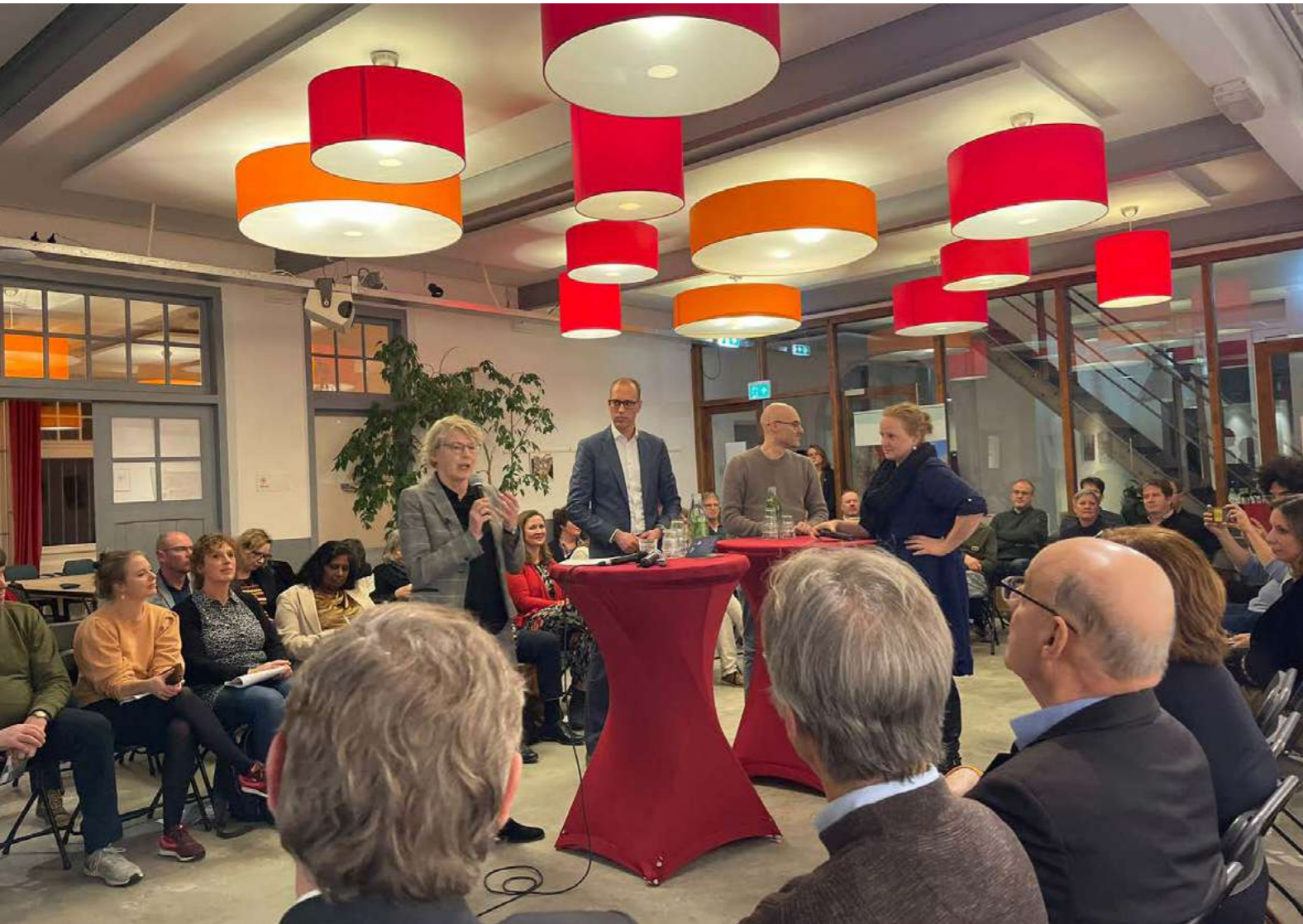
Steunpunt Erfgoeddebat 2023.