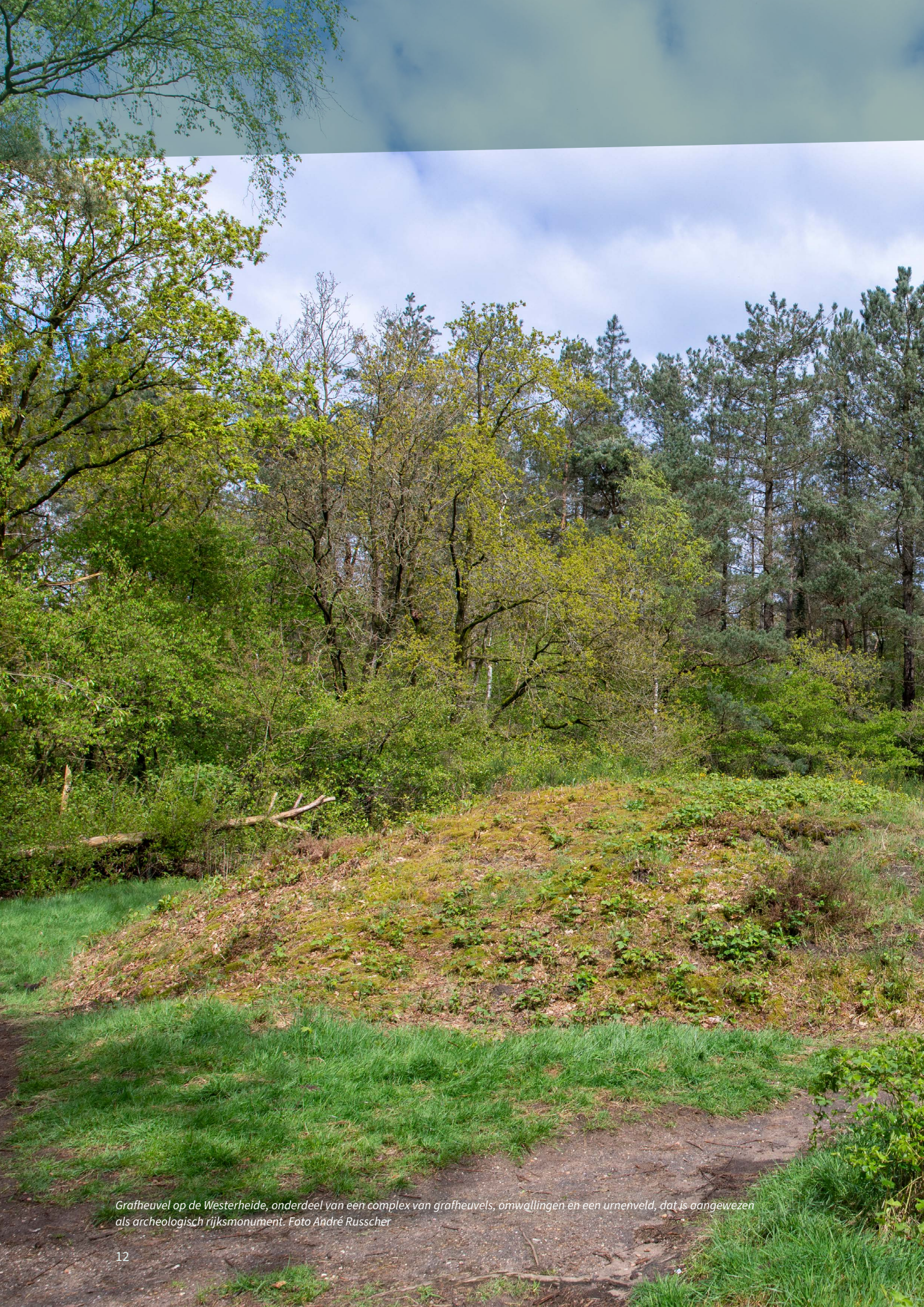
Grafheuvel op de Westerheide, onderdeel van een complex van grafheuvels, omwallingen en een urnenveld, dat is aangewezen als archeologisch rijksmonument.