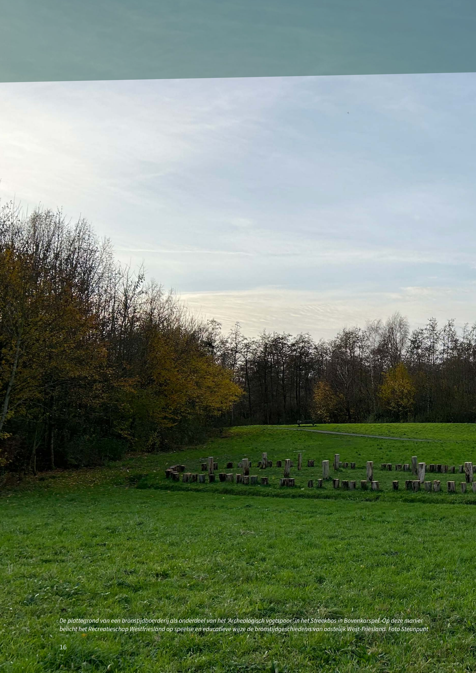
De plattegrond van een bronstijdboerderij als onderdeel van het 'Archeologisch voetspoor' in het Streekbos in Bovenkarspel. Op deze manier belicht het Recreatieschap Westfriesland op speelse en educatieve wijze de bronstijdgeschiedenis van oostelijk West-Friesland.