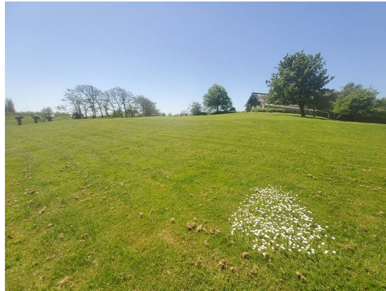
Terp Avendorp is een verhoogde woonplaats uit de middeleeuwen die is aangewezen als archeologisch rijksmonument.

De gemeente kan met de initiatiefnemer in gesprek gaan over het aanpassen van het plan. Bij planaanpassing kan worden gedacht aan het ‘omdraaien van deelgebieden’: plan een groenzone, bovengrondse parkeerplaats of speeltuin op de locatie van een archeologische vindplaats. En plan de