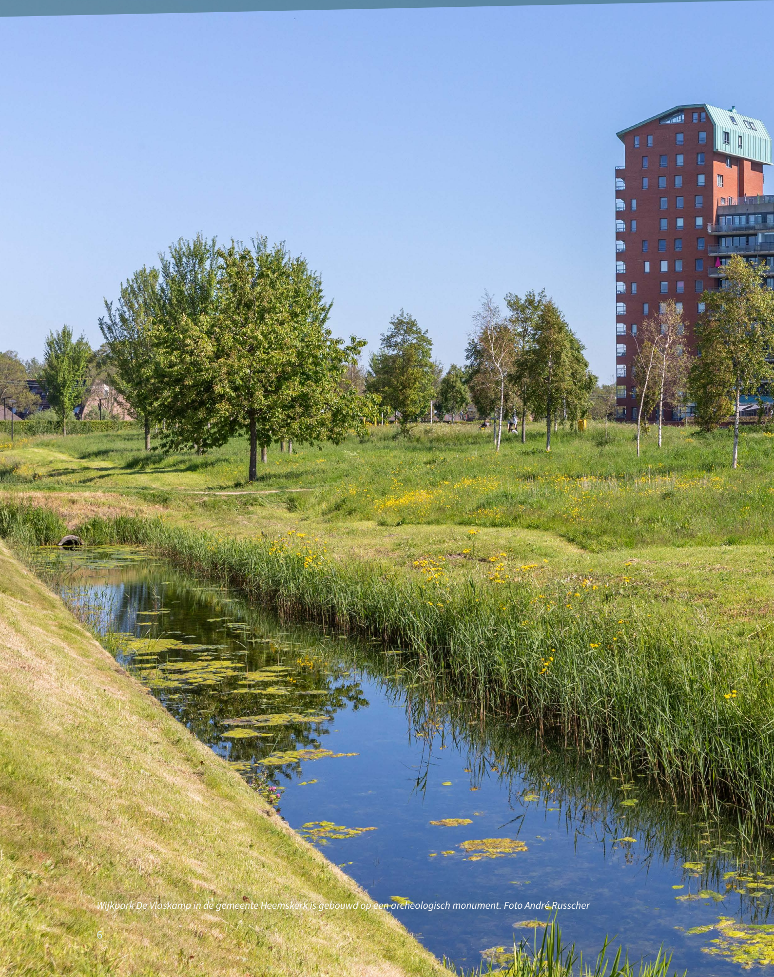
Wijkpark De Vlaskamp in de gemeente Heemskerk is gebouwd op een archeologisch monument.